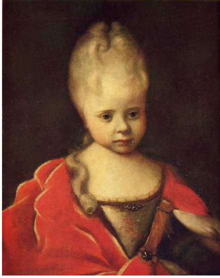
Resim 5- İvan NİKİTİN, Çariçe Yelizavet Petrovna'nın Çocukluğu, 1712-1713, tuval üzerine yağlı boya, 54 x 43 cm., Ermitaj Müzesi, Peterburg.