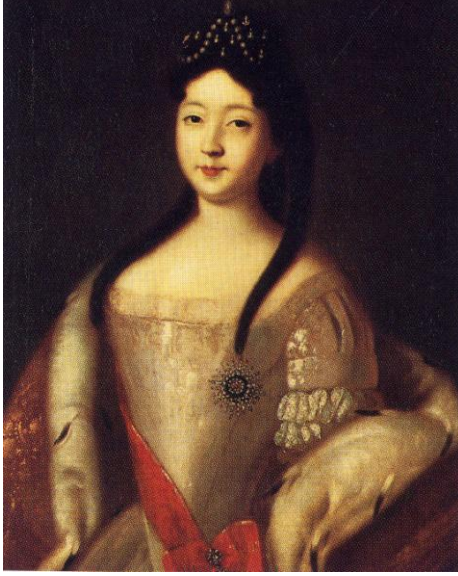
Resim 1- Louis CARAVAQUE, Çariçe Anna Petrovna'nın Portresi, 1725, tuval üzerine yağlı boya, 91,2 x 73,4 cm., Tretyakov Galerisi, Moskova.