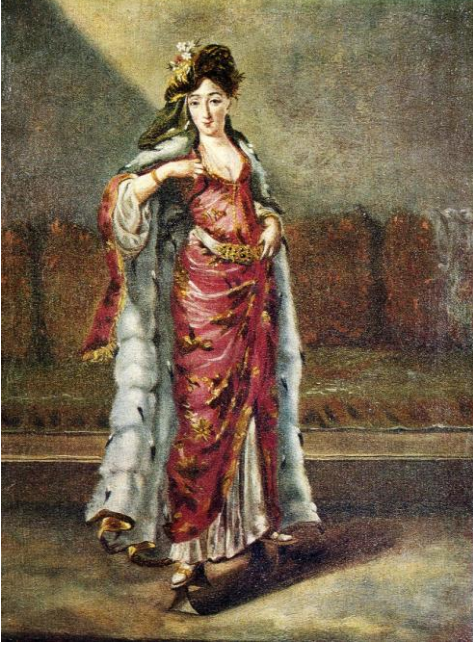
Resim 3- Hristian MATTARNOVİ, Saraylı Kadın, 1725, tuval üzerine yağlı boya, 38,2 x 28 cm., Ermitaj Müzesi, Peterburg.