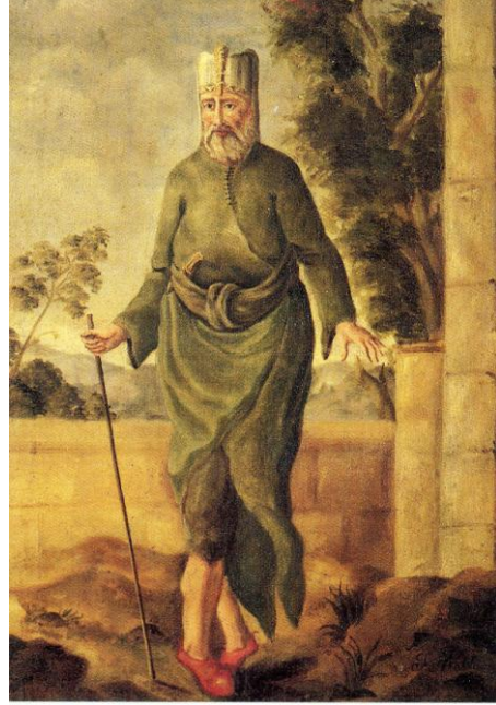
Resim 4- Hristian MATTARNOVİ, Yaşlı Türk, 1725, tuval üzerine yağlı boya, 34,5 x 25 cm., Ermitaj Müzesi, Peterburg