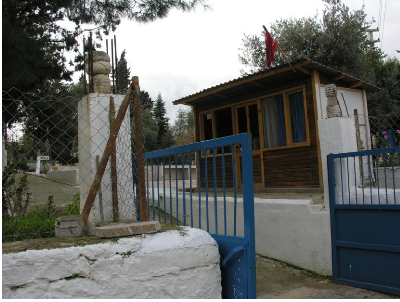
Fot. 1- Yelki Mezarlığı girişı.