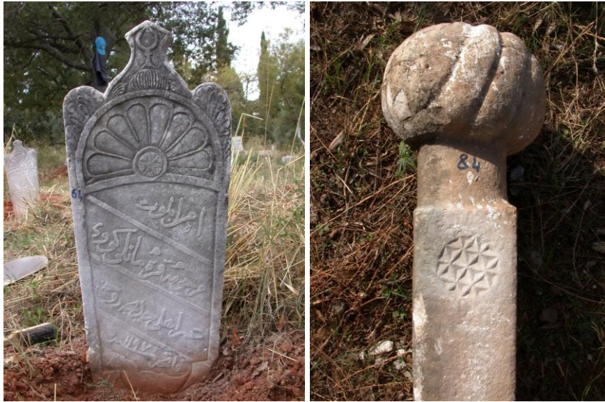
Fot.9,10- Yelki Mezarlığı. Kadın ve erkek mezar taşında geometrik süslemeler.