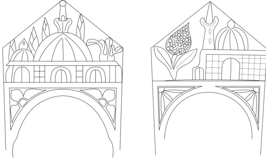
Şek. 5- Yelki Mezarlığı. Kadın mezar taşlarında mimari tasvirler.

Bu taşlar, aşağıdan yukarıya doğru genişleyerek, genellikle üçgen veya sivri kemere benzer bir alınlıkla son bulmaktadır. Alınlığın içine yerleştirilen mimari tasvirler, ortada ya da yanlarda yer alabildiği gibi, alınlığın bütün yüzeyini kaplayacak şekilde de yerleştirilebilmektedir. Tasvir yana kaydırılmışsa, diğer tarafa genellikle, saksı çiçeği, bir vazoda çıkan çiçek demetleri veya büyükçe bir yaprak motifi işlenmiştir.