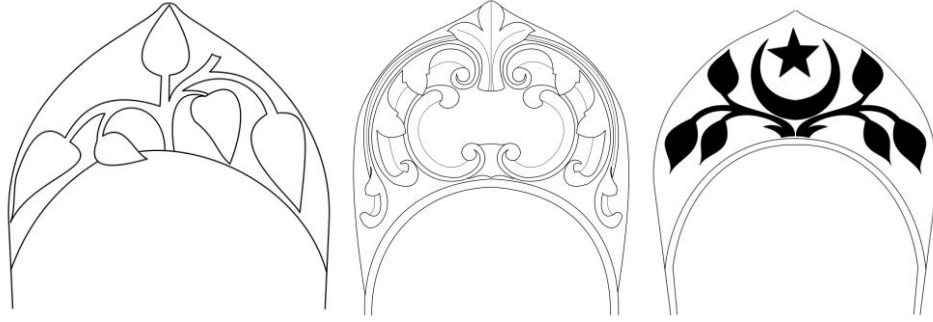
Şek. 3- Yelki Mezarlığı. Kadın mezar taşlarında bitkisel süslemeler.

üzerinde yoğun olarak görülmektedir. Yelki mezar taşlarında, başta Hz. Muhammed'in sembolü olan gül, güzellik ve zerafetin sembolü olan lale olmak üzere, sürekli yeşil kalmasıyla ve uzun boyuyla ebedi olanı simgeleyen servi ağacı 2 ; ve birçok stilize bitki motifi bulunmaktadır 3 . Türk süsleme sanatlarında, üzüm, nar, incir, haşhaş, enginar, mısır koçanı, ve buğday başağı gibi taneli bitki ve meyvalar genellikle, doğurganlığın, bereketin ve hayat ağacı'nın sembolü olarak 4 , eski çağlardan beri kullanılagelen süslemeler arasındadır 5 . Ancak, Yelki mezar taşlarında bu tür bezemelere rastlanmamaktadır. Mezar taşlarında, doğada bulunmayan gerçek dışı yaprak motiflerinin yanısıra, kenger, hurma ve çınar ağacının yaprakları ile yasemin, lale, sümbül, karanfil, nergis gibi çiçekler de hayat ağacı motifi olarak değerlendirilmiştir. Enginar bitkisi, servi ağacı ve asma dalı motifleri genellikle serbest biçimlerde uygulanırken, yasemin, sümbül, sarmaşık, karanfil gibi çiçeklerin, daha çok vazo içinde veya çiçek sepeti şeklinde tasarlandığı görülmektedir.