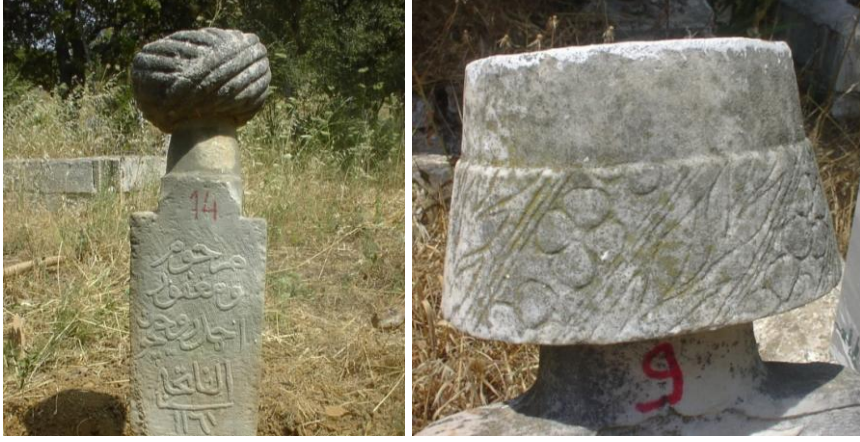
Fot.3,4- Yelki Mezarlığı. Erkek mezar taşlarından örnekler.