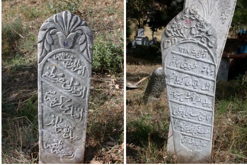
Fot.5,6- Yelki Mezarlığı. Kadın mezar taşlarında bitkisel süslemeler.