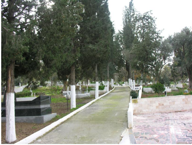
Fot.2- Yelki Mezarlığı. 1 ve 2 numaralı adaları ayıran yol.