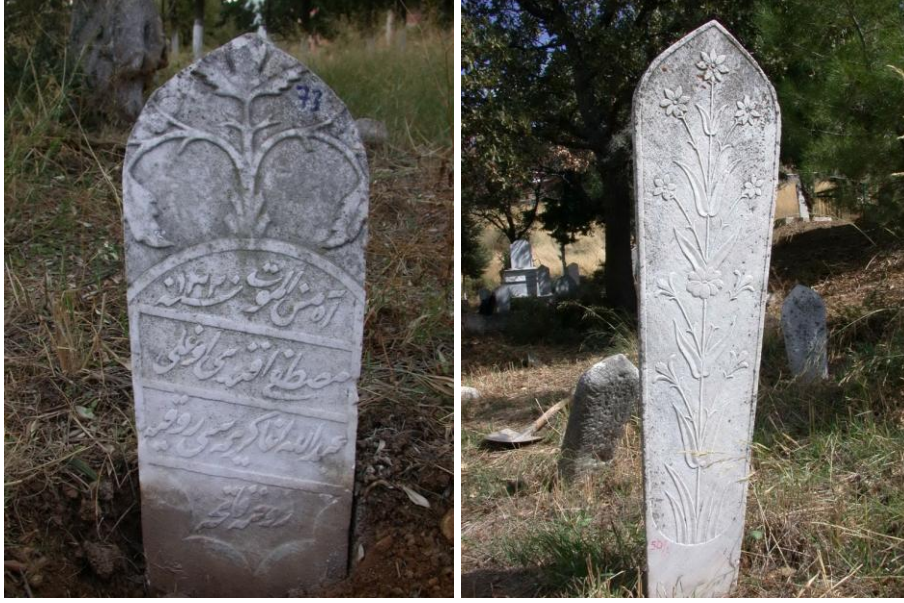
Fot.7,8- Yelki Mezarlığı. Kadın mezar taşlarında bitkisel süslemeler.