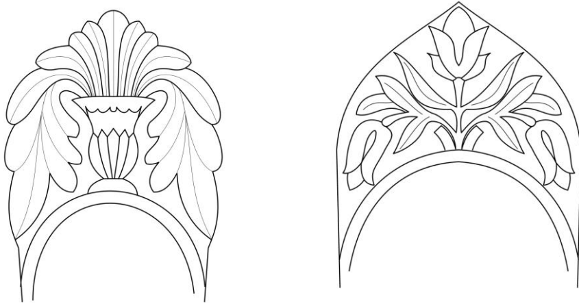
Şek. 2- Yelki Mezarlığı. Kadın mezar taşlarında bitkisel süslemeler.

Erkek mezar taşları, gövde üzerinde bir kitabelik, onun üzerinde bir boyun ve bir başlıktan oluştuğu için, süsleme yapılacak alan açısından sınırlıdır. Genellikle kitabeliği çerçeveleyen çiçek, yaprak ya da geometrik kenar şeritleri; boyun kısmında alem ve başlık üzerinde, feslerde püskül, sarıklarda dolamların arasına sıkıştırılmış gül ana süsleme öğelerini oluşturmaktadır (Fot. 3,4).