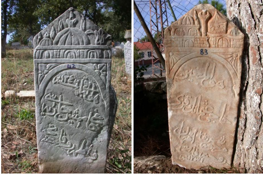
Fot.11,12- Yelki Mezarlığı. Kadın mezar taşlarında cami tasvirleri.