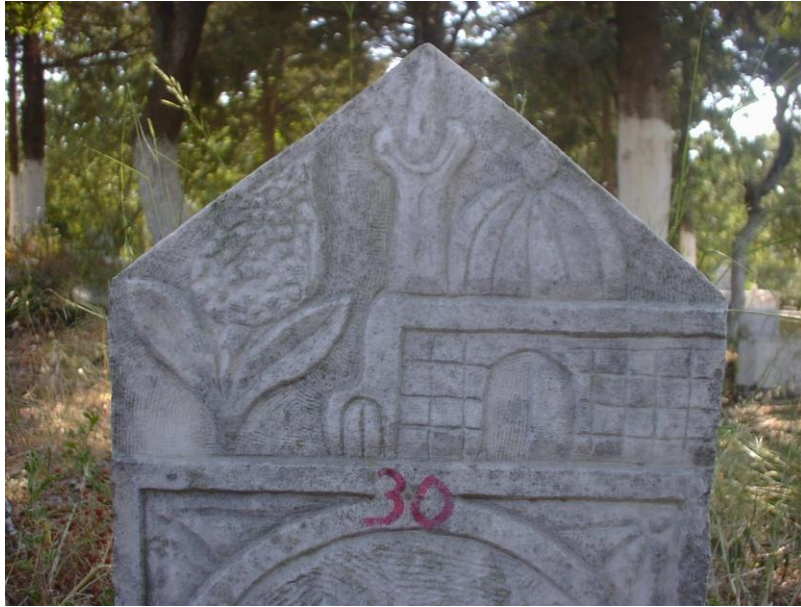
Fot.13- Yelki Mezarlığı. Kadın mezar taşında cami tasviri.