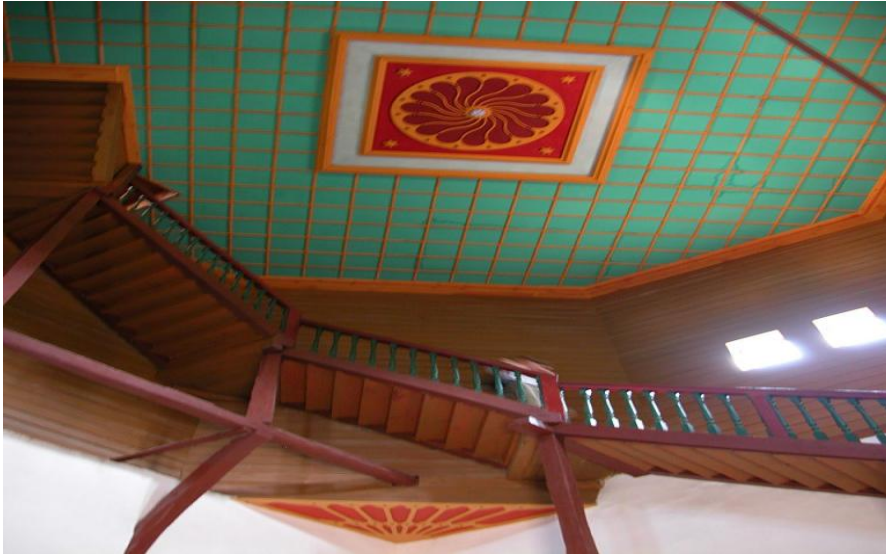
Res. 16- Kırım-Bahçesaray Han Sarayı Seyir Kulesi'ne çıkan ahşap merdivenler ve tavan süslemesi