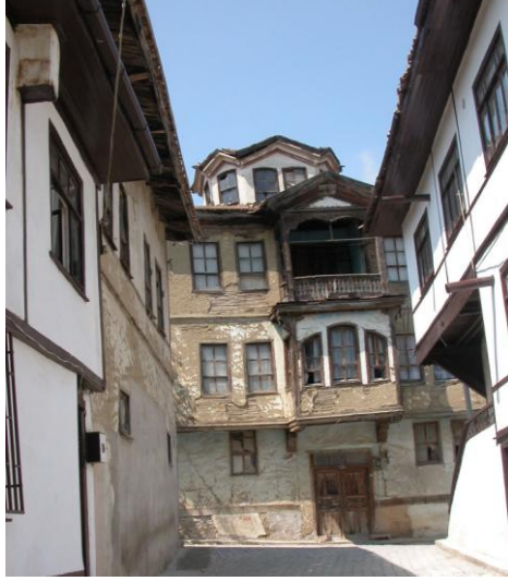
Res. 1- Sakarya-Taraklı'da XIX. yy. sonlarından kalan Fenerli Ev