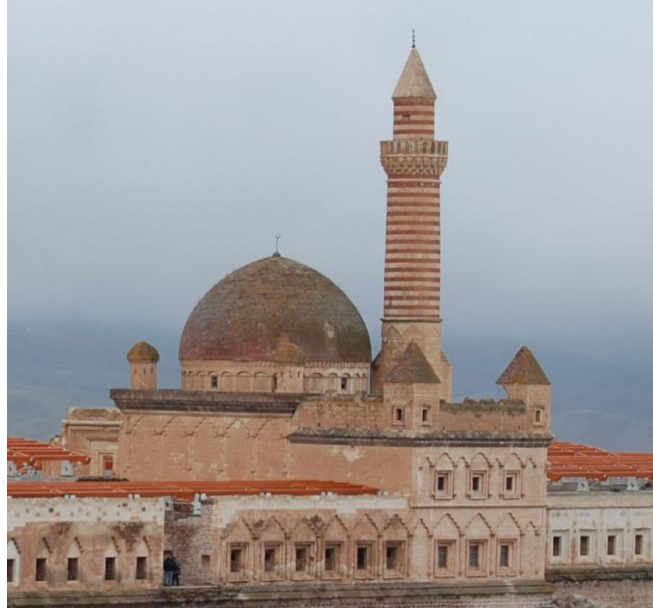
Res. 6- Doğubayazıt İshak Paşa Sarayı medrese kuleleri