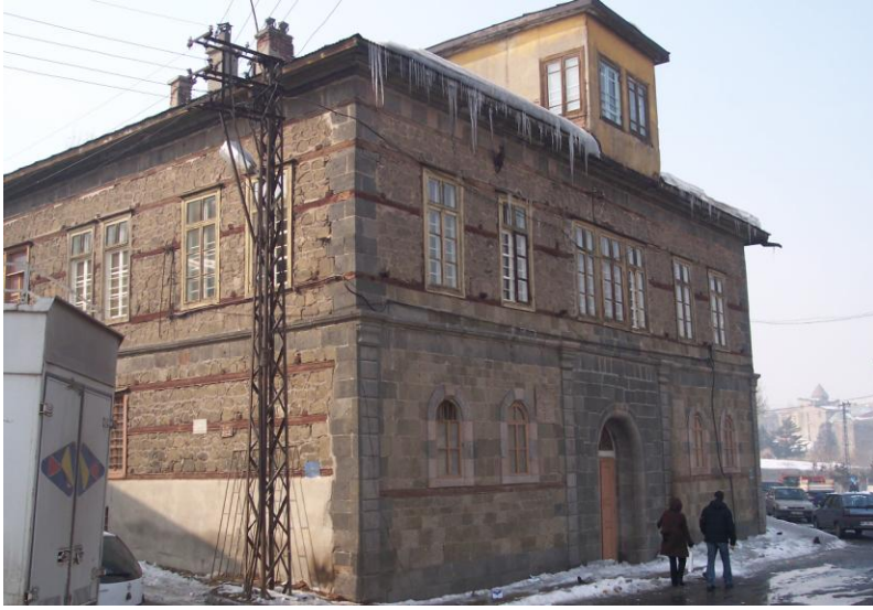
Res. 10- Erzurum Kullebi Evi