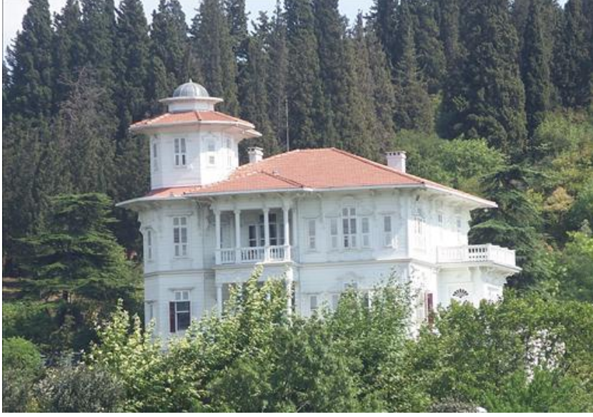
Res. 3- İstanbul-Kuzguncuk'ta 1885 tarihli Cemil Molla yalısı