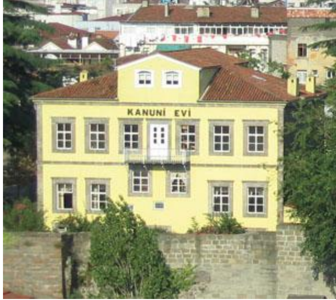
Res. 8- Trabzon-Eskihisar Kanuni Evi