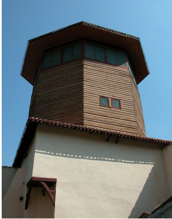
Res. 17- Kırım-Bahçesaray Han Sarayı seyir kulesi