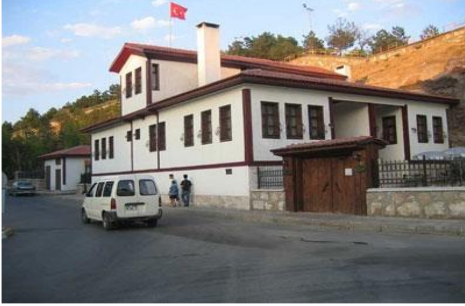
Res. 9- Sivas evi