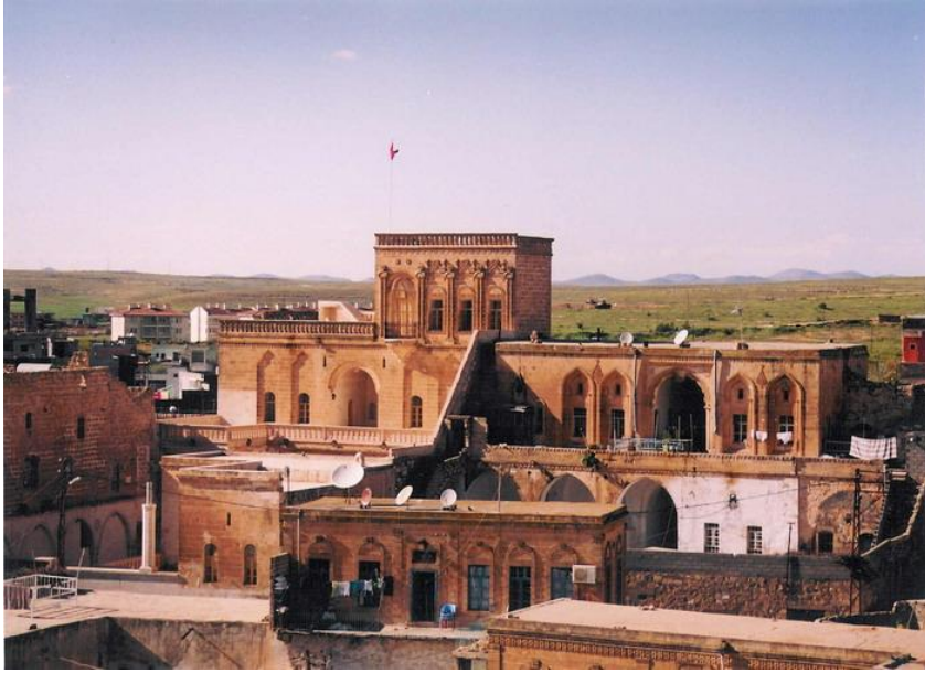
Res. 4- Mardin-Midyat'ta XIX. yy sonundan kalan Konuk Evi