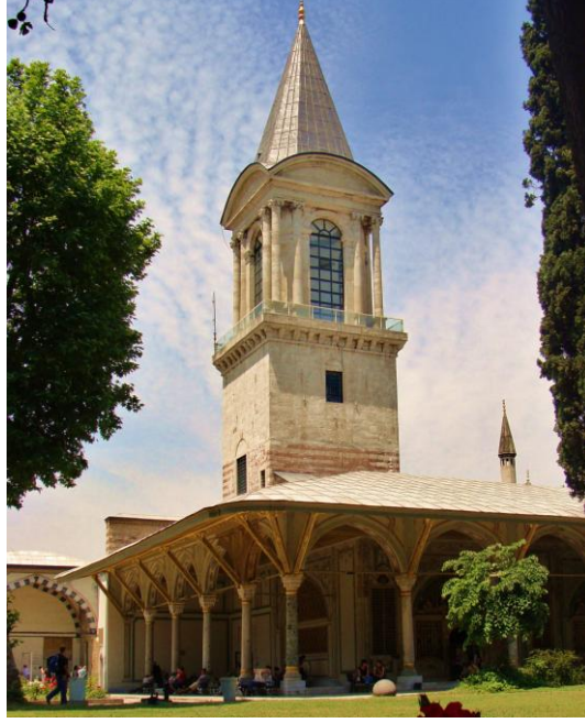
Res. 15- Topkapı Sarayı Adalet Kulesi