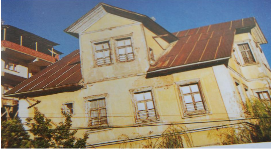
Res. 7- Gümüşhane Erdemir AKGÜN Evi (V.ŞENEL'den)