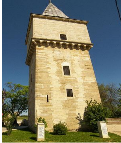
Res. 14- Edirne Sarayı Adalet Kasrı