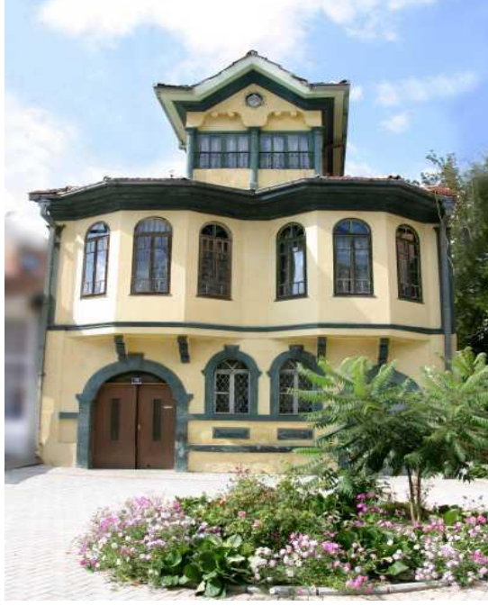
Res. 11- Makedonya'da XIX. yy. sonlarından kalan Osmanlı evi