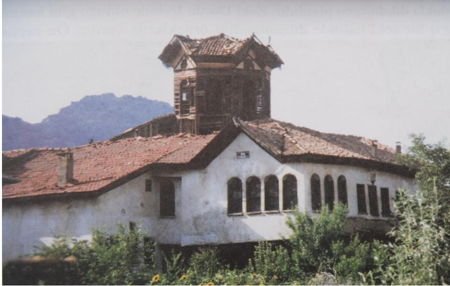
Res. 2- Sivas-Divriği'de XIX. yy. sonlarından kalan Tevrüz Evi (S.ŞENOL)