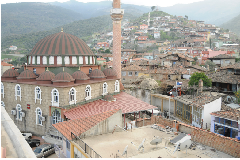
Resim 1- Bozdoğan Çarşı Camii ve Çarşı Hamamı'nın kuzeydoğudan genel görüntüsü.