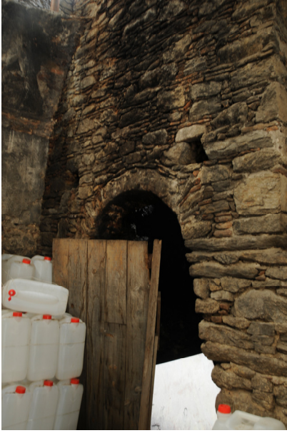
Resim 17- Bozdođan arşı Hamamı. Ocak.