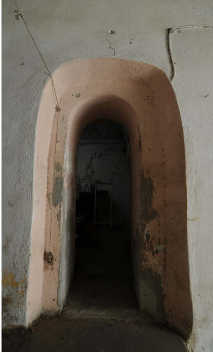
Resim 6- Bozdođan arşı Hamamı. İllıklık girişı.