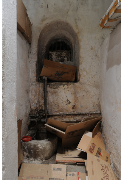
Resim 14- Bozdoğan Çarşı Hamamı. Su deposu kontrol penceresi.