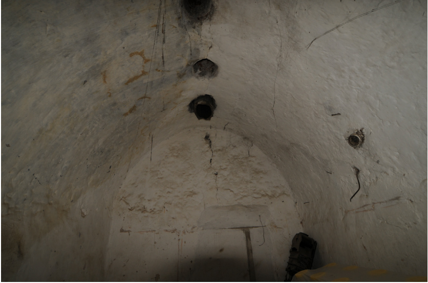
Resim 10- Bozdođan arşı Hamamı. Tıraşlık.