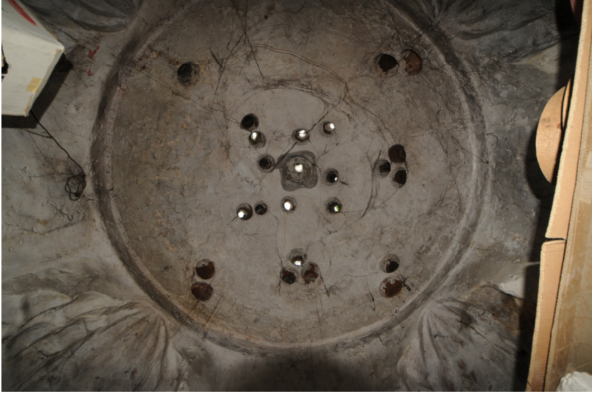
Resim 11- Bozdoğan Çarşı Hamamı. Sıcaklık kubbesi.