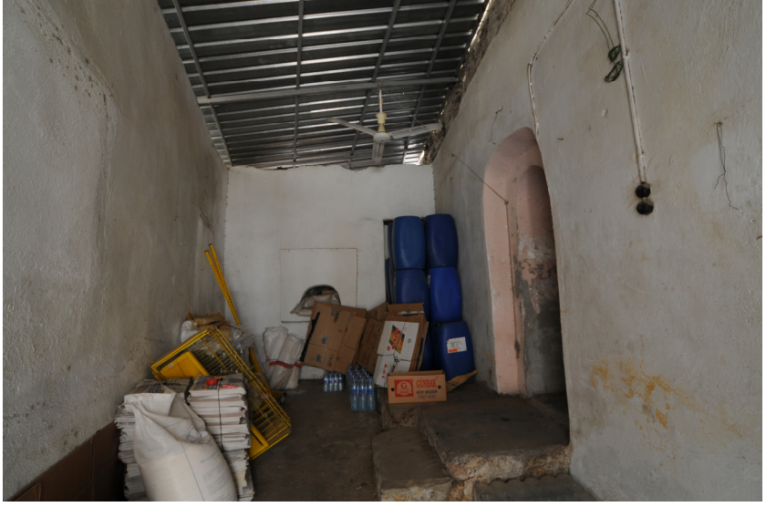
Resim 5- Bozdođan arşı Hamamı. Soyunmalık.