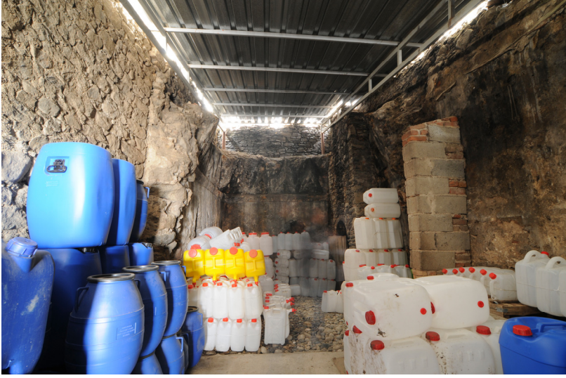
Resim 15- Bozdoğan Çarşı Hamamı. Kuzeybatıdaki mekan.