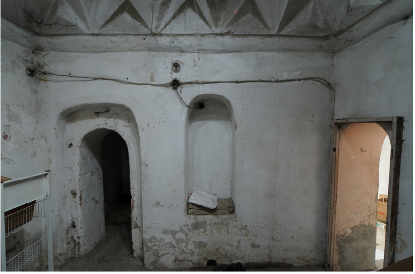
Resim 9- Bozdođan arşı Hamamı. Ilıklıđın dođu duvarı.