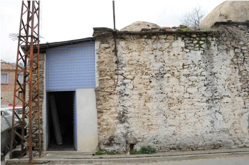
Resim 4- Bozdoğan Çarşı Hamamı. Soyunmalık girişi.