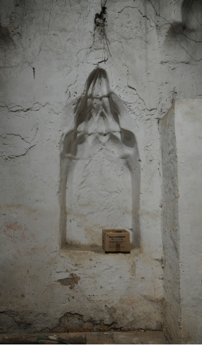
Resim 13- Bozdoğan Çarşı Hamamı. Sıcaklığın güney duvarındaki niş.