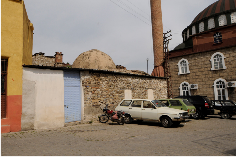
Resim 2- Bozdoğan Çarşı Hamamı. Güneybatıdan genel görünüş.