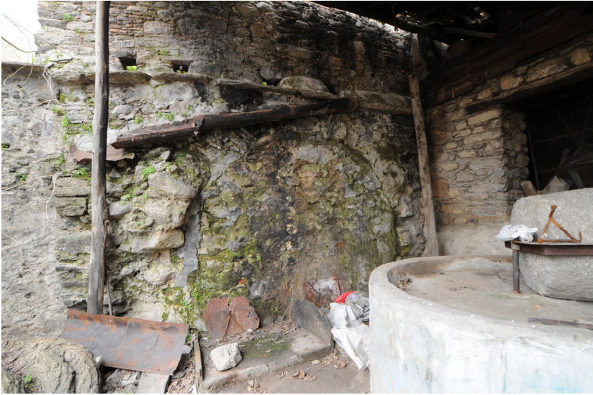
Resim 18- Bozdođan arşı Hamamı. Kuzeydeki tonozlu mekan izi.