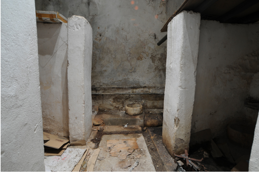
Resim 12- Bozdoğan Çarşı Hamamı. Sıcaklık.