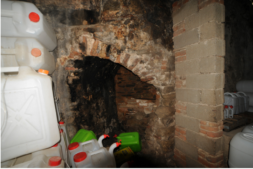
Resim 16- Bozdoğan Çarşı Hamamı. Kuzeybatıdaki mekanda köşe girişi.