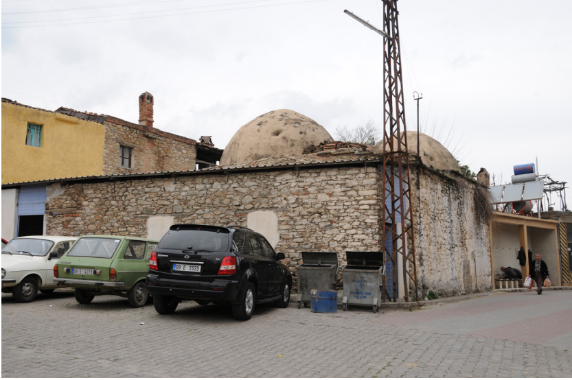
Resim 3- Bozdoğan Çarşı Hamamı. Güneydoğudan genel görüntü.