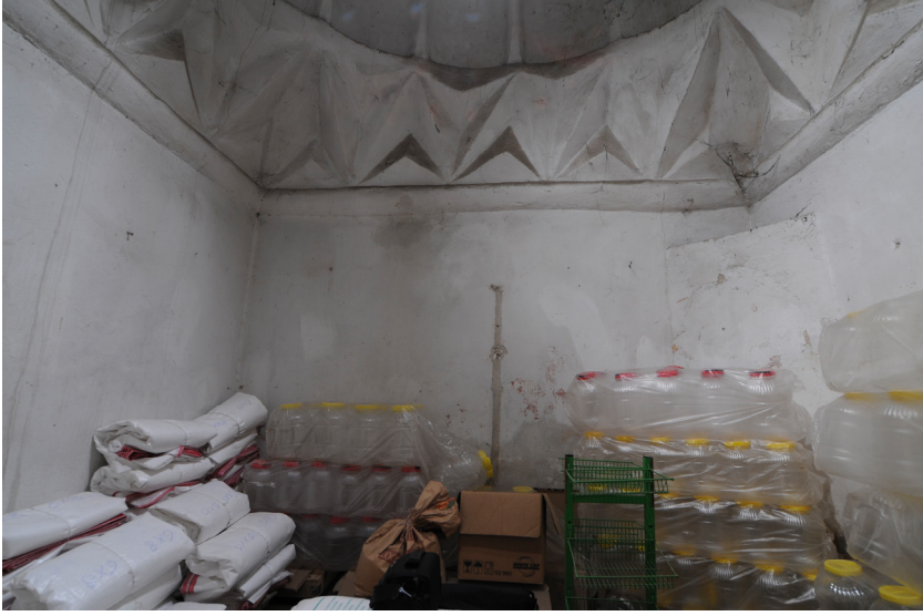
Resim 7- Bozdoğan Çarşı Hamamı. Ilıklık.