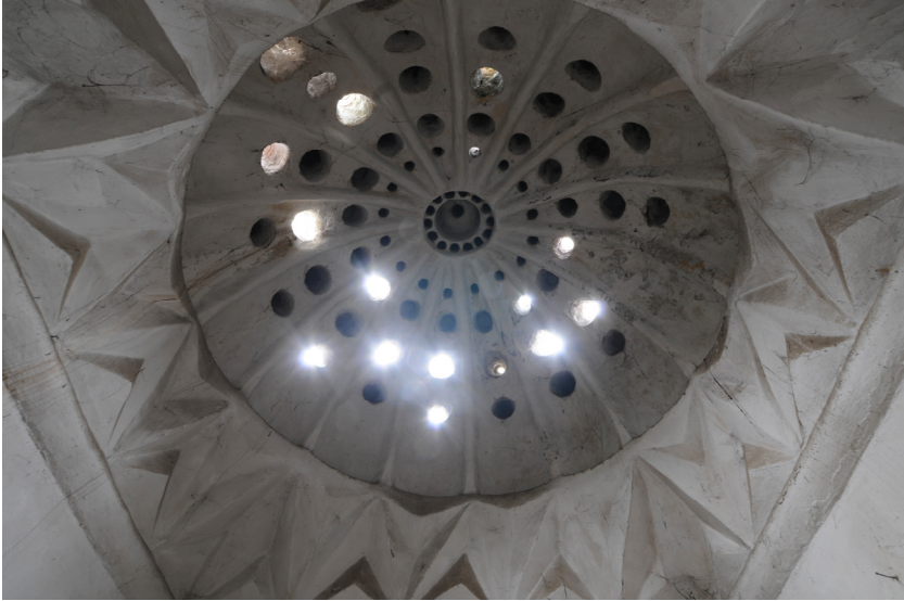
Resim 8- Bozdoğan Çarşı Hamamı. Ilıklık kubbesi.