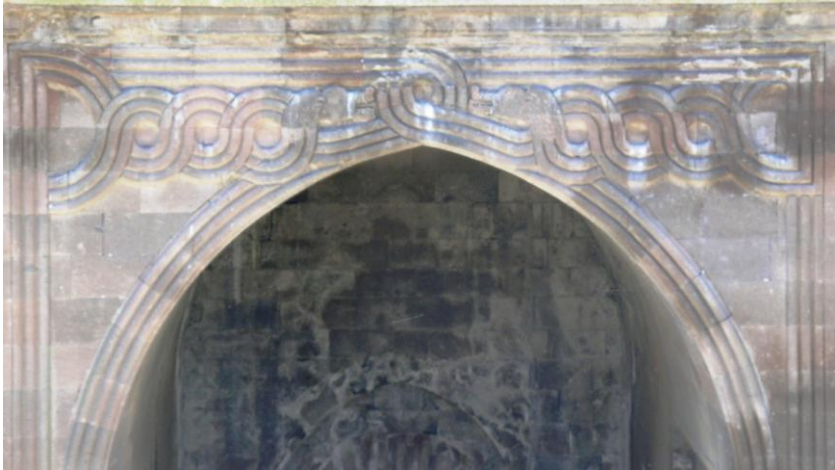
Foto:12- Kayseri Karatay Han Portalin İç Yüzünde Yer Alan Ejderler