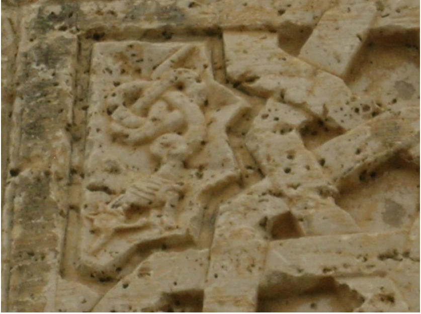
Foto:11- Burdur Susuz Han Portalinde Yer Alan Ejder.