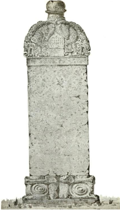
Foto:19 Karabalgasun Yazıtı Olarak Bilinen III. Uygur Yazıtındaki Ejderler(H.Namık Orkun'dan)