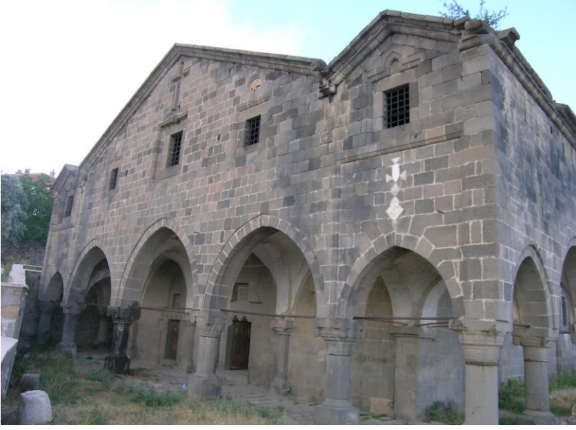
Foto:1-Hamamlı Köyü Kilisesi.