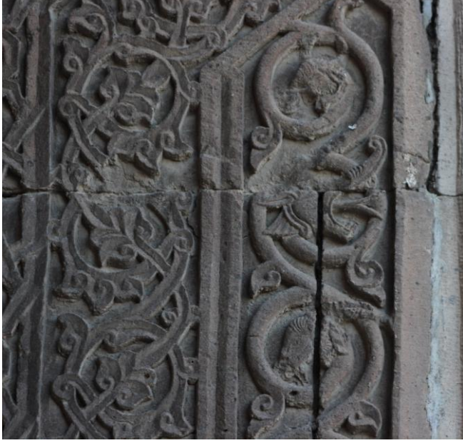
Foto:17-Niğde Sungurbey Camisi Doğu Kapısındaki Ejder Figürü.