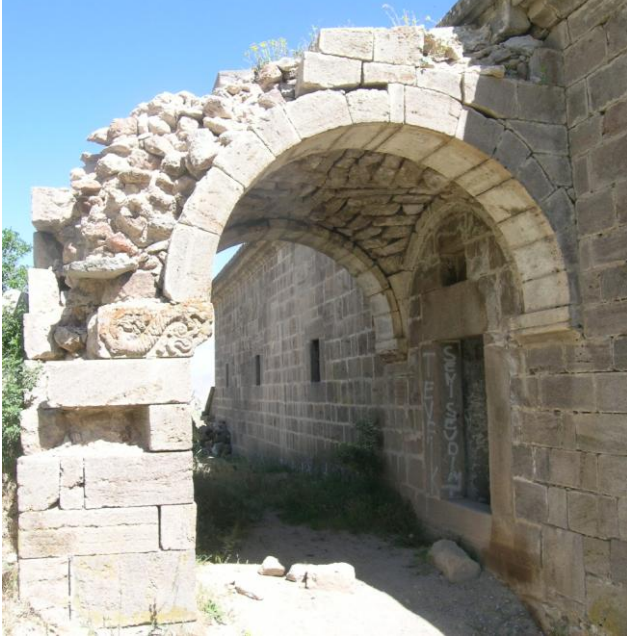
Foto:9-Küçükköy Hagios Nikolaos Kilisesinde Ejder Figürlü Üzengi Taşı.