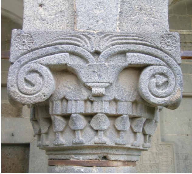
Foto:3-Hamamlı Köyü Kilisesi Ejder Figürlerinin Yer Aldığı Sütunun Batı Yüzü.