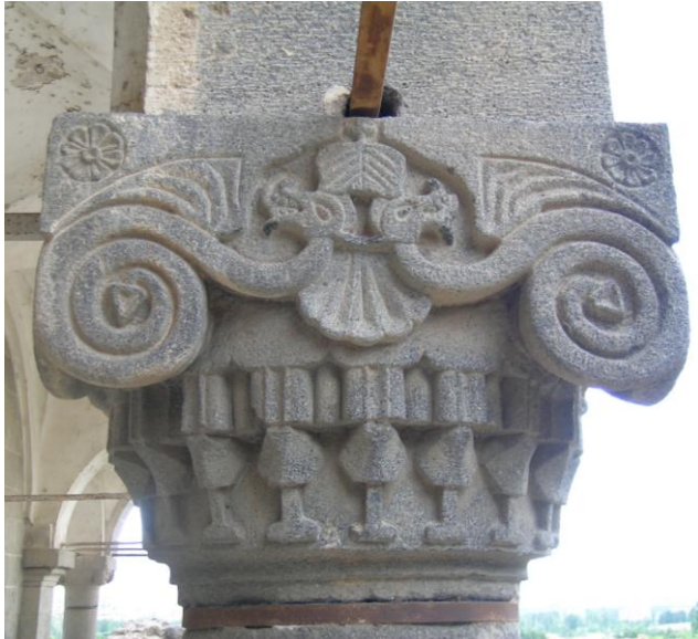
Foto:4-Hamamlı Köyü Kilisesi Ejder Figürlerinin Yer Aldığı Sütunun Kuzey Yüzü.