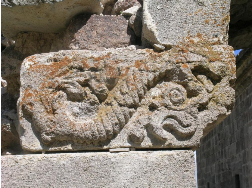
Foto:16-Küçükköy Hagios Nikolaos Kilisesinde Yer Alan Ejder Figürü.