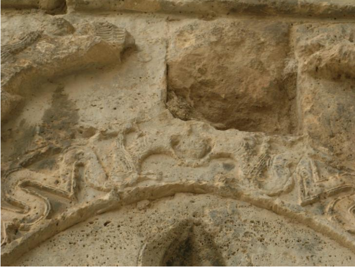
Foto:10- Burdur Susuz Han Portal Mihrabiyelerinde Yer Alan Ejderler.