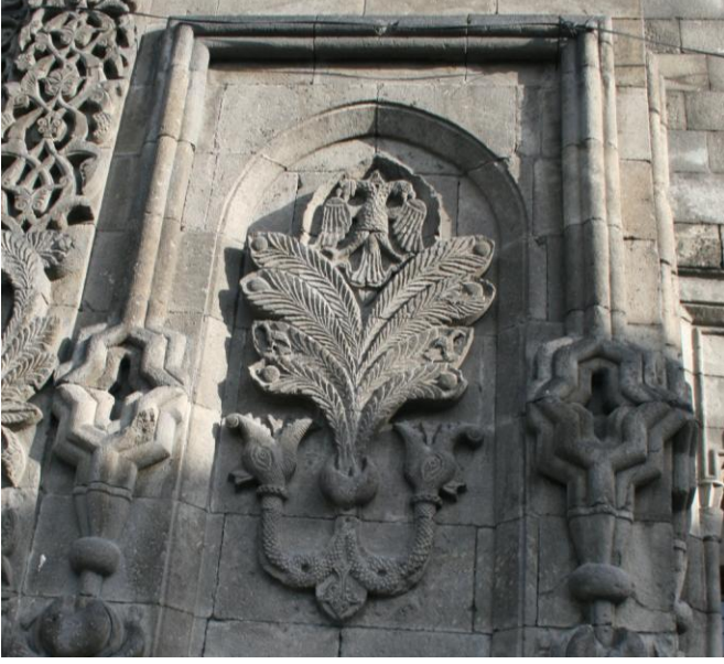
Foto:21- Erzurum Çifte Minareli Medrese'nin Taç Kapısında Yer Alan Hayat Ağacı ve Ejderler.