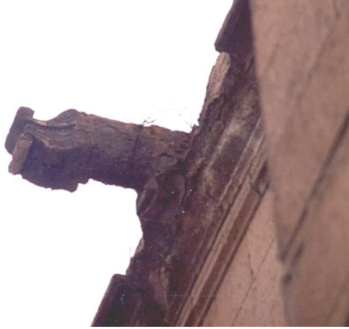
Foto:20 Niğde Üniversitesi Kültür ve Sanat Evi'nin Ejder Başlı Çörteni.