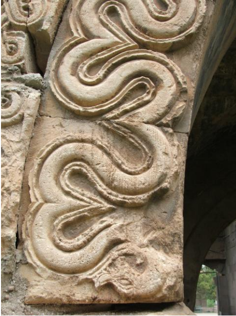
Foto:14- Kayseri Sultan Han Köşk Mescid Güney Duvarındaki Ejder Başı Şeklinde Biten Kuyruk.