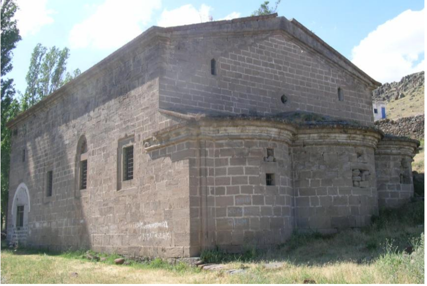
Foto:7-Küçükköy Hagios Nikolaos Kilisesi.

Niğde'deki Hristiyan Türk Kiliselerinde Yer Alan Ejder Figürleri:.....