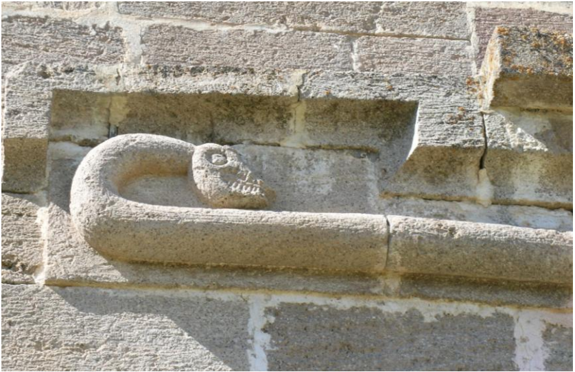
Foto:8-Küçükköy Hagios Nikolaos Kilisesi Apsisini Kuşatan İki Başlı Yılanın Güney Cephede Yer Alan Başı