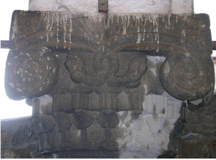
Foto:5-Hamamlı Köyü Kilisesi Ejder Figürlerinin Yer Aldığı Sütunun Doğu Yüzü.