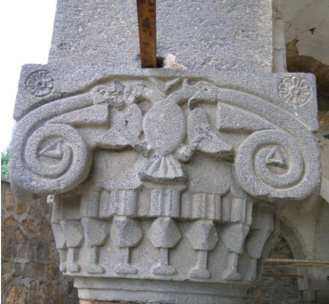
Foto:6-Hamamlı Köyü Kilisesi Ejder Figürlerinin Yer Aldığı Sütunun Güney Yüzü.