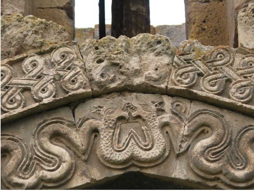
Foto:13- Kayseri Sultan Han Köşk Mescidinde Yer Alan Ejderlerden.