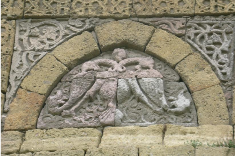
Foto:18-Niğde Hüdavent Hatun Türbesindeki Çift Başlı Kartal ve Kanat Uçlarındaki Ejder Başları.