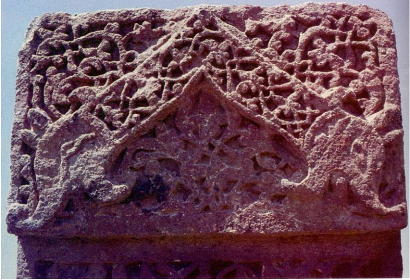
Foto:15- Ahlat Mezar Taşlarından Yer Alan Bir Ejder Figürü (B. Karamağaralıdan)