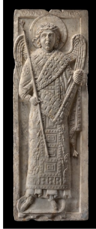
Res. 9 Mikâil tasvirli ikona (Effenberger-Severin 1992, 245-247 Nr. 147)