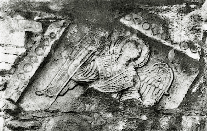
Res. 6 Mikâil tasvirli levha (Robert-Robert 1954, 152 Pl. XXX, 1)