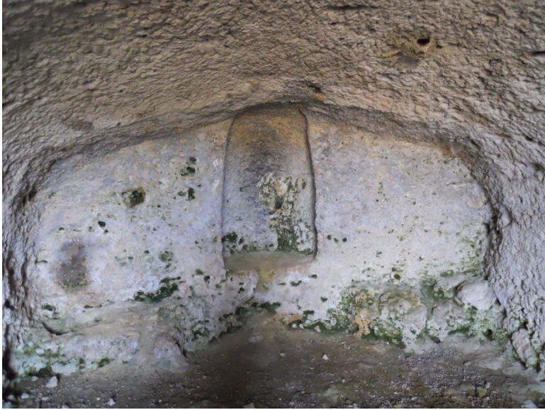
Res. 5 Kilisenin apsisi