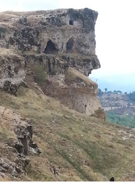
Res. 1 Tabae Kaya Kilisesi