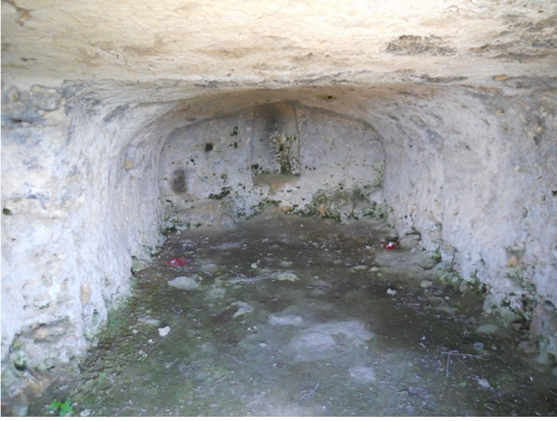
Res. 4 Kilisenin iç mekanı