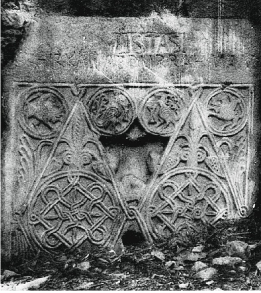
Res. 8 Geometrik desenli levha (Robert-Robert 1954, 152 Pl. XXX,4)