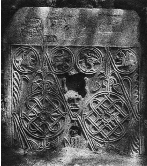
Res. 7 Geometrik desenli levha (Robert-Robert 1954, 152 Pl. XXX,3)