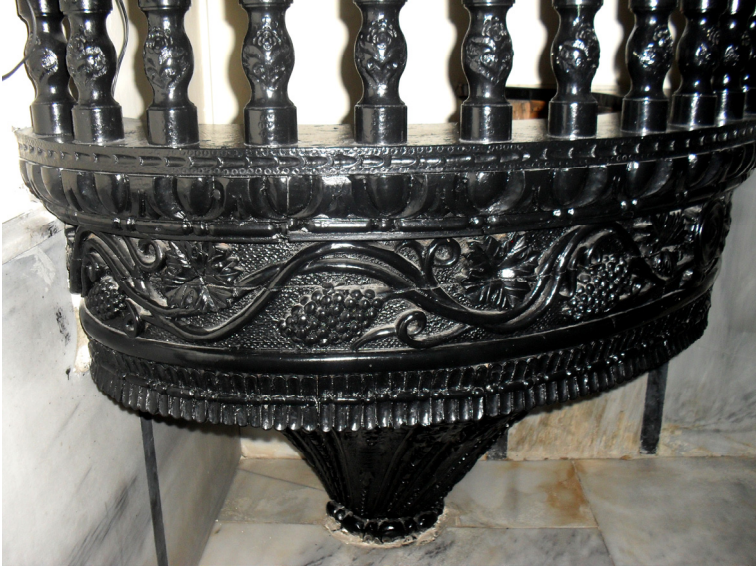
Fot.9- Bursa Abdal Mehmed Camii Va'z Kirsüsü Gövde Detayı.