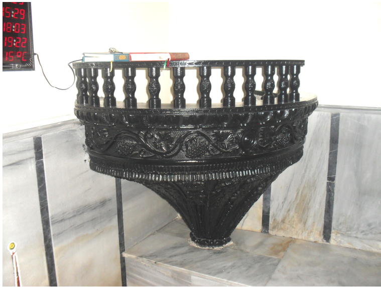
Fot.8- Bursa Abdal Mehmed Camii Va'z Kürsüsü Sol Yan Görünüşü.