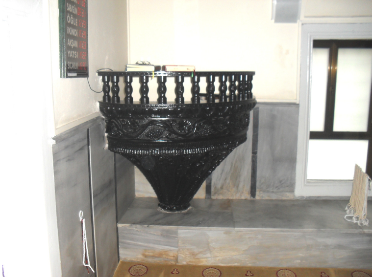
Fot.7- Bursa Abdâl Mehmed Camii Va'z Kürsüsü Genel Görünüşü.