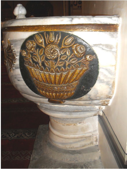
Fot.2- Bursa Ulu Camii Va'z Kürsüsü Sağ Yan Görünüşü.