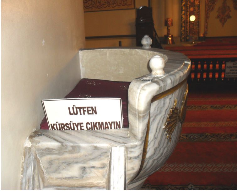
Fot.5- Bursa Ulu Camii Va'z Kürsüsü Korkuluğu ve Oturma Yeri.