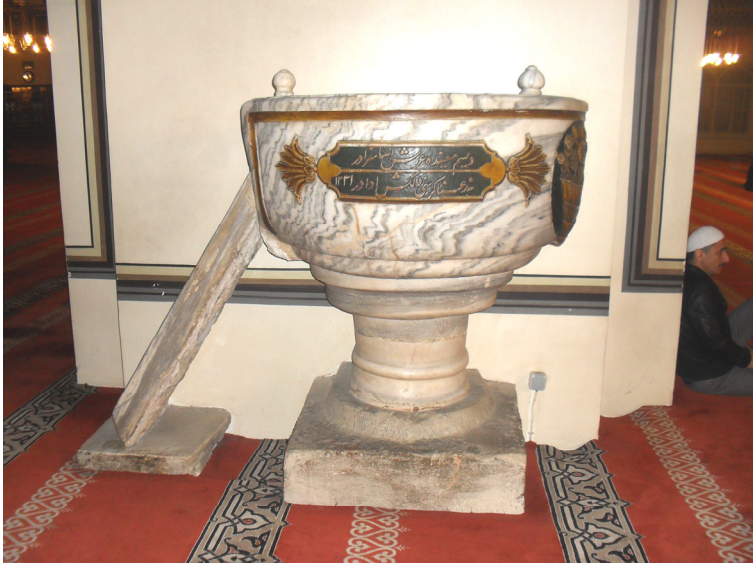
Fot.1- Bursa Ulu Camii Va'z Kürsüsü Genel Görünüşü.