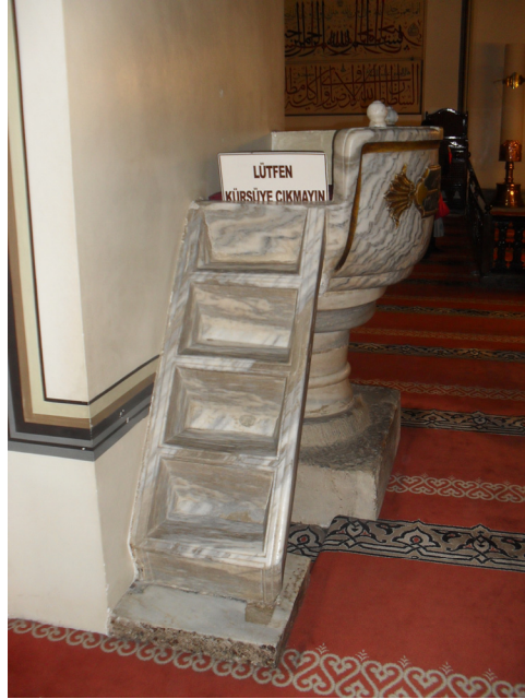
Fot.6- Bursa Ulu Camii Va'z Kürsüsü Sol Yan Görünüşü.