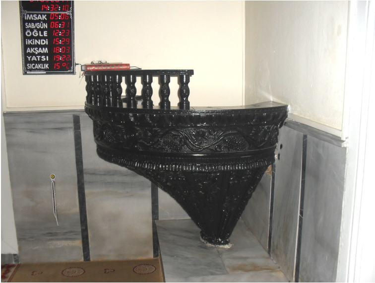
Fot.10- Bursa Abdal Mehmed Camii Va'z Kirsüsü Sağ Yan Görünüşü.