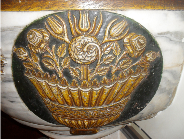
Fot.4- Bursa Ulu Camii Va'z Kürsüsü Süslemesi.