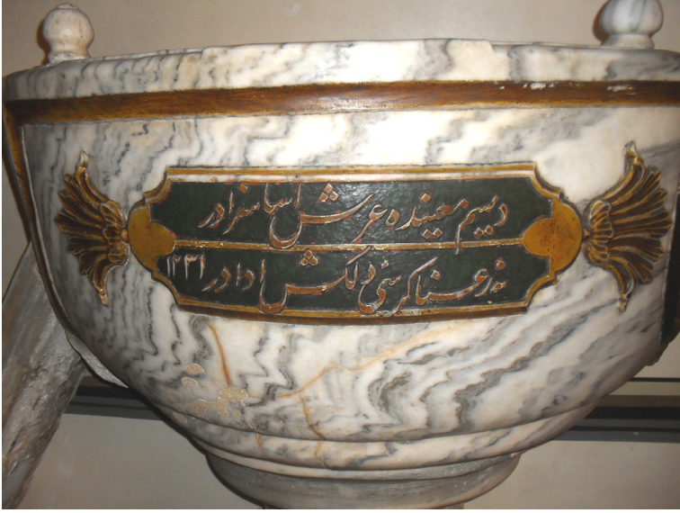
Fot.3- Bursa Ulu Camii Va'z Kürsüsü Kitabesi.