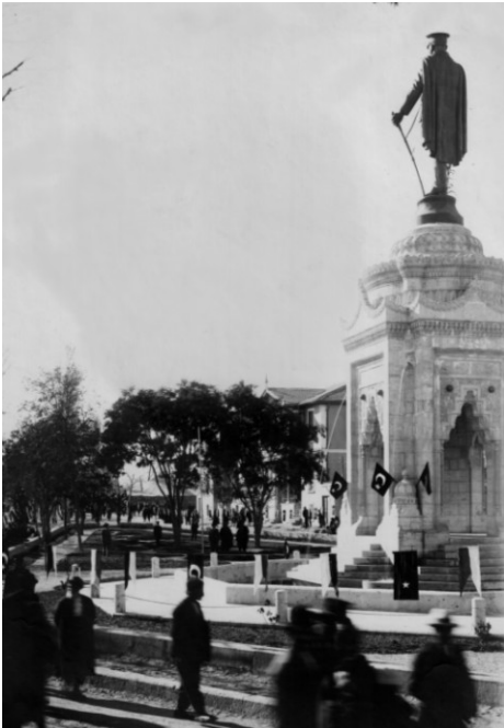
Fot.-6- Atatürk Anıtı