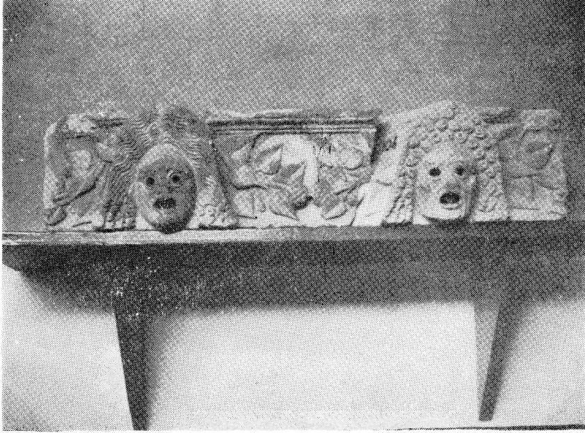
Res. 1— Bergama Müzesi'ndeki 906 Env. No.lu friz parçası.