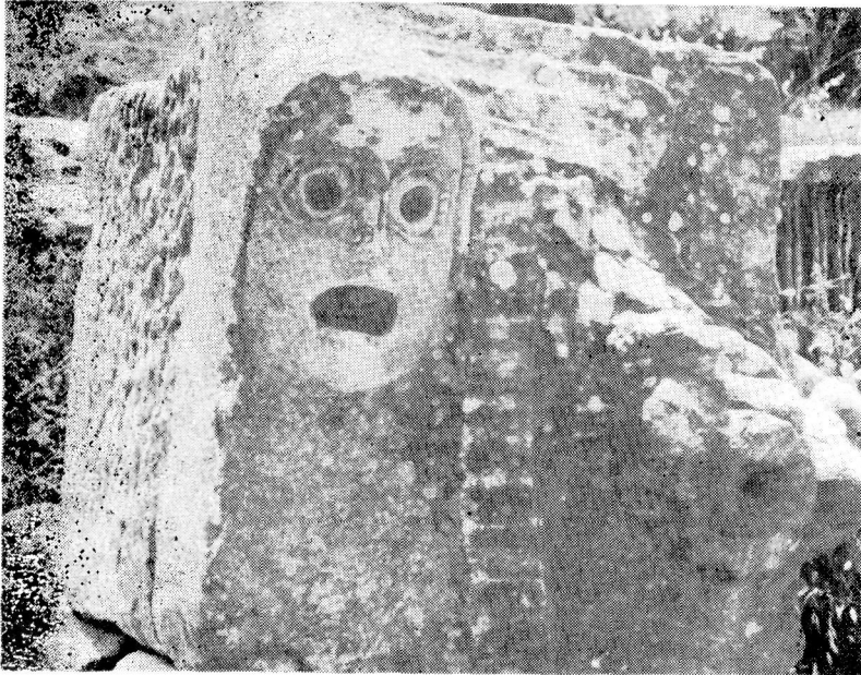
Res. 4— Ephesos Tiyatrosu. Sahne kısmına ait olan friz parçası.