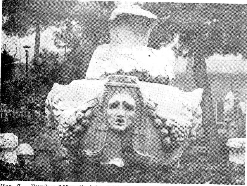
Res. 7— Burdur Müzesi'ndeki 1321 Env. No.lu Sunaklı Osthotek.