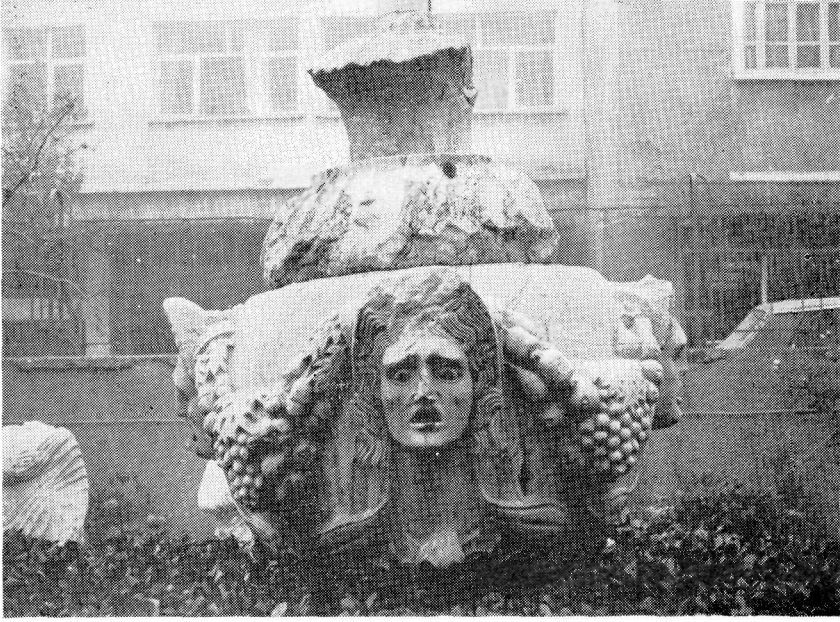
Res. 5— Burdur Müzesi'ndeki 1321 Env. No.lu Sunaklı Osthoteke.