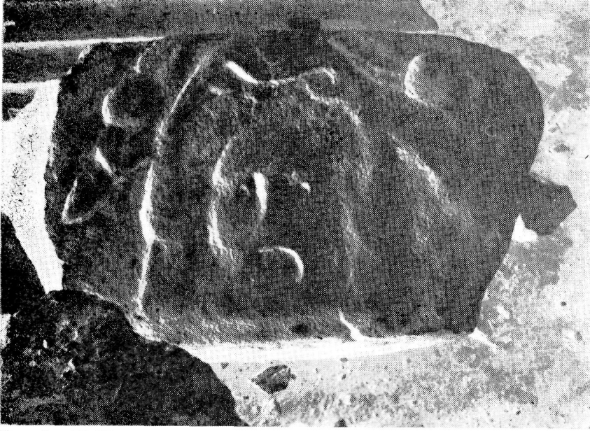
Res. 3— Halikarnassos Tiyatrosu. Sahne kısmına ait olan friz parçası.