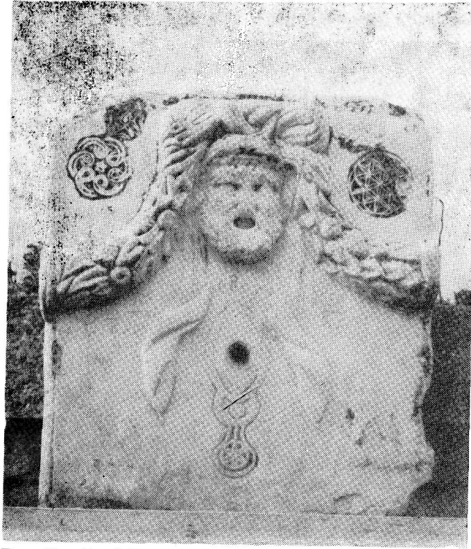
Res. 12— Denizli Müzesi'ndeki Taş Levha.