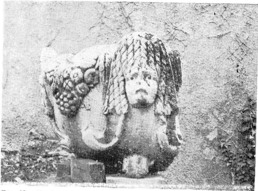
Res. 10— Burdur Müzesi'ndeki 1153 Env. No.lu Osthotek.