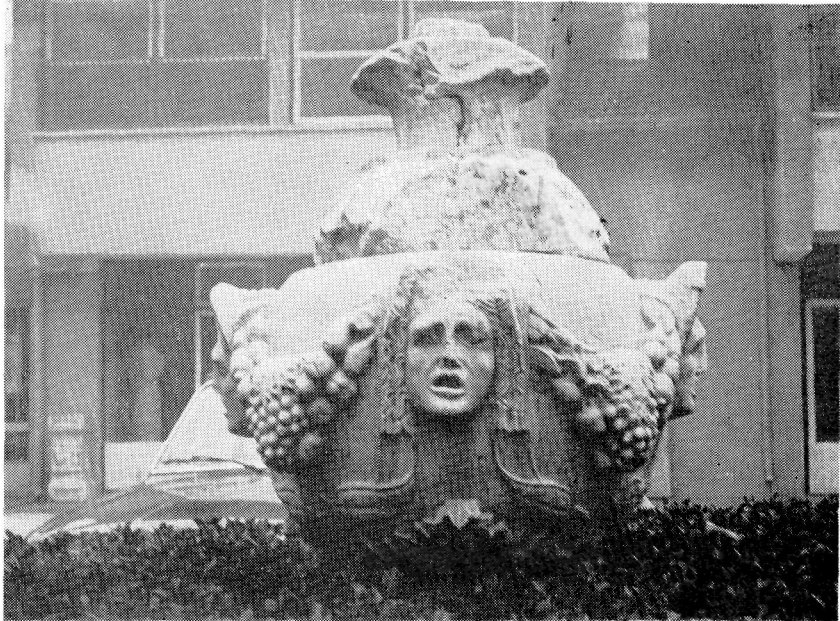
Res. 6— Burdur Müzesi'ndeki 1321 Env. No.lu Sunaklı Osthoteke.