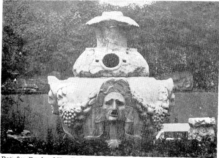
Res. 8— Burdur Müzesi'ndeki 1321 Env. No.lu Sunaklı Osthotek.