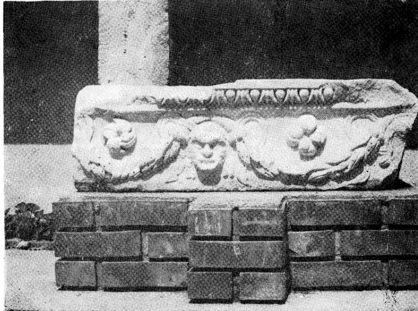
Res. 2— Bergama Müzesi'ndeki 2714 Env. No.lu friz parçası.