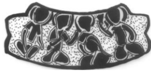
Şek. 4. T.İ.E.M. 109 nolu şamdan. Omuz bölümündeki 2. sahne çizimi.

4. Soldan sağa doğru, bir, iki ve dördüncüsü bağdaş kurarak oturan ve ellerinde kadeh tutan figürler. Üçüncü figür tek dizi üzerine oturmakta ve def çalmaktadır.