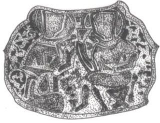
Şek. 6. T.İ.E.M. 114 nolu şamdan. Omuz bölümündeki 2. sahne çizimi.