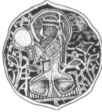
Şek. 15. Bursa 637 nolu şamdan. Gövde bölümündeki 4. sahne cizimi.

4. Yerde serili bir örtü ya da minder üzerinde sağa dönük şekilde oturarak def çalan kadın figürü. Figürün iki yanında bitkiler bulunmaktadır (Şek. 15).