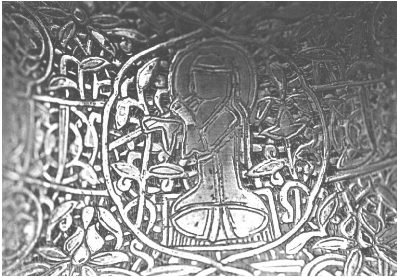
Res. 14. Bursa 637 nolu şamdan. Gövde bölümündeki 3. sahne.