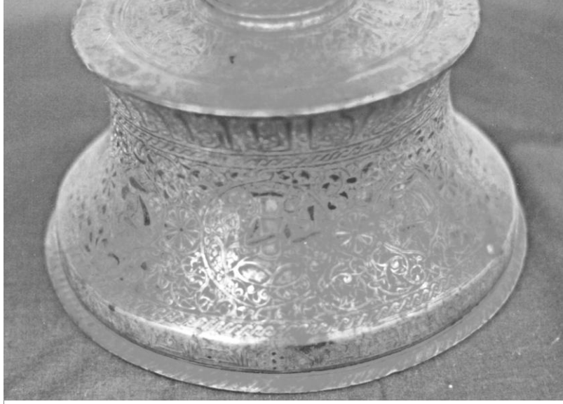
Res. 7. Konya 389 nolu şamdan. Gövde bölümündeki taht sahnesi.