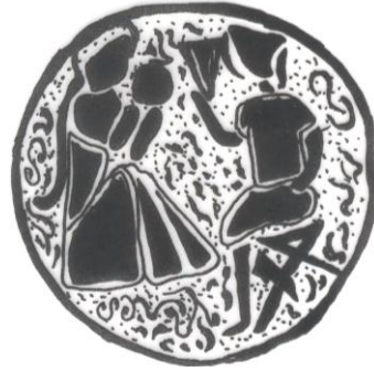
Şek. 12. T.İ.E.M. 109 nolu şamdan. Gövde bölümündeki 2. sahne çizimi.

3. Bir seki üzerinde karşılıklı oturan iki figür. Soldaki beline kadar inen baş örtüsü ve omzundaki pelerini ile bir kadın figürü. Bağdaş kurarak oturan ve sağ elinde kadeh tutan kadın sol elini yerdeki tepsiye uzatmış durumdadır. Karşısında bağdaş kurarak oturan ve sol elinde kadeh tutan sağ elini ağzına götüren figürü. İki figür arasında asılı kandile benzeyen bir obje bulunmaktadır (Res. 1, Şek. 13).