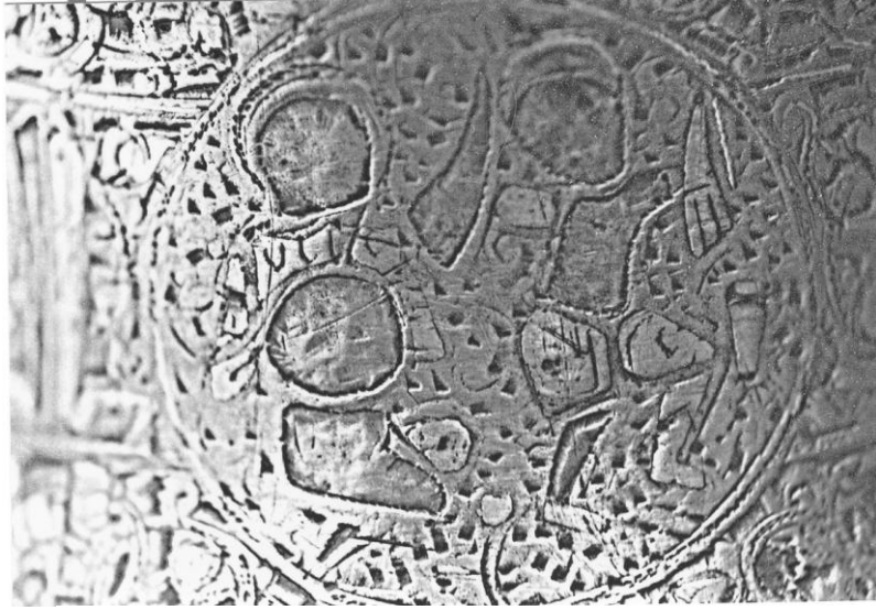
Res. 12. Bursa 636 nolu şamdan. Gövde bölümündeki 4. sahne.