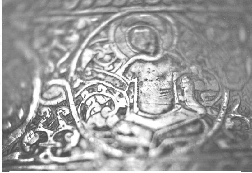
Res. 9. T.İ.E.M. 108 nolu şamdan. Gövde bölümündeki 1. sahne.