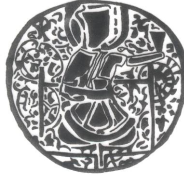
Şek. 14. T.İ.E.M. 114 nolu şamdan. Gövde bölümündeki 2. sahne çizimi.