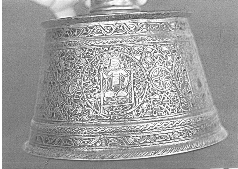
Res. 6. Konya 388 nolu şamdan. Gövde bölümündeki taht sahnesi.