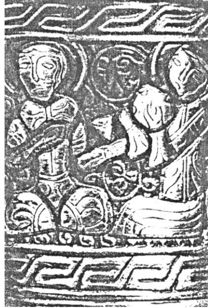
Res. 4. VAM.M.711-1910 nolu şamdan. Boyun bölümündeki 1. sahne.