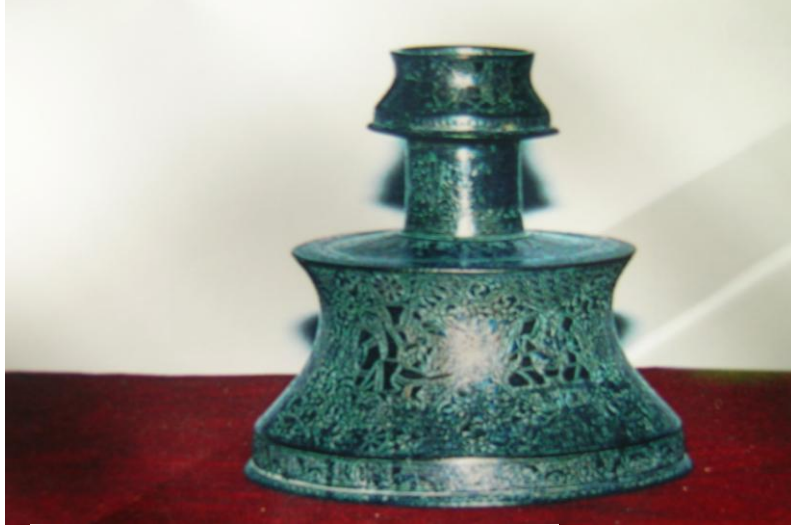
Res. 1. T.İ.E.M. 109 nolu şamdan.