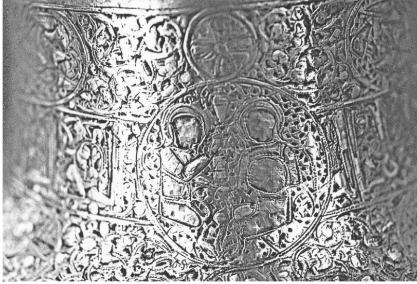
Res. 11. Bursa 636 nolu şamdan. Gövde bölümündeki 2. sahne.