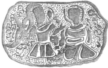
Şek. 3. T.İ.E.M. 114 nolu şamdan. Mumluk bölümündeki 3. sahne çizimi.