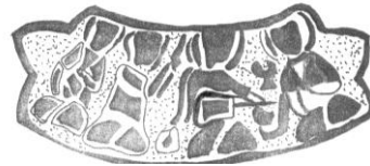
Şek. 5. T.İ.E.M. 109 nolu şamdan. Omuz bölümündeki 3. sahne çizimi.