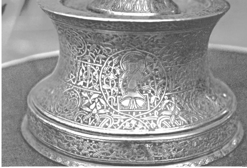
Res. 13. Bursa 637 nolu şamdan. Gövde bölümündeki 1. sahne.