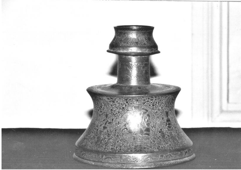
Şek. 2. T.İ.E.M. 114 nolu şamdan. Mumluk bölümündeki 2. sahne çizimi.