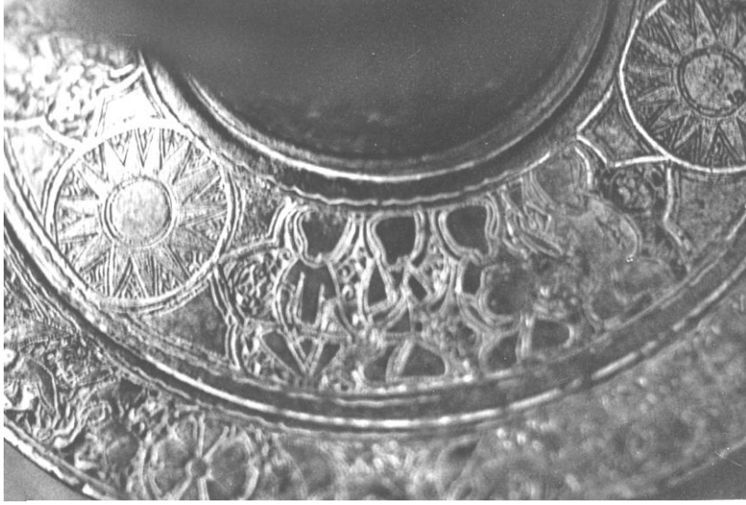
Res. 5. T.İ.E.M. 109 nolu şamdan. Omuz bölümündeki 2. sahne.