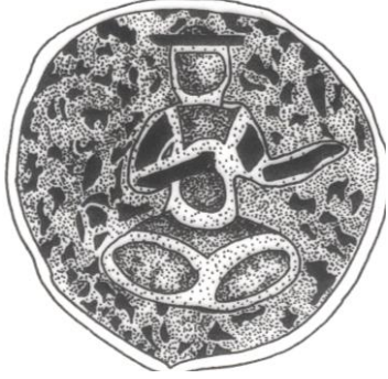
Şek. 9. Konya 389 nolu şamdan. Gövde bölümündeki 1. sahne çizimi.

kurarak oturan, sol ellerinde kadeh tutarken 19 , sağ elleri diz üzerinde duran figürler yer almaktadır.