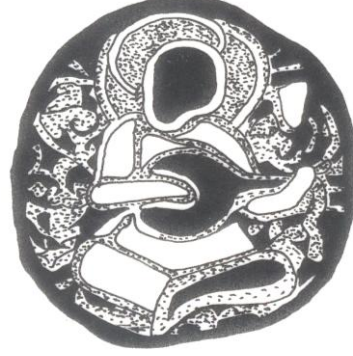
Şek. 10. T.İ.E.M. 108 nolu şamdan. Gövde bölümündeki 3. sahne çizimi.