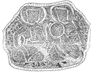
Şek. 8. T.İ.E.M. 114 nolu şamdan. Omuz bölümündeki 4. sahne çizimi.