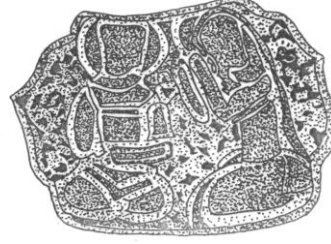
Şek. 7. T.İ.E.M. 114 nolu şamdan. Omuz bölümündeki 3. sahne çizimi.