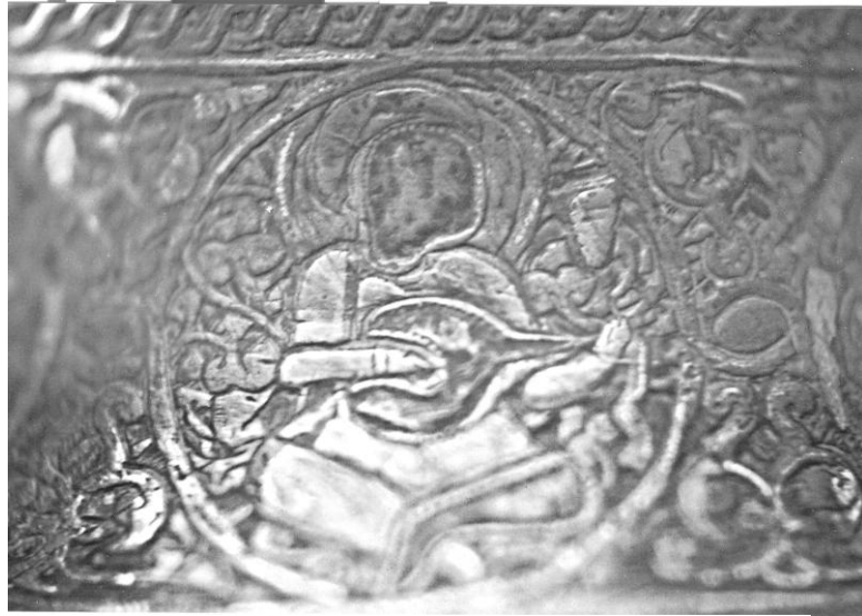
Res. 10. T.İ.E.M. 108 nolu şamdan. Gövde bölümündeki 3. sahne.