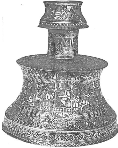
Res. 3. Es-Said 8 nolu şamdan.