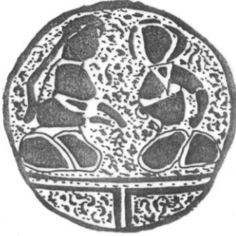
Şek. 11. T. İ.E.M. 109 nolu şamdan. Gövde bölümündeki 1. sahne çizimi.

2. Soldaki dizleri üzerine oturan ve def çalan kadın figürü. Baş örtüsü beline kadar inmektedir. Karşısında çapraz ayaklı bir tabure üzerinde oturan ve sağ elinde kadeh tutan figür (Şek. 12).