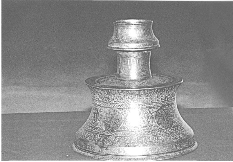
Res. 8. T.İ.E.M. 108 nolu şamdan.