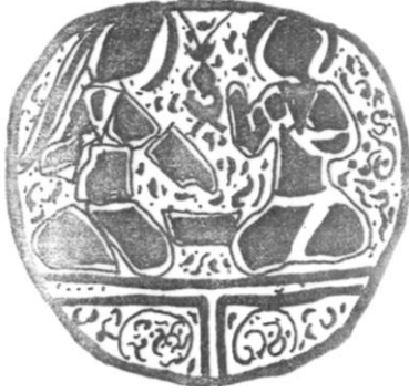
Şek. 13. T.İ.E.M. 109 nolu şamdan. Gövde bölümündeki 3. sahne çizimi