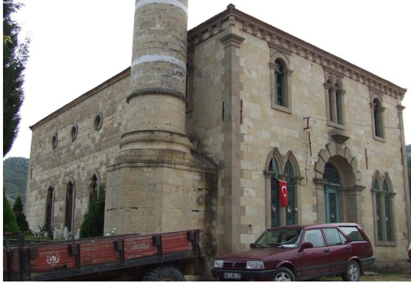
Res.1- Yeşilyurt Köyü Camii