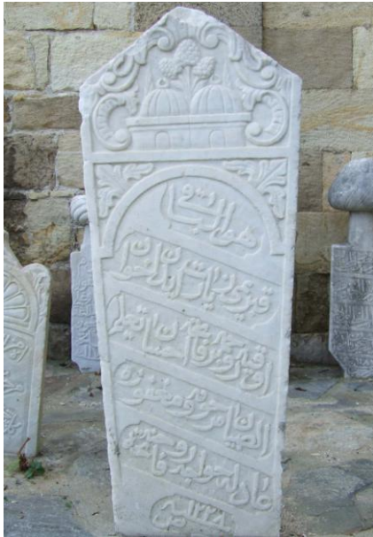
Res.9-Âdile Hoca'nın Mezar Taşı