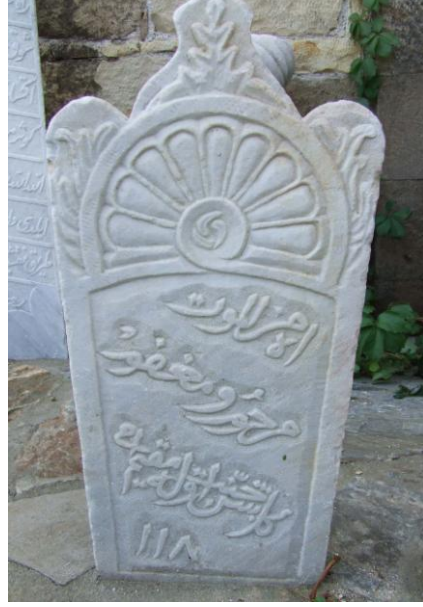
Res.4- (İsimsiz) Mezar Taşı