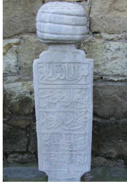
Res.16- Eyüb Ođlu Süleyman'ın Mezar Taşı