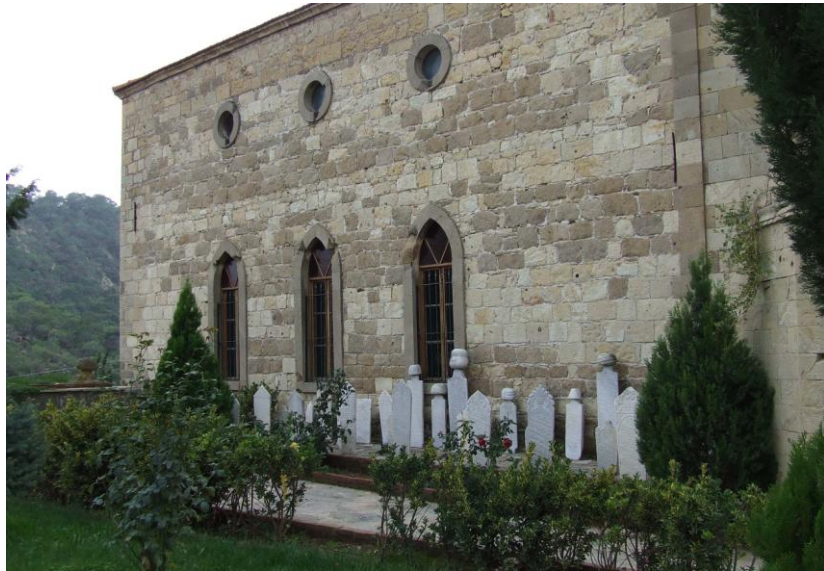
Res.2- Yeşilyurt Köyü Camii Haziresi