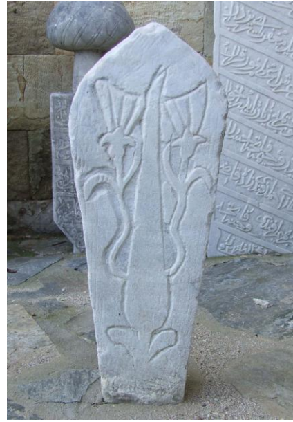
Res.20- Ayakucu Şâhidesi