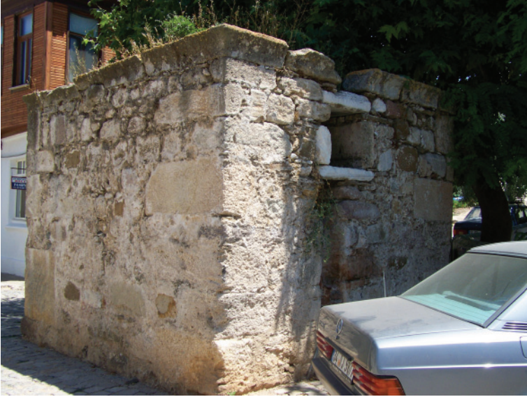
Res.4- Namazgah Meydanı Çeşmesi (kuzey ve batı cepheler)