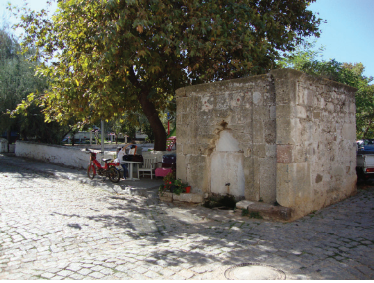
Res.3- Namazgah Meydanı ve çeşme