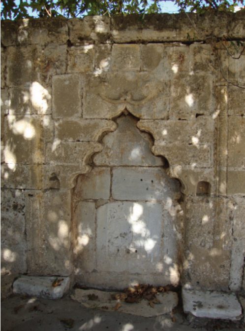
Res.8- Güney cephe