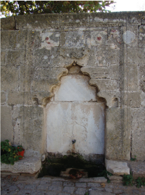
Res.6- Doğu cephe