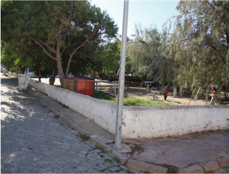
Res.2- Namazgâh Meydanı bugünkü durumu