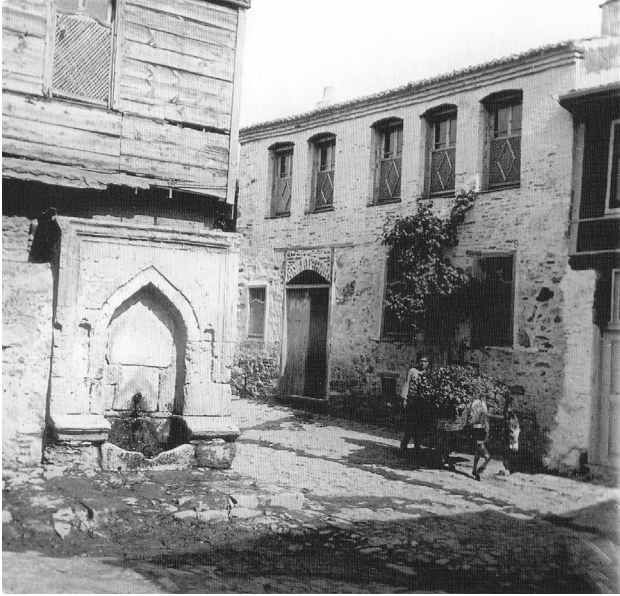
Res.10- Günümüze ulaşmayan çeşme (H.Gürüney, Bozcaada Fotoğrafları, s.40)