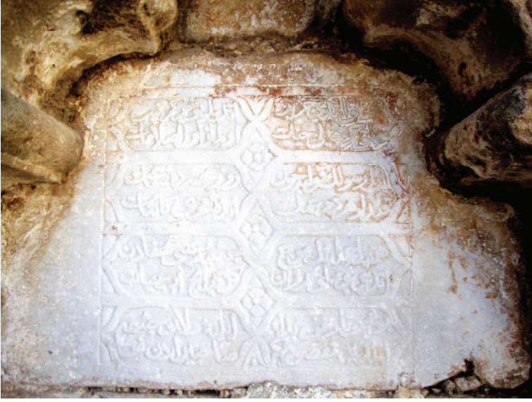
Res.7- Doğu cephedeki kitabe