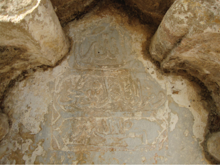
Res.9- Güney cephedeki kitabe