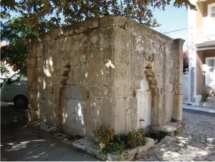
Res.5- Çeşmenin güney ve doğu cepheleri