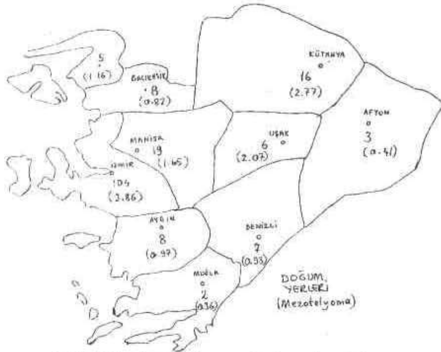
Şekil 1. Olguların doğum yerlerine göre dağılımı.