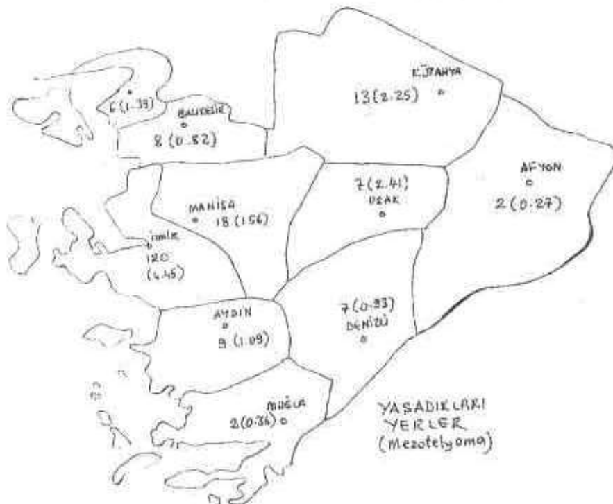
Şekil 2. Olguların yaşadıkları yerlere göre dağılımı.