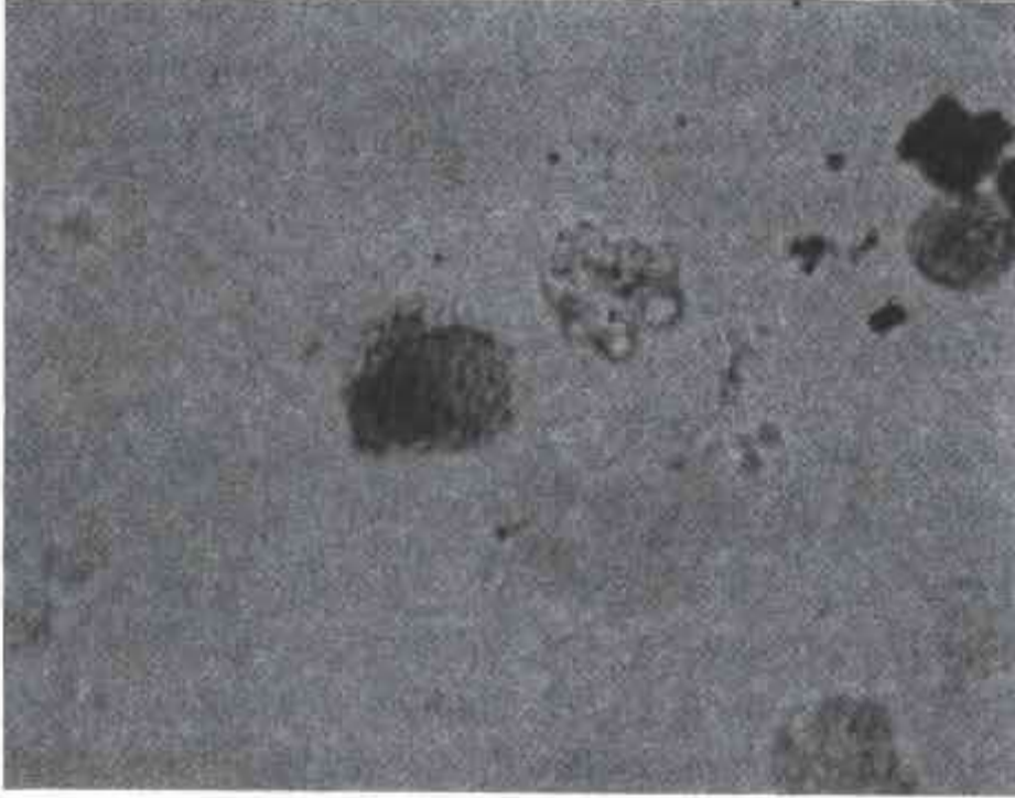
Resim 2. HLA-DR ile pozitif boyanan hücreler (x400).