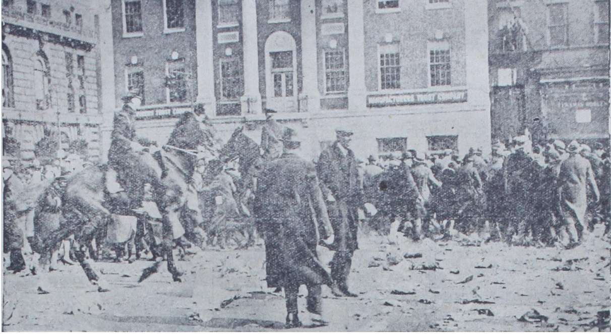
Kaynak: Akşam Gazetesi, 1 Nisan 1930, s. 6.

İşsizlik sorunu Amerikan ekonomisi ve toplumu üzerinde büyük yaralar açmıştır. Billhassa, Avrupa ülkelerinden farklı olarak, Amerika'da işsiz kalan işçilere yardımda bulunacak bir devlet teşkilatı ve herhangi bir tahsisat olmadığı iddiasından hareketle işsizler açlıktan ölme tehlikesi ile karşı karşıya kalmıştır. Bu sıkıntıdan ötürü, işsiz ameleler ve çiftçiler bazı bölgelerde yağma faaliyetlerine teşebbüs etmişlerdir. Örneğin, New Jersey'de binlerce çiftçi şehre hücum etmiş ve şehri yağma etme tehdidiyle yüklü miktarda erzak toplamışlardır. Yine, Oklahoma'da yaklaşık 800 erkek ve kadın dükkanları yağma tehdidinde bulunmuş ve bunlardan bazıları polis tarafından tevkif edilmiştir. New York'ta ise gösteriler kanlı sonuçlanmış ve birçok kişi yaralanmıştır. Tüm bu hadiseler göstermiş ki aç kalan amele ve çiftçiler toplumsal düzeni bozacak vahim vakalara teşebbüs etmekten geri durmayacaklarından, Amerika idaresi işsizlere verilmek üzere iane tahsisatına karar vermiştir (28 Ocak 1931, s. 7).