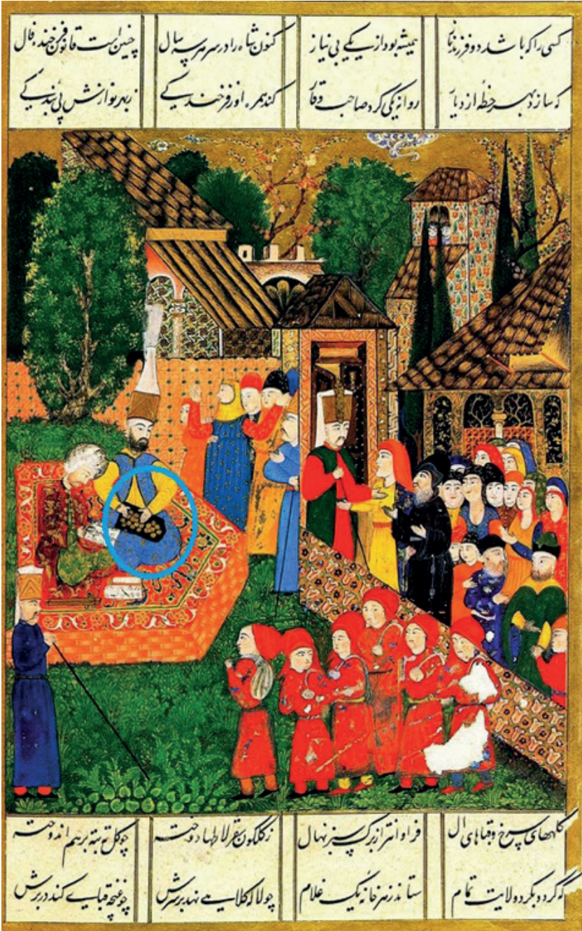
Resim 1: Devşirme eminini yeni devşirilen acemi oğlanlarına memleketlerinden payitahta gönderilecekleri sırada harcırah olarak verilen parayı akçe tahtasında sayarken resmeden minyatür. Ârifî, Süleymanname , TSMK, Ms Hazine, nr. 1517, vr. 31/b.