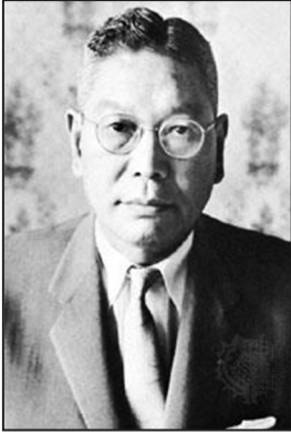
Ikeda Hayato (yaygınağ)

ten az bir süre öncesinde Hint başbakanı Cevahirlal Nehru [1889-1964], inme geçirmiş ama göreve devam etmiştir. Aylar boyu, meclisin sıralarına tutunarak idare-i maslahat edebilmiştir. 35