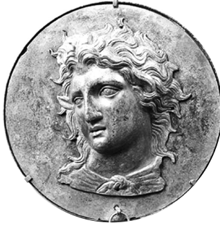
Büyük İskender kabartmalı bir madalyon (yaygınağ)

Antik Çağ'da Makedonyalı Büyük İskender'in, doğuştan boyun eğriliği ( tor-tikolis, wry neck ) diye bilinen kas bozukluğundan muzdarip bulunduğu anlaşılmaktadır. Asya'da İndüs vâdisine kadar 11 senelik bir sefer düzenleyen bu acar komutan, fiilen kılıç sallayan bir cengâverdir ve belli ki fiziksel arâzını kendisine maddî veya manevî anlamda hiç dert etmemiştir. 10 (Sonunda sırf kendi ordusunun ısrarı uğruna dönüşe geçen İskender, Babil'de 33 yaşında ateşli hastalıktan hayatını kaybetmiştir (M.Ö. 323).