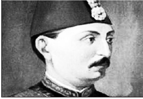
Üç Aylık Sultan, V. Murad (yaygınağ)

Sultan İbrahim'in öfke krizleri gösterdiği, müzmin baş ağrısı çektiği doğrudur. Libido (şehvanilik) bileyişlerini, soyun devamı için annesi Kösem Sul-