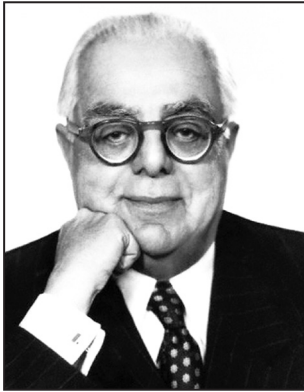
Üçüncü Ağa Han (1877-1957) (yaygınağ)

1916-1919 yılları arasında ağır bir hastalık, [Haşhaşinler'in devamı sayılan Şia'nın Nizari İsmailî kolu önderi] Üçüncü Ağa Han'ı, ortalıkta gözükmekten men etmiştir. Sonunda iyileşmiş, ancak göz yuvarları fazlaca dış bükey kalmıştır. Ağa Han'ın bir başka sorunu aşırı kilodur. 1936 yılında müridleri