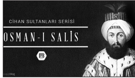
Sultan III. Osman (yaygınâğ)

Duraklama ve gerileme devrinden itibaren akli malûliyet ya da en azından akıl zayıflığı sergilemiş gibi görünen sultanlar mevzuu, zamanın ve şartların içinde kıymetlendirilmesi gereken bir husustur. Bu noktada bir tarihsel romanda şu satırları okuyoruz ki gerçekçi bir muhakeme yansıtmaktadır: “Aynı düşlerle [tahta oturmak] bekleyen ağabeylerinin delirdiğini gören herhangi biri, zaten delirmek-delirmemek açmazına sıkışacağı için delirmek zorundaydı. Çünkü dedelerinden III. Mehmet'in, padişah olur olmaz, aralarında meme çocukları da bulunan on dokuz kardeşini tarihte okuyan (ve devletin tarihini de bilmek zorunda olan) şehzâde, delirmeye mahkûmdu.” 51 (Günümüz psikiyatri bilminde deli yoktur akıl hastası vardır; ancak tarihsel bağlam içinde anılan sözcüğün kullanımında beis yoktur). {Hanedanın kanı kutsal sayılıp dökülmesi men edildiğinden, teknik yöntem olarak ibrişim kementle boğulmala-