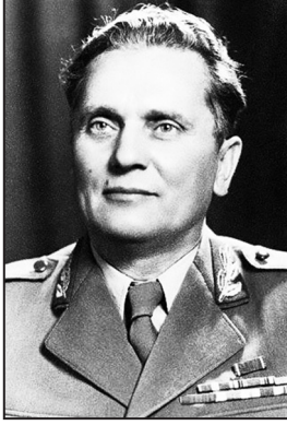
Josip Broz Tito (1892-1980) Genç ve sıhhatli yıllarında (yaygınağ)

devletten farklı olarak ciddiyet içinde harekete geçmesi, Türkiye açısından takdir-i şâyan bir tutumdur}.