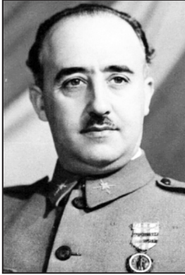
Francisco Franco (1892-1975) Orta yaşa doğru ve nispeten sıhhatli iken (yaygınağ)

İspanya diktatörü General Franco'nun 31 1963'den beri şeker ve Parkinsonizm problemi yaşamakta olduğu söylentisi çıkmıştır. 1961 senesinde uzunca bir inziva dönemi ardından halka yeniden gözükteğünde; pek de anlamlı olmayan bir yüz ifadesiyle ve ağız hafifçe açık vaziyette etrafına bakınmıştır. 32 Mısır'ın eski devlet başkanlarından Cemâl Abdül Nâsır'ın [1918-1970] diabet olduğuna dair imâlar hep ortalıkta vardı. Bir aralık Sovyet Rusya'ya giderek bacak damarlarına da çâre aramıştır. 1960 senesinde bir grup Amerikalı psikiyatrist ve psikolog, Sovyet lideri Nikita Kruşçev hakkında [tabii ki uzaktan uzağa] stabil hipomani tanısı koymuşlardır. 33 {Mani, dalgalı y=\sin(x) fonksiyonu grafiğini andıran} bipolar bozukluk (manik-depresif cinniye) hâlinin çökkünlük evresinden sonra gelen ve sürekli tekrarlanan coşkunculuk evresidir. Van Gogh, Paul Gauguin, Fikret Muallâ örneklerindeki gibi birçok sanatçı bu hâlet-i ruhiye içinde yaşadılar. Çökkünlük zaman dilimlerinde âdetâ veri toplama ve gözlem yapıp, müteakip mania püskürmelerinde eserler (tablo, beste, roman vs.) vücuda getirdiler. Stabil hipomani, bu anlamdaki maninin, kararlı (bunalım ile pek alternatif gitmeyen) amma daha hafif bir versiyonu hükmündedir. 34