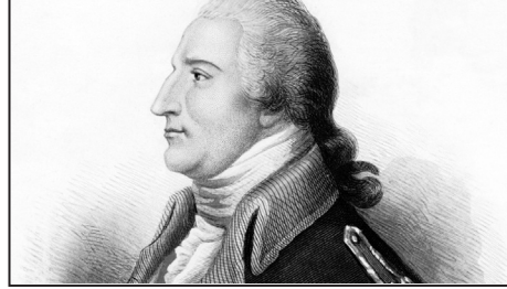
Taraf Değiştiren General Benedict Arnold (1741-1801)

Aynı bacağından iki defa yara alıyor. Kendi eliyle düşman askerlerini bertaraf ediyor! Tehlikeden haz duyarak âdetâ delilik sınırlarında heyecan ataklarına ulaşıyor. Ancak kişiliği geçimsiz ve politikacılarla hiç arası yok. Bu itibarla etkin görevden alınıp Philadelphia askerî vâilliğine tayin olunduktan sonra, generale olanlar oluyor. Soylu, genç ve pahalı zevkler sahibi ikinci eşinin de teşvikleriyle general, marazî bir küskünlüğe bürünüyor. Kendisinin asıl kıymetini eski düşmanları olan İngilizler'in takdir edeceği hezeyanlarına (sabuklama) kapılıyor. Böylece taraf değiştiriyor! Adı haine çıkıyor. Örgütsel, konjonktürel ve kişisel gerilimler birleşerek onu; endişeli, bunalımlı, kararsız ve lüzumsuz tehlikeye meyyal bir ruh hâli içersine çekiyor. Hıyanetin pençesine veriyor. 17