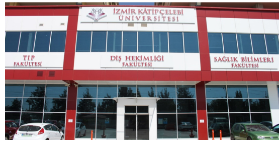
Fotoğraf 3. Aydınlikevler Yerleşkesi

Üniversitemizde Hemşirelik eğitimi 4 yıl ve 4600 saat teorik ve uygulama eğitimini kapsayacak şekilde planlanmıştır ve ulusal çapta en yaygın uygulanan yöntem olan klasik eğitim modeli ile yürütülmektedir. Hemşirelik eğitim müfredatı Hemşirelik Ulusal Çekirdek Eğitim Programı'na (2014) uyumlu olarak temel tıp bilimleri, uygulamalı mesleki dersler, bölüm seçmeli dersleri, üniversite seçmeli havuz dersleri, ortak zorunlu YÖK dersleri, yabancı dil derslerinden oluşan sağlık, hemşirelik, tıp, kişisel gelişim, toplumsal sorumluluk vb. alanlarda toplam 75 dersten oluşmaktadır (5,6). Eğitim programının son yılında klinik uygulamalar intörn hemşirelik uygulaması şeklinde yürütülmektedir. Klinik uygulamalarda bölümümüz tarafından rehber hemşirelik eğitimi alan ve resmi olarak görevlendirilen rehber hemşirelerden ve lisansüstü hemşirelik öğrencilerinden destek alınmaktadır.