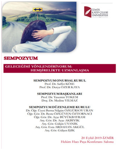
Şekil 4. Hemşirelik Bölümü Kariyer Etkinlik Afşisi