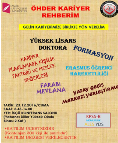
Şekil 3. Sağlık Bilimleri Fakültesi ve Öğrenci Hemşireler Derneği Kariyer Rehberi Etkinlik Afşisi