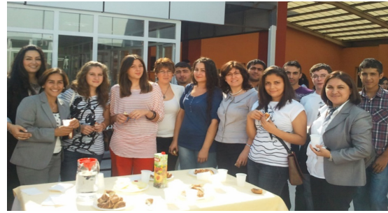
Fotoğraf 2. Hemşirelik Bölümü 2011-2012 Eğitim Öğretim Yılı "İlk Ders Sonrası Öğrencilerle Tanışma" Etkinliği

Üniversitemizde Hemşirelik eğitimi 4 yıl ve 4600 saat teorik ve uygulama eğitimini kapsayacak şekilde planlanmıştır ve ulusal çapta en yaygın uygulanan yöntem olan klasik eğitim modeli ile yürütülmektedir. Hemşirelik eğitim müfredatı Hemşirelik Ulusal Çekirdek Eğitim Programı'na (2014) uyumlu olarak temel tıp bilimleri, uygulamalı mesleki dersler, bölüm seçmeli dersleri, üniversite seçmeli havuz dersleri, ortak zorunlu YÖK dersleri, yabancı dil derslerinden oluşan sağlık, hemşirelik, tıp, kişisel gelişim, toplumsal sorumluluk vb. alanlarda toplam 75 dersten oluşmaktadır (5,6). Eğitim programının son yılında klinik uygulamalar intörn hemşirelik uygulaması şeklinde yürütülmektedir. Klinik uygulamalarda bölümümüz tarafından rehber hemşirelik eğitimi alan ve resmi olarak görevlendirilen rehber hemşirelerden ve lisansüstü hemşirelik öğrencilerinden destek alınmaktadır.