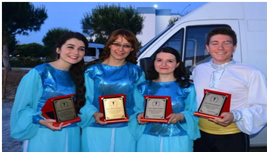
Fotoğraf 5. Halk Dansları Topluluğu

Kurulduğu günden bu yana bölümde seçmeli ders olarak yer alan Toplumsal Duyarlılık dersi; aynı isimle Üniversite havuzu seçmeli dersler grubuna da açılmış, Tıp, Diş Hekimliği, Mühendislik, Sosyal ve Beşeri Bilimler Fakültesi gibi diğer programlardaki öğrencilerin de dersi almasına imkân sağlanmıştır. Bu ders kapsamında özellikle dezavantajlı gruplar olan çocuklar, kadınlar, yaşlılar, engelliler başta olmak üzere bugüne kadar toplam 101 proje gerçekleştirilmiştir.