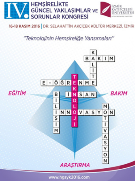
Şekil 2. Hemşirelik Bölümü Ev Sahipliğinde Düzenlenen İlk Ulusal Kongre Afışı