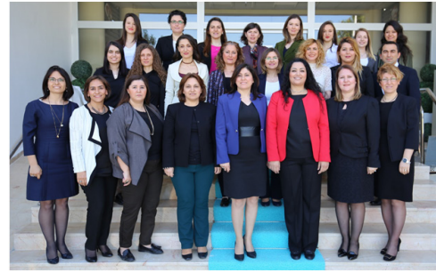
Fotoğraf 8. Kuruluşunun 6.Yılında İzmir Kâtip Çelebi Üniversitesi Hemşirelik Bölümü Akademik Kadrosu