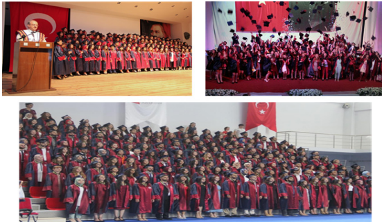
Fotoğraf 7. Hemşirelik Bölümü Mezuniyet Törenlerinden Kareler (Sırasıyla; 2015, 2016 ve 2019 Yılı Mezunları)