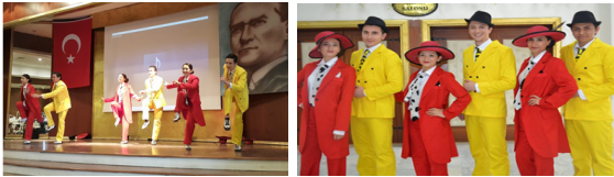
Fotoğraf 4. Modern Dans Topluluğu Gösterisi

Kurulduğu günden bu yana bölümde seçmeli ders olarak yer alan Toplumsal Duyarlılık dersi; aynı isimle Üniversite havuzu seçmeli dersler grubuna da açılmış, Tıp, Diş Hekimliği, Mühendislik, Sosyal ve Beşeri Bilimler Fakültesi gibi diğer programlardaki öğrencilerin de dersi almasına imkân sağlanmıştır. Bu ders kapsamında özellikle dezavantajlı gruplar olan çocuklar, kadınlar, yaşlılar, engelliler başta olmak üzere bugüne kadar toplam 101 proje gerçekleştirilmiştir.