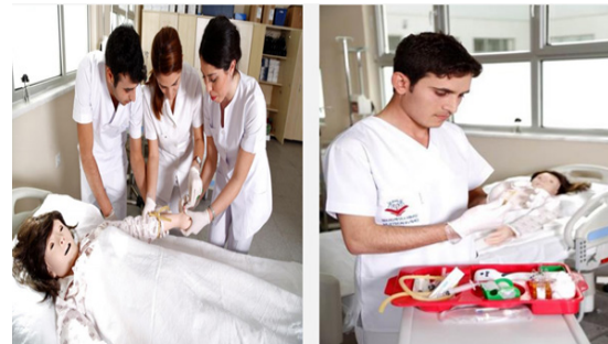
Fotoğraf 6. Hemşirelik Bölümü Laboratuvar Uygulamaları

Şu anda Türkiye’nin farklı illerinde görev yapmakta olan ilk mezunlarımız, mezuniyetlerinin beşinci yılı olması sebebiyle “5.Yılda, 5 Çayında” sloganı ile mezun buluşması için 9 Mayıs 2020 tarihinde biretkinlik planlamış, bu etkinlikte aynı zamanda İKÇÜ Hemşirelik Mezunları Derneği’ni kurmak için girişimlerde bulunmayı da hedeflemişlerdir. Fakat; bu hazırlıklarına küresel çapta yaşanan pandemi nedeniyle ara vermek zorunda kalmışlardır.