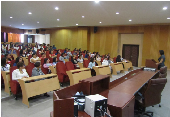
Fotoğraf 1. Hemşirelik Bölümü 2011-2012 Eğitim Öğretim Yılında "İlk Ders"