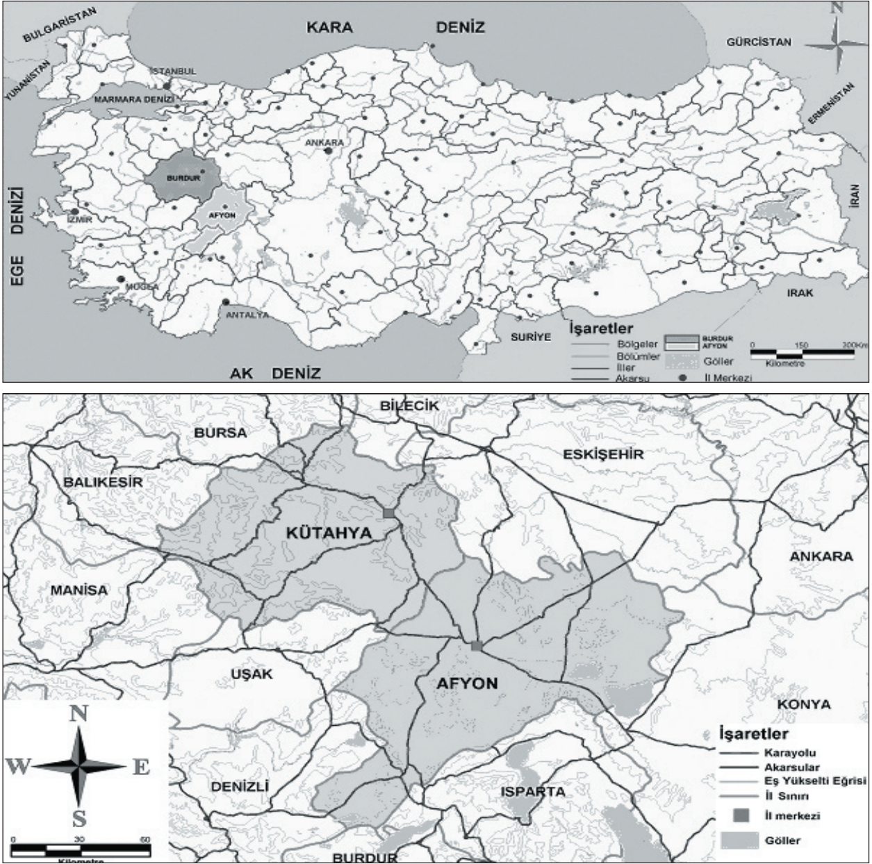
Şekil 1. Afyon ve Kütahya illeri lokasyon haritası

ğumdan dolayı yaşamam. Onun intihar etmesinden kısa bir süre sonra (15 dakika) ise Çiğiltepe ele geçirilir” (Talipoğlu 1998: 35).