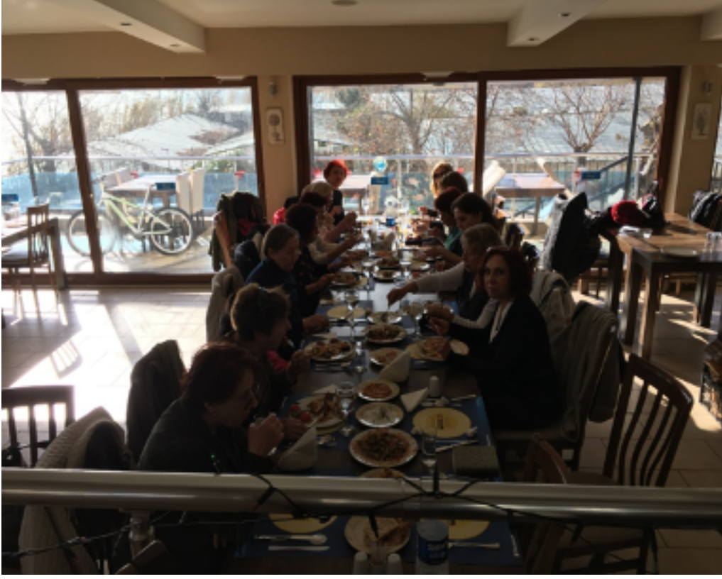
3. Emeklilik sonrası. Kabul günü. 07.01.2017