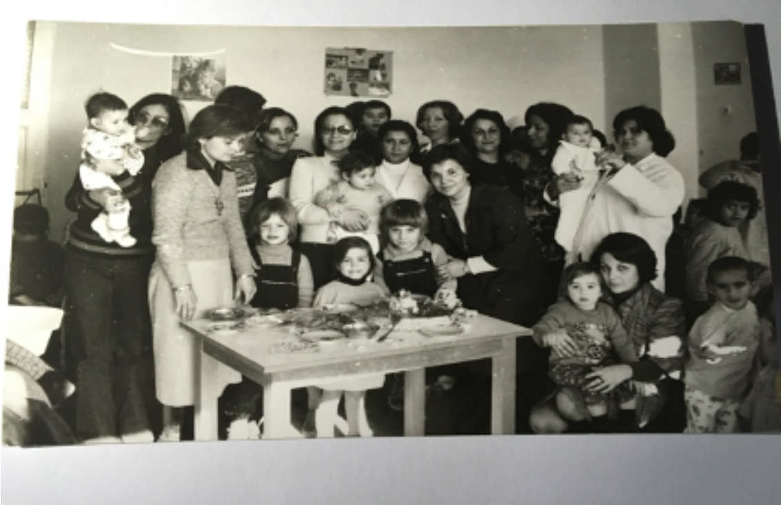
2.İstihdam Dönemi Günleri