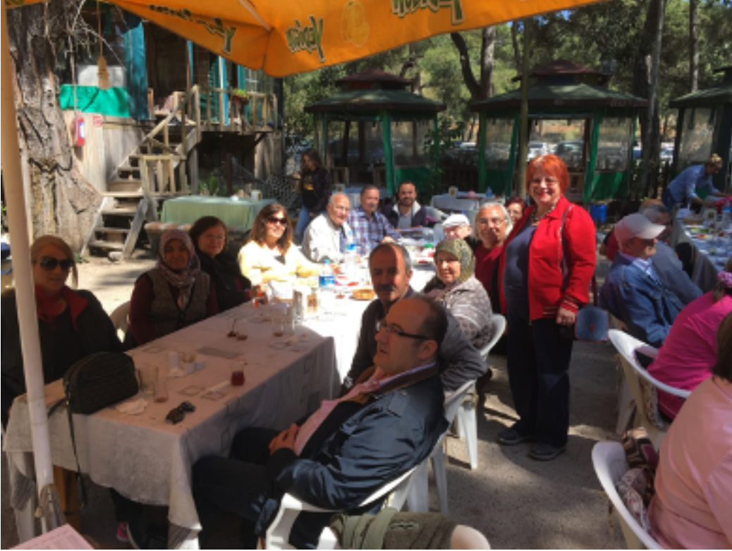
4. Kahvaltı Etkinliği, 27.03.2017