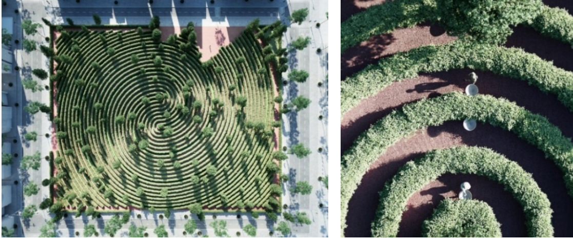
Resim 2. Parc De La Distance