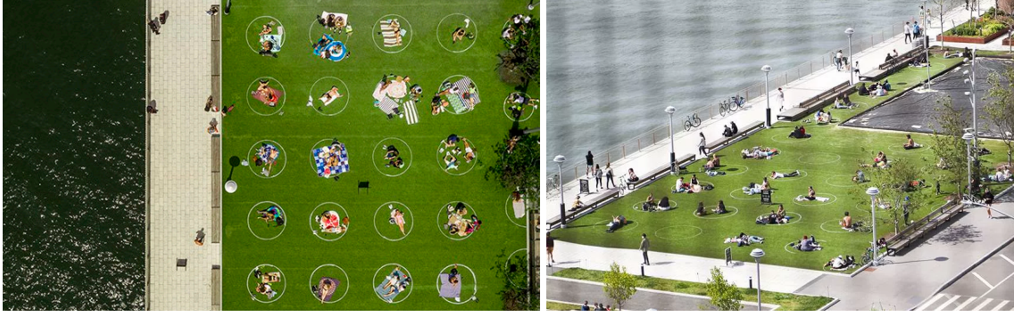
Resim 3. Brooklyn Domino Parkı