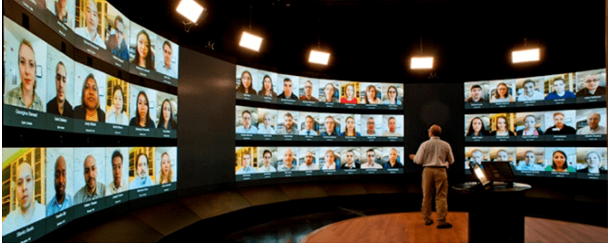
Resim 5. Harvard Üniversitesi sanal sınıf

Harvard Business School, dijital bir ortamda etkileşimli olarak bilginin aktarılmasına yardımcı bir sanal sınıf örneği sunmaktadır. Yüksek çözünürlüklü video duvarı, amfi tiyatro şeklinde oturma düzeni sunarak 60'a yakın katılımcının aynı anda ekranlarda görüntülenmektedir. Kullanılan kameralar aracılığıyla katılımcıların gerçek bir sınıfta olması hissini yaratmak için hem öğretim üyesini hem de diğer katılımcıları görmesi sağlanmaktadır. Dünyanın her yerinden katılımcıların aynı anda oturum açabileceği bu platform tasarımı etkileşimli bir ortam sunmaktadır. Harvard üniversitesi sunduğu çevrimiçi platformlarla dünyanın herhangi bir yerinden eğitimin alınabileceğini, bilgiye erişimin sınırsız olduğunu göstermektedir (Hbx, 2015). Salgın süresince ise uzaktan öğretmek, öğrenmek, araştırma yapmak ve sosyalleşmek kullanılmaktadır. Bu süreçte sanal ortamların aktif bir şekilde kullanılmasıyla birlikte birçok üniversite kütüphanesi erişim sınırını ortadan kaldırmış, tüm kaynaklara dijital ortamda erişim sağlanmıştır.