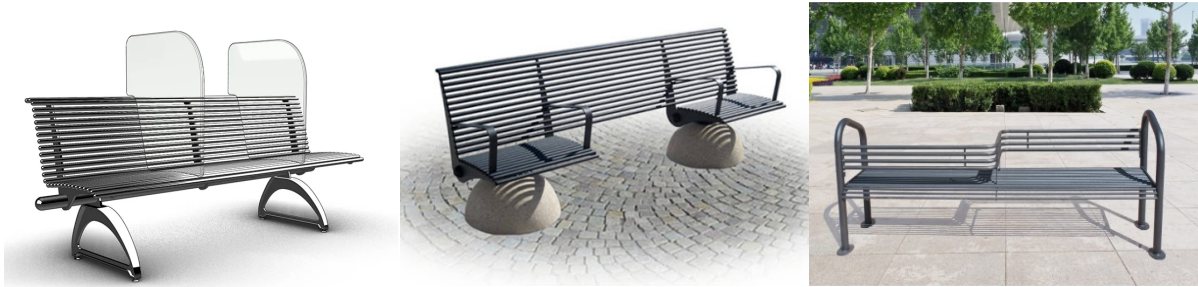
Resim 4. Kentsel mobilya tasarımları örnekleri

Kamusal alanlarda tekrar güvende ve bir arada olmak için yeni yollar denenmeye başlanmıştır. Bireyin salgın süresince sağlıklı bir şekilde kamusal alandan yararlanması için çeşitli yollar ortaya konularak, gerekli sosyal mesafe şartına uyulması koşuluyla açık havada güneşlenebilecekleri ve zaman geçirebilecekleri bir alan sunulmaktadır. Ancak daireler arasında sosyal mesafe kuralları uygulanırken, daire içindeki insanların arasındaki mesafe göz ardı edilmektedir. Salgının başlangıcından bu yana üretilmiş kapsamlı çalışmalar bulunmamaktadır. Kişisel mesafe kuralları göz önünde bulundurulmaya çalışılmakta fakat daha farklı çözümler geliştirilememektedir. Geliştirilen öneriler de pratik olarak gündelik hayata yansıyan en hızlı çözümlerdir. Kamusal alan tasarımlarında ilk akla gelen çözüm önerileriyle değişiklikler yapılmaya başlanmıştır. Salgın süreci hala devam etmekte, sonuçları ve etkisi mevcut durumda ölçülemediği için kesin bir çözüm önerisi geliştirilememektedir. Toplumsal uzaklaşma uzun süreli bir gerçeklikse, bu durumun yapıyı çevreye entegre edilmesinin farklı şekillerde olması gerekmektedir.