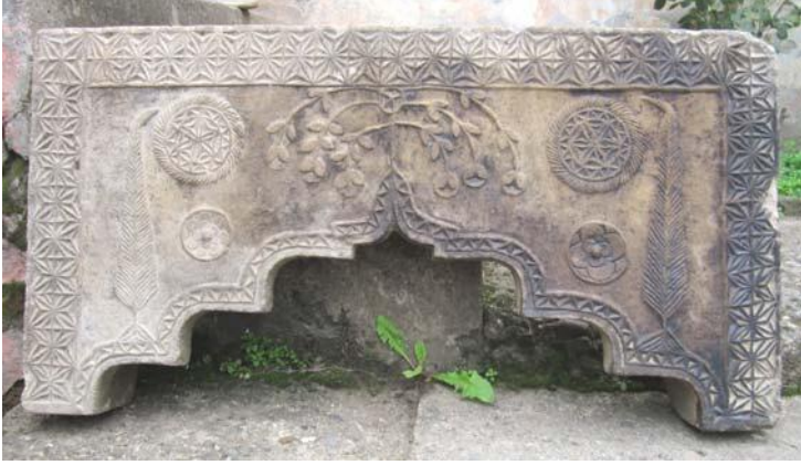
Fotoğraf –6. Bir Rûm ustanın süslemesini yaptığı mermer şömine alınlığı.