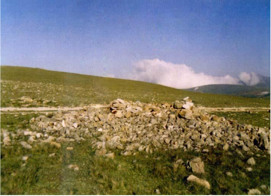
Fotoğraf.5. Sultan Murat horoşu (taş yığımı) ya da On binlerin dönüşündeki yığın.

Murat Han ile III. ve IV. Murat birçok olayda karıştırılmıştır. III. ve IV. Murat adlı padişahlar hiçbir zaman Trabzon'a gelmediler. Ancak, aşağıdaki fotoğrafta görülen taş yığımına yanlış olarak "Sultan Murat Horoşu (yığımı)" denilir.