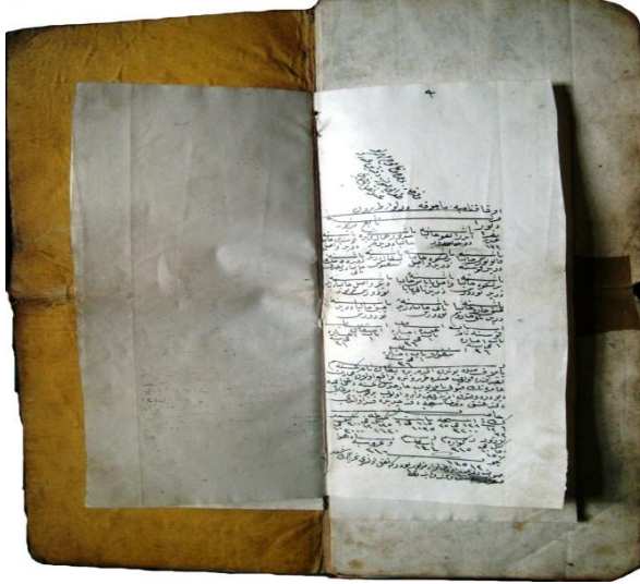
Belge- 1 - DİVERA (YAZLIK KÖYÜ)Vergi Defteri. 1236/1820-21. II. Mahmud dönemi. (Üst yazı)