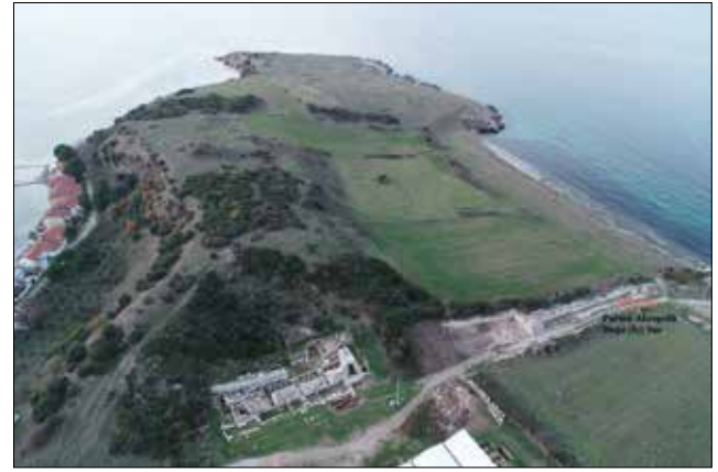
Fotoğraf 1: Parion Akropolü ve Doğu İç Sur / Parion Parion Acropolis Eastern (Inner) Wall

Parion akropolünün doğusunu çevreleyen, bir iç sur olarak da adlandırabileceğimiz savunma yapısında, bilimsel arkeolojik kazılara, 2017 yılında başlanmıştır. Kısa süreli gerçekleştirilen çalışmalarda, sur duvarlarının doğu cephesinin küçük bir bölümü kazılmıştır (Keleş vd. 2019: 607 ). 2018 yılı çalışmalarında ise; kuzey-güney yönlü uzanan surun doğu cephesinin, 31.15 m.'lik uzunluğundaki bir bölümü daha kazılarak iki yıllık çalışmalar sonucunda, toplamda sur duvarının 40.95 m.'lik bölümünün doğu cephesi açığa çıkarılmıştır. 2019 yılında Parion kazısının bir yıl boyunca desteklenen arkeolojik kazılardan biri olmasıyla, Parion Akropolü Doğu (İç) Surlarında çalışmalar yoğunlaşmış ve yaklaşık 98,90 m'lik bölümü daha ortaya çıkarılmıştır (Foto. 1-2).