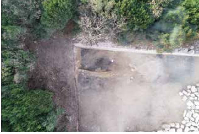
Fotoğraf 3: Doğu (İç) Sur Yangın Tabakası / Eastern (Inner) Wall Fire Layer

tabakasını oluşturan kül ile karışık dolgu içerisinde, lokal olarak kireç ve harç kalıntılarına da rastlanmıştır. Seviye inme çalışmaları sırasında yangın tabakası içerisinde mimari kalıntılar ve sikkeler dışında; Roma ve Erken Bizans Dönemlerine tarihlenen seramik, pişmiş toprak figürin, kiremit ve cam parçaları, metal cürufklar, bir adet bronz yüzük, çok sayıda metal çivi parçaları, üç adet kemik obje, hayvan kemiği parçaları, istiridye kabukları da ele geçmiştir. Yangın tabakası içerisinde tespit edilen söz konusu tüm eserler oldukça yoğun ateşe maruz kaldıklarından dolayı üzerleri tamamıyla yangın izleri ile kaplı olarak ele geçişlerdir.