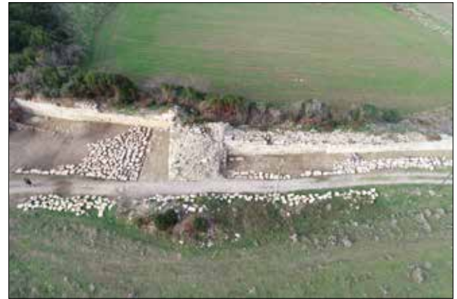
Fotoğraf 2: Doğu (İç) Sur / Eastern (Inner) Wall .

Çalışma konumuzu oluşturan sikkeler ise, 2019 yılı çalışmaları sırasında 6850-5700 ve 6850-5705 plan karelerine giren alanlarda gerçekleştirilen kazı çalışmaları sırasında, ortalama 0.80 m. derinliğindeki bir yangın tabakası içerisinde bulunmuştur 4 (Foto. 3). Yangın