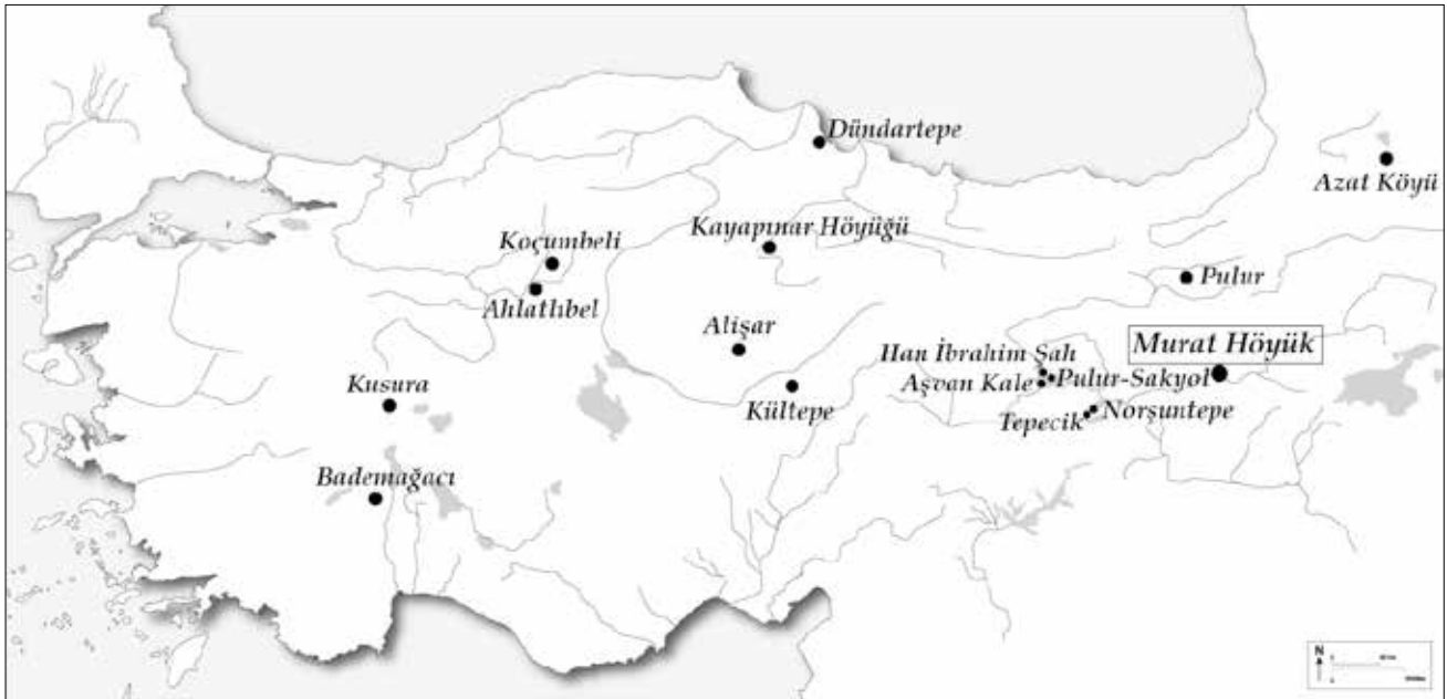
Şekil 1: Anadolu'da Çeç Damga Mühür Bulunan Yerleşimler / Settlements with Stamp Seals (Çeç) found in Anatolian

Murat Höyük'te 2019 yılında gerçekleştirilen sistemli arkeolojik kazılar sonucunda I. Tabaka: Orta Çağ, II. Tabaka: Orta Demir Çağı, III. Tabaka: İlk Demir Çağı ve IV. Tabaka: İlk Tunç Çağı olmak üzere dört kültür tabakası tespit edilmiştir (Tablo 1). Höyüğün ilk defa İlk Tunç Çağı'nda iskân gördüğü anlaşılmıştır.