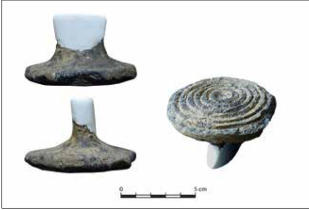
Fotoğraf 3: Murat Höyük IV, İlk Tunç Çağı III'e tarihlenen Çeç Damga Mühürü / The Stamp Seal (Çeç) dated to Early Bronze Age III at Murat Höyük IV.