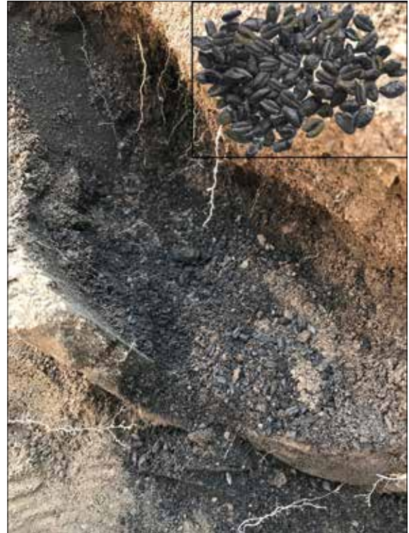
Fotoğraf 2: Murat Höyük IV, Mekân 4 içerisinde in situ çömlek ve içindeki karbonize tohum tanelerini / The in situ pottery found with the carbonized seed grains in space 4 at Murat Höyük.