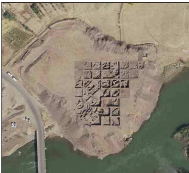
Fotoğraf 1: Murat Nehri kenarında yer alan Murat Höyük kazısının havadan görünümü / Aerial view of the Murat Höyük excavation located near the Murat River.

En erken yerleşim İlk Tunç Çağı'na tarihlenir. Murat Höyük IV kültür katı, Doğu Anadolu kronolojisine göre İlk Tunç Çağı III'te, MÖ 2500-2200 tarih aralığında yerleşime sahne olmuştur. Yerleşimin genelinin büyük bir yangınla son bulduğu ve höyüğün yaklaşık MÖ 2200 yılında terk edildiği tespit edilmiştir.