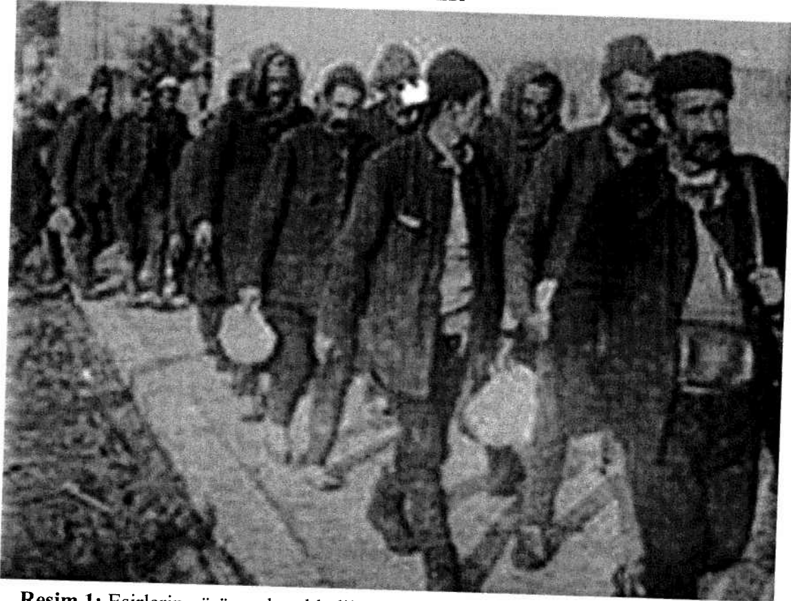
Resim 1: Esirlerin yürüyerek nakledilmeleri