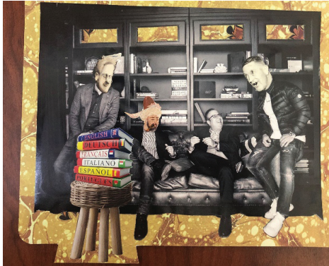
G. 11: Deneyisel Kolaj Çalışması, 21,0 x 29,7 cm (A. Osman Elmas, 2020)

G.10. temel kolaj mantığının basit bir şekilde ele alındığı bir çalışmadır. Yüzün formu ve boyutu açıkça hissedildiğinden zeminde bu görüntüyü vurgulamak açısından beyaz yerine Kraft kâğıdı kullanılmıştır. Soldan sağa doğru koyudan açığa dengeli bir ton geçişi bulunmaktadır. Mor sarı ve turuncu renk sıcak soğuk dengesi sağlarken kontrast oluşturmuş, aynı zamanda görsele vuran ışık etkisini güçlendirmiştir. Ten dokusu detaylı bir şekilde izlenmektedir. Noktasal ve çizgisel değerlerin kullanılmadığı bu görselde renk ve hacim ön plandadır. Çalışmanın en üst ve orta kısmında yer alan figür ters yöne duruşuyla denge unsuru oluşturmuştur. Çalışma yönü soldan sağa doğru izlenmektedir.