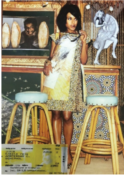
G. 2: Deneysel Kolaj alıřması, 21,0 x 29,7 cm (Nurdan K. řenol, 2020)