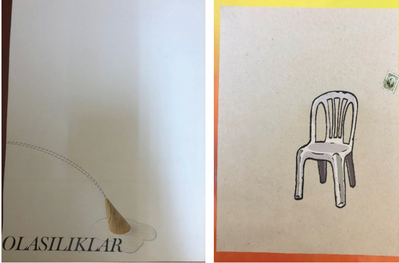
G. 4 ve G. 5: Deneysel Kolaj Çalışmaları 21,0 x 29,7 cm (A. Osman Elmas, 2020)

ile yeni grafiksel görüntüler oluşturulmuştur. Bir araya getirilen parçalar fotoğrafın dışında yeni bir anlatım formu oluşturarak absürt birleştirmeler ve kes-yapıştır ürünler ortaya çıkmaya başlamıştır. Bu da kolaj tekniğine görsel ve sanatsal açıdan birçok yenilik getirmiştir. G. 3 'teki gibi hazır nesne olarak kullanılan fotoğraf kâğıdı üzerine, biçim olarak birbirini tamamlayan fakat büyük küçük uyumu ile de düzensiz bir yerleştirme yapılmıştır. Sepya ve kahverengi tonlar uyum içerisinde kullanılmıştır. Renk dengesi kolaj üzerine sonradan eklenen yapışkanlı not kağıtlarıyla sağlanmaya çalışılmıştır. Bir araya getirilmiş alakasız görseller karmaşa yaratmaktadır. Çalışma yönü eserdeki bakış yönü de olan sağ tarafa doğrudur. Boyut hissi pek oluşmasa da tek göze batan, çalışmanın sol üst kısmındaki uyuyan çocuk görselidir. Sanki kadrajdan sarkmışçasına bir izlenim vermektedir. Noktasal görünüm, hareket de katması için yine bu figürle yerleştirilmiştir. Bu görselde izleyiciye doğrudan bir karmaşa sunulmuştur.