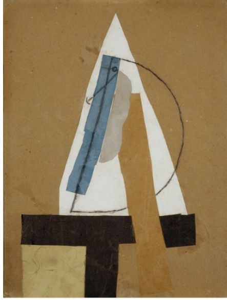
G. 1: Pablo Picasso, Tête (Head) , Scottish National Gallery of Modern Art, 1913

Kehnemuyi, kolaj tekniğinin gerekliliğini şu şekilde belirtmiştir: