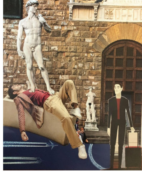
G. 8 ve G. 9: Deneysel Kolaj Çalışmaları, 21,0 x 29,7 cm (Nurdan K. Şenol, 2020)