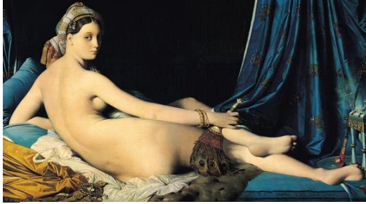
GörSEL 9: Ingres, Büyük Odalık, 1814, Tuval üzeri yağlıboya, Wikipedia. Erişim: 19.01.2021 https://bit.ly/2ZelNjd

Yeniden ifade biçimleri çoğu zaman kapitalist üretim biçiminin bir parçasını barındırırken çoğu zaman da provakatif bir şekilde ele alınmıştır. Bir grup Amerikalı Kadın Sanatçı'nın 1985'te bir araya gelerek oluşturduğu bağımsız bir feminist sanatçı insiyatifi olan Gerilla Kızlar (Guerrilla Girls) sanat kurumlarındaki cinsiyet ayrımını protesto eden bir dizi eser üretmişlerdir.