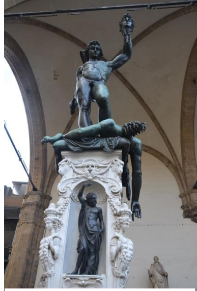
Görse 15: Benvenuto Cellini, Medusa Başı ile Perseus / Perseus with the Head of Medusa, 1545-1554