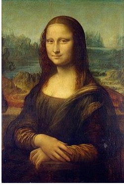
Görsel 7: Leonardo da Vinci, 1503, Mona Lisa.

Yanı sıra, bu özlem imgelerinde kendisiyle eski arasında -oysa eski burada, daha dün geçerli olan demektir- bir karşıtlık yaratma yolunda kararlı bir çaba görülür (Benjamin, 2006, s.33).