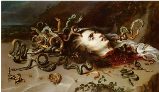
Görsel 3 : Peter Paul Rubens, Medusa Başı, Yaklaşık 1617-1618, Sanat Tarihi Müzesi.