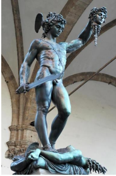
Görse 13: Benvenuto Cellini, Medusa Başı ile Perseus / Perseus with the Head of Medusa , 1545-1554, Floransa