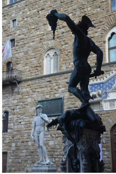
Görse 14: Benvenuto Cellini, Medusa Başı ile Perseus / Perseus with the Head of Medusa, 1545-1554