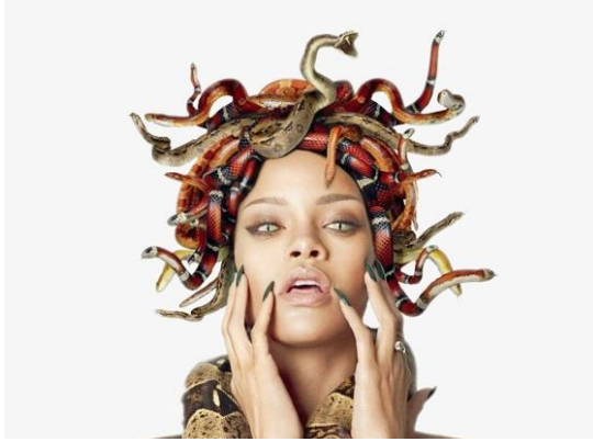
Görsel 5: Rihanna, Go Dergisi Kapak Çekimi, 2013. Erişim: 17.01.2021. https://bit.ly/3ddNqdW