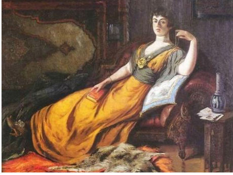
Görsel 11: Halife Abdülmecid Efendi, Haremde Goethe, 1917.