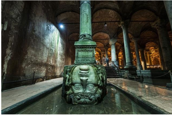
Görsel 1: Yerebatan Sarnıcı Ters Konumlandırılmış Medusa Başı.

Medusa miti yüzyıllar boyunca onlarca alanda kullanılmış, birçok eserin de öznesi olmuştur. Mimaride ise Medusa'nın bulunduğu yeri koruduğuna inanıldığı için önemli tapınaklara ve saraylara Medusa başı yerleştirilmiştir. Bu yüzden Yerebatan Sarnıcı'nda yer alan üç konumlu Medusa başı "Bizans'ta kılıç kabzalarına işlenmiş ve sütun kaidelerine (bakanların taş kesilmemesi için) ters olarak yerleştirilmiştir. Bir rivayete göre de Medusa'nın aynaya bakıp kendisini taşa çevirdiğine inanıldığı için, buradaki heykeli yapan heykeltıraş ışığın yansıma açılarına göre Medusa'yı üç ayrı konumda yapmıştır" (kültür. İstanbul, 2020) (Görsel 1,2).