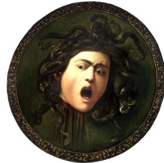
Görsel 4 : Caravaggio, Medusa-Murtola, 1596, Özel Koleksiyon.

Mitolojik hikayelerde dahi güzelliğinden kaynaklı suçlanan ve cezalandırılan kadın, sanat alanında da 1960'lara kadar sadece resim, heykel vb. içerisinde figür olarak yer almıştır. Bu duruma artık sessiz kalamayan kadın sanatçılar, 1960'ların sonlarında hareketlenmeye başlayan siyasal aktivizm ve feminist hareketin artması ile Kadın Sanatçılar Devrimde ( Women Artists in