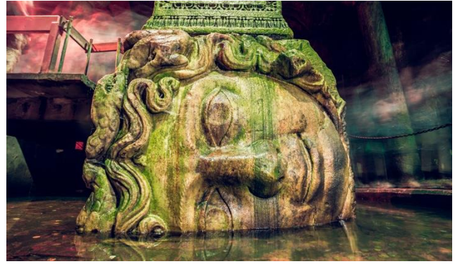
Görsel 2: Yerebatan Sarnıcı Yatay Konumlandırılmış Medusa Başı.