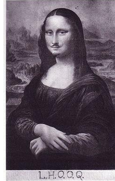
Görsel 8: Marchel Duchamp, 1919, L.H.O.O.Q.