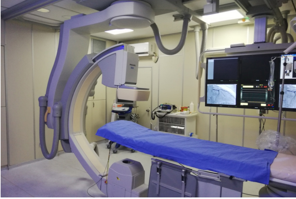
Şekil-5: Philips Allura XPER FD10 girişimsel anjiyo cihazı