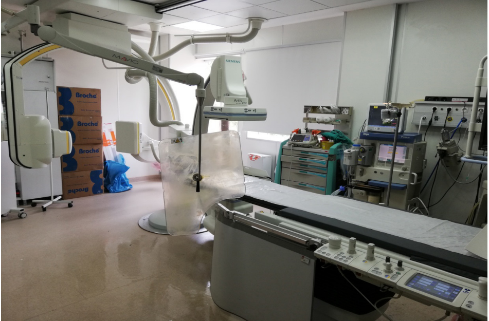
Şekil-4: Siemens Artis Zee girişimsel anjiyo cihazı

lens dozimetresi verilerek anjiyo işlemi boyunca göz çevresinde(Şekil-3) bulundurmaları sağlanmıştır. Dozimetreler; bir periyot (1 ay) süre sonunda toplanmıştır. İlgili periyottaki doğal radyasyon düzeyi (background) için 1 adet TLD dozimetresi de söz konusu alana yerleştirilmiştir. Tüm ölçümlerden doğal radyasyon dozu çıkarılarak kullanıcılara ait net dozlar bildirilmiştir. Her bir anjiyo işlemi süresince aktif skopi ( X-ışının yayımlandığı süreç ) işlem süresi kaydedilmiştir. Bu işlem süreleri kullanılarak, operatör bazlı maruz kalınan toplam aktif skopi çalışma süreleri hesaplanmış ve kayıtları tutulmuştur. Bir aylık periyot sonunda her bir TLD kullanıcısı için toplam aktif skopi süresi belirlenmiştir. Her bir periyot bitiminde Hp(3) dozimetreler kullanıcılardan alınarak, 1 adet kontrol TLD dozimetresi ile birlikte RADKOR Dozimetre Laboratuvarına (Ankara, Türkiye) gönderilerek okutulmuştur. Bu veriler ışığında toplam maruz kalınan radyasyon dozları mSv cinsinden belirlenmiştir. Bununla birlikte her kullanıcıya ait olan toplam aktif skopi çalışma süreleri de saniye cinsinden belirlenerek, doz hızları \mu\text{Sv}/\text{sn} olarak normalize edilmiştir. Bu bilgiler ışığında yıl bazlı olarak güvenli çalışma limitleri öngörülme istenmiştir.