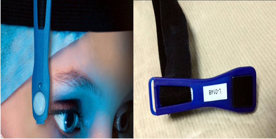
Şekil-3: Hp(3) Lens Dozimetre

TLD'ler, ihtiyaç duyulan alanlar bazında farklılıklar gösterebilirler. Örneğin iyonize radyasyon ile çalışan personeller, ağırlıkça Hp(10) yahut Hp(0.07) veya her ikisini birlikte kullanmaktadırlar. Yapılan bu çalışmada, birden çok klinikte gerçekleştirilen kalp anjiyografilerinde Hp(3) lens dozimetreler kullanılarak göz lensi dozları hesaplanacaktır. Kullanılacak olan dozimetreler gerek baş bölgesine yardımcı bir donanım ile takılabilirken gerekse de direkt olarak koruyucu kurşun gözlük üzerine de montajı yapılabilmektedirler. Ayrıca göz lensine mümkün olan en yakın bölgede yer aldığından (Şekil-3) ilgili organın aldığı radyasyon dozunu diğer dozimetrelere nispeten daha iyi ölçümleyebilmektedir.