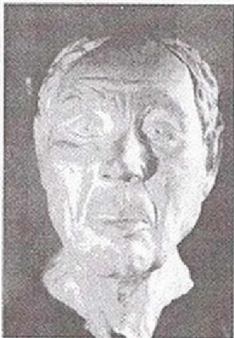
Resim 3: Kral Midas'ın Kafatasının Rekonstrüksiyondan Sonraki Görünümü