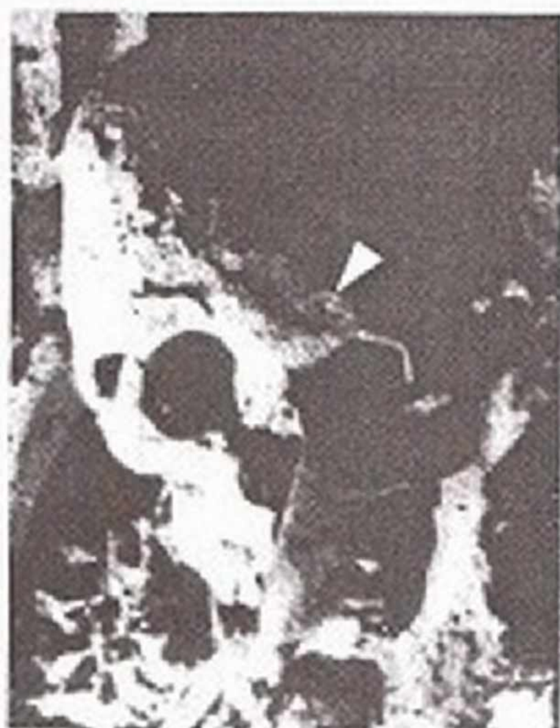
Resim 7: Sol Orbite Üzerinde Yer Alan In-situ İzin Boyutlandırılmış Görünümü