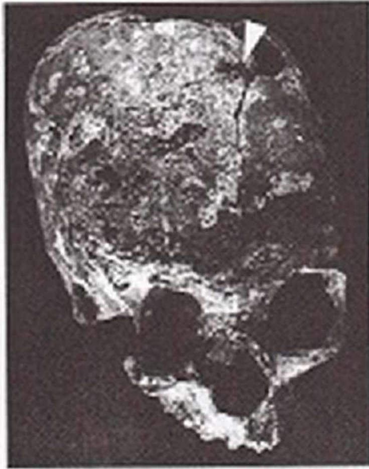
Resim 6: Kafatası Üzerinde Yer Alan İz