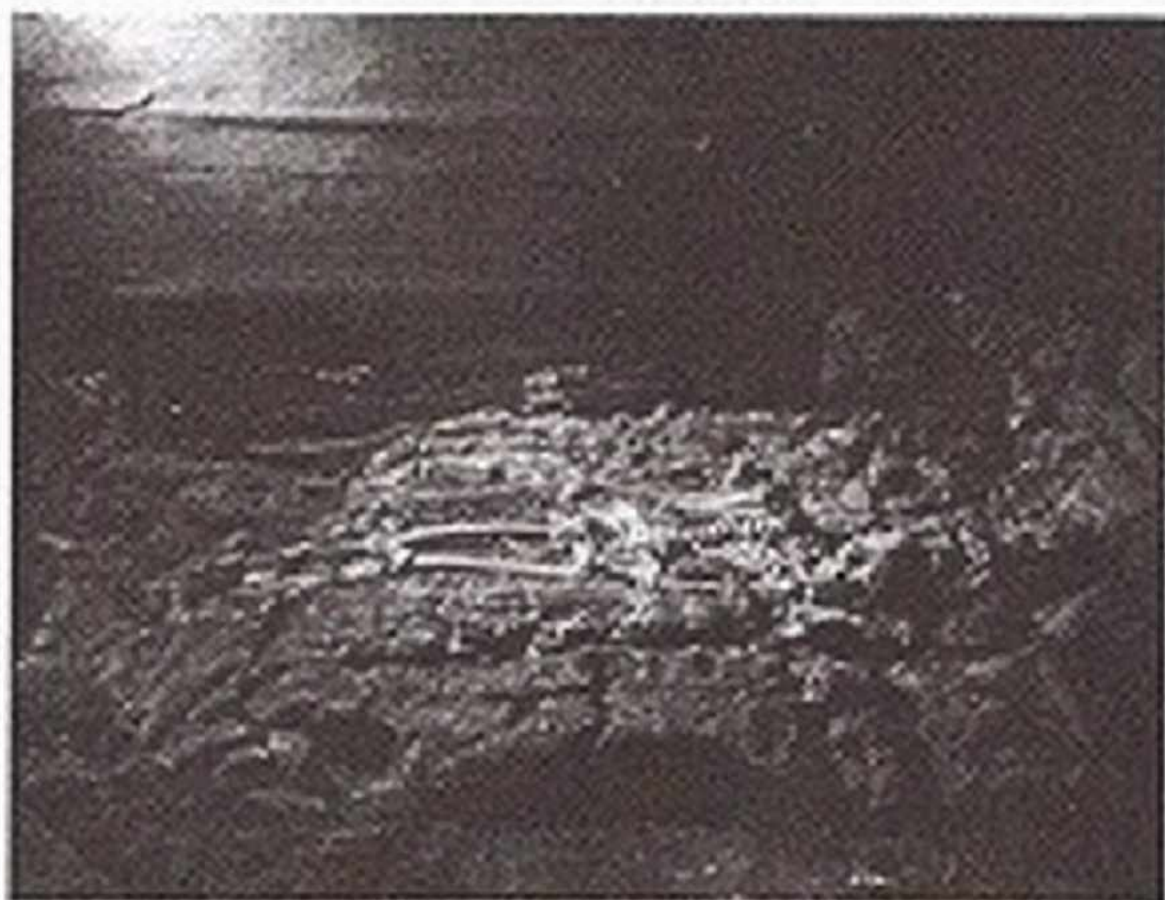
Resim 4: Kral Midas'ın İskeletinin In-situ Görünümü