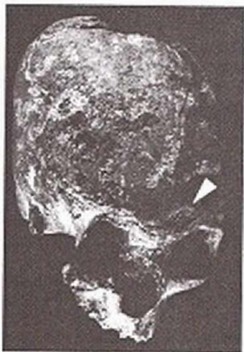
Resim 8: Sol Orbite Üzerinde yer Alan İzi