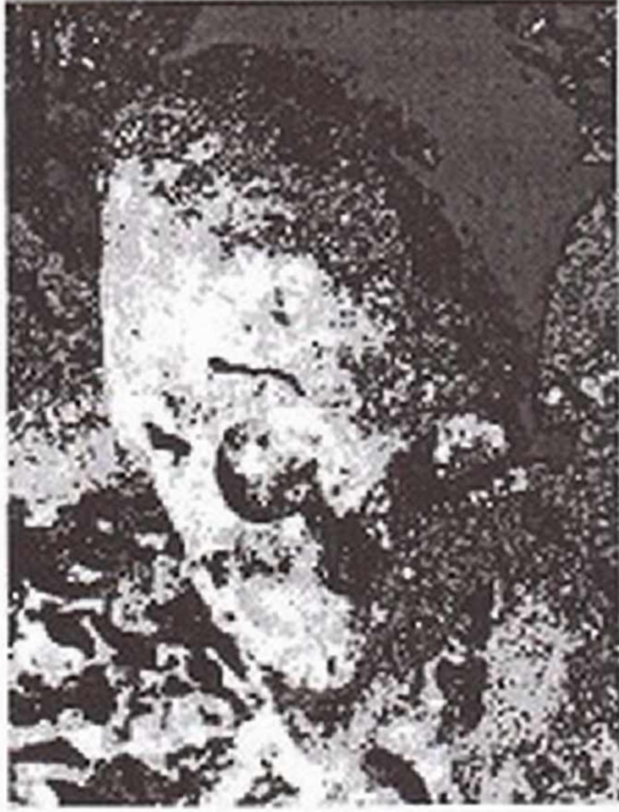
Resim 5: Kafatası Üzerinde Yer Alan İzin Büyütülmüş Görünümü