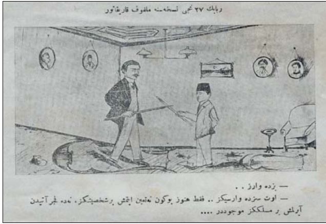
Ft.3- Fecr-i Âtî-Nesl-i Âtî (Yeni Nesil) mücadelesi