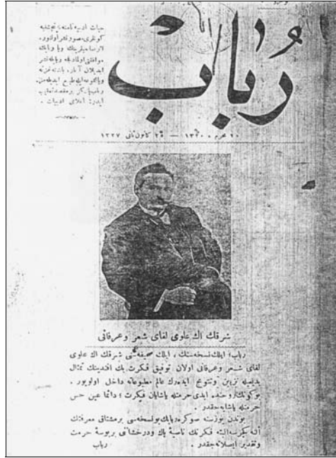
Ft.2- İlk sayının kapağı

Tevfik Fikret (1867-1915), Edebiyat-ı Cedide'den iki dostu ve kalem arkadaşı olan Hüseyin Kâzım Kadri (1870-1934) ve Hüseyin Cahit Yalçın (1875-1957) ile birlikte İttihat ve Terakki adına Tanin gazetesini çıkarmış, fakat daha sonra arkadaşlarına küsüp, İttihatçılığı da, gazeteyi de terk etmişti. Fikret, Rübab'ı çıkaranların ihtiramla karşıladıkları simalardan biri, hatta “ Şark'ın en ulvî lika-yı şiir ve irfanı ” diye alkışladıkları bir şairdir. Öyle ki derginin ilk sayı kapağına (bk. Ft.2) onun fotoğrafını koyularak saygıyı en uç noktada ifade eden şu cümleleri yazılmıştı: