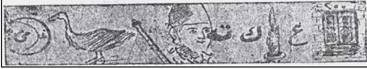
Ft.6- 25. sayının bulmacası

Rübap'ın yansıttığı diğer bir özellik de biraz muhteva, biraz şekil ile ilgili olan bilmece-bulmacalardır. Bu ibare ve ifade metinleri, klasik edebiyatımızdaki muamma ve lûgazların akrabasıdır. Bu dönemde özellikle çocuk ve kadınlara yönelik süreli yayın organlarının bulmaca ve bilmecelere sıkça yer verdiği görülür. Yukarıda, "Harp Edebiyatı" altbaşlıklı kısımda, Rübap'ın bilmece-bulmacaya nasıl bir görev yani muhteva verdiğini gösterdik. Bu gibi eğitim malzemelerinde çoğu zaman, söz ve görüntü birliktedir. Rübap'ta da benzeri bilmece bulmacalar çokça yer almıştır. Hatta bunları çözenlerin adları dergide yayımlanmış ve kendilerine ödülleri verilmiştir. Rübap'ın bazı bilmece-bulmacaları pek sevimlidir. 25. sayıda hem resim hem de harfin yer aldığı şu bulmacayı görüyoruz: