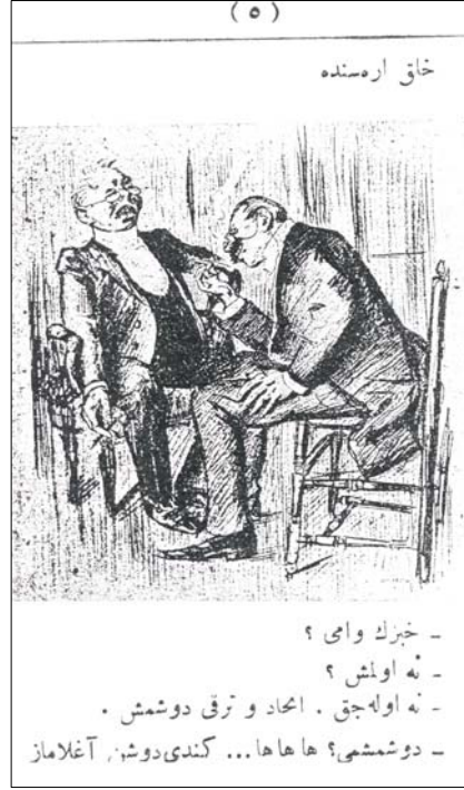
Ft. 5. Karikatür albümünden. Altında şu cümleler okunuyor.

Türkiye'de 1890'lı yıllardan itibaren yayın basım kalitesinde önemli bir gelişme görülmektedir. Baskı ve dizgideki bu güzelleşme, II. Meşrutiyet yıllarında, I. Dünya Savaşı etkilerinin iyice hissedildiği 1915 yılı sonlarına kadar artarak devam etmiştir 47 . II. Meşrutiyet'in 9. ayında yayın hayatına girip I. Dünya Savaşı'nın başlamasına kadar devam eden Şehbal, bu yılların baskı nefasetini en güzel biçimde anlatacak dergilerdendir ve bu özelliğinden dolayı, 1911'de, harp halinde bulunduğumuz İtalya'nın Torino şehrindeki bir yarışmada, dünya birinciliği madalyası