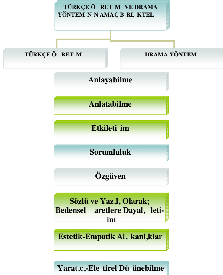
Tablo III. Türkçe Ö retimi ve Drama Yönteminin Amaç Birlikteliği

parças, olan dil, hem ö renmenin arac, ve hem de duygu ve dü üncelerin ifade arac, olur. Çocuk, drama etkinliklerinde hem dil becerisini istedi i gibi ve kendini rahat hissetti i ortamda ö renir hem de ileride kazanaca , beceriler için ön çal, malar yapar. E itici drama etkinlikleri, ele tirel bir anlay, la düzenlenmi ö retim programlar,na uygun olarak konu ma, dinleme ve izleme gibi ileti im becerilerini kazandı,rnak ve i birli i, problemlere çözüm arama gibi sosyal becerileri geli tirmek için etkili bir ö retim arac, özelli i ta ,maktad,r.