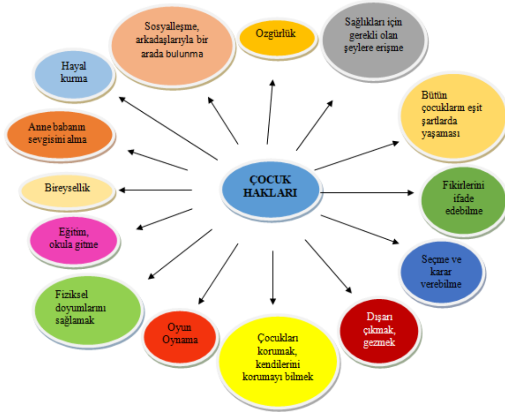
Şekil 1. Annelerin çocukların haklarına ilişkin görüşleri

Annelerin çocuk haklarına ilişkin görüşleri şöyledir: