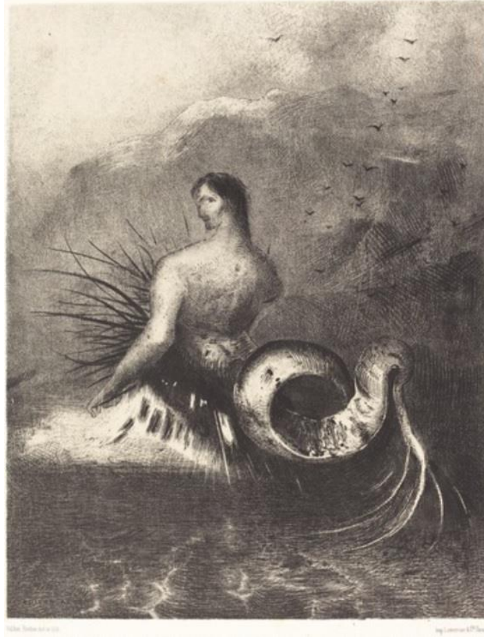
Görsel 7. Odilon Redon, 1883, "Dikenler Giyinmiş Siren, Dalgalardan Ortaya Çıktı", Litografi, 55 x 35.8 cm, Rosenwald Koleksiyonu, Ulusal Sanat Galerisi, Washington Dc, Amerika Birleşik Devletleri