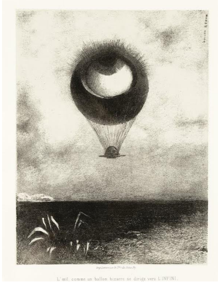
Görsel 8. Odilon Redon, 1882, “Tuhaf Bir Balon Gibi Göz, Sonsuzluğa Doğru”, Edgar Poe Serisi, Litografi, 43.82 x 31.12 cm, Los Angeles Şehir Müzesi, Amerika Birleşik Devletleri.

“...Göründüğümüz veya gördüğümüz her şey düş içinde bir düş değil de ne?” diyen şair Edgar Poe'den ilham alarak ürettiği seride yer alan “Tuhaf Bir Balon Gibi Göz, Sonsuzluğa Doğru” isimli bu eser, altı taşbaskıdan biridir (Görsel 8). Bu serinin en ünlü eseri olan bu çalışmada fiziksel dünyadan ayrılan gizemli ve fantastik bir ortam betimlenmektedir. Bulutlarla dolu bir gökyüzünün altında resmin sol alt tarafında, palmiye benzeri bir bitkinin yaprakları görülürken etrafta herhangi bir başka bitki yoktur (Moma, web, 2020). Resmin merkezinde bataklık bir atmosferde betimlenmiş gökyüzünde uçan göz imgesi şeklindeki balon göze çarpmaktadır. Bu balon yolcu sepeti yerine “Salome'deki İncil hikayesindeki Vaftizci Aziz John'ununki gibi, tepside kesilmiş bir kafa (Art Story, web, 2020)” taşımaktadır. Buradaki “Kesik başlar, Salome hikayelerinde veya bunun gibi daha gizemli görüntülerde, sembolist sanat ve edebiyatta büyük sıklıkta ortaya çıkar. Fiziksel bedenden ayrılan kafa veya göz küresi, günlük yaşamın kısıtlamalarından kurtulmanın ve daha yüksek bir bilinç düzlemine erişmenin bir sembolüdür. Redon resimlerinde beden ve zihnin sınırlamalarını yitirmesine izin verirken, buradaki göz imgesi, gerçekliğin ötesinde, doğanın ötesinde, görünür olanın ötesindeki gerçeği görmenin özünü temsil etmektedir (Art Story, web, 2020).” Francisco Goya'nın baskı resimlerini anımsatan bu çalışma adeta sanatçının bilinçaltının dışavurumu niteliğindedir ve izleyiciye görünenin ötesini sunmaktadır.