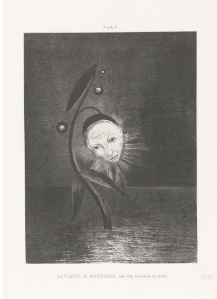
Görsel 9. Odilon Redon, 1885, "Bataklık Çiçeği, İnsan ve Üzgün Bir Kafa", Litografi, 27.5x20.5 cm, Rijksmuseum, Amsterdam Hollanda