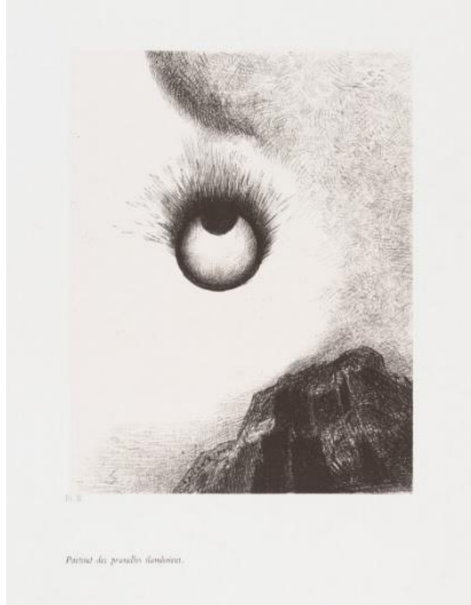
Grsel 4. Odilon Redon, 1888, "Her Yerde Saint Anthony'nin Gnah Adasından Gzbebekleri Alev Alev Yanıyor", Litografi, 20.3 x 15.7 cm.