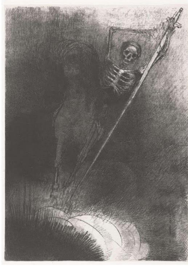
Görsel 2. Odilon Redon, 1899, "At sırtında ölüm", Litografi, 31cm x 22 cm, Rijks Müzesi, Amsterdam Hollanda.

"At sırtında ölüm" isimli bu resmin merkezinde karanlıklar içinden dört nala koşup gelen at imgesi dikkat çekmektedir (Görsel 2). "Asalet, hız, özgürlük ve güzellik simgesi olan at" (Wilkinson, 2011; 54) figürünün hemen üstüdeyse elinde kocaman kılıcıyla iskelet imgesi dikkat çekmektedir. Sıklıkla insan iskeleti şeklinde betimlenen ölüm imgesi bu eserde at sırtında izleyici karşısına çıkmaktadır. Sanat tarihine bakıldığında bu imge ölümün, ölüm sonrası yaşamın, ölümsüzlük ya da yeniden doğumun ve başka bir hayata yolculuğun sembolü olarak kullanılmaktadır. Goya'nın kâbus resimlerini anımsatırcasına karanlık içinden doğan ve dünya hayatının sonunu temsil eden bu iskelet, ölümün ve yok oluşun sembolü olarak izleyici karşısına çıkmaktadır. Sanatçının "insanimsı bitkiler ve böcekler ile başlayan resim yolculuğu çocukluğunun yalnızlığı ile birlikte ölüm korkusuna ve dinsel bir içe dönüklüğe yansiyarak eserlerinde kendini göstermiştir. Gravür çalışmalarıyla öne çıkmıştır. Işık ve gölge kullanımında ışıkla oynayarak gölgeleri koyulaştırarak ışığın etkisini belirginleştirmiştir (Öztürk, 2019; 60)." Böylece oluşturmak istediği ruhani etkiyi de arttırmıştır. Gitmek istediği yere bir an önce varmak için son hızıyla atını sürmekte olan ölüm, insanlığın sonunu hazırlamakta ve onun bu dünyadan gidişinin yani gerçek yaşama olan yolculuğunun zamanının geldiğini vurgulamaktadır.