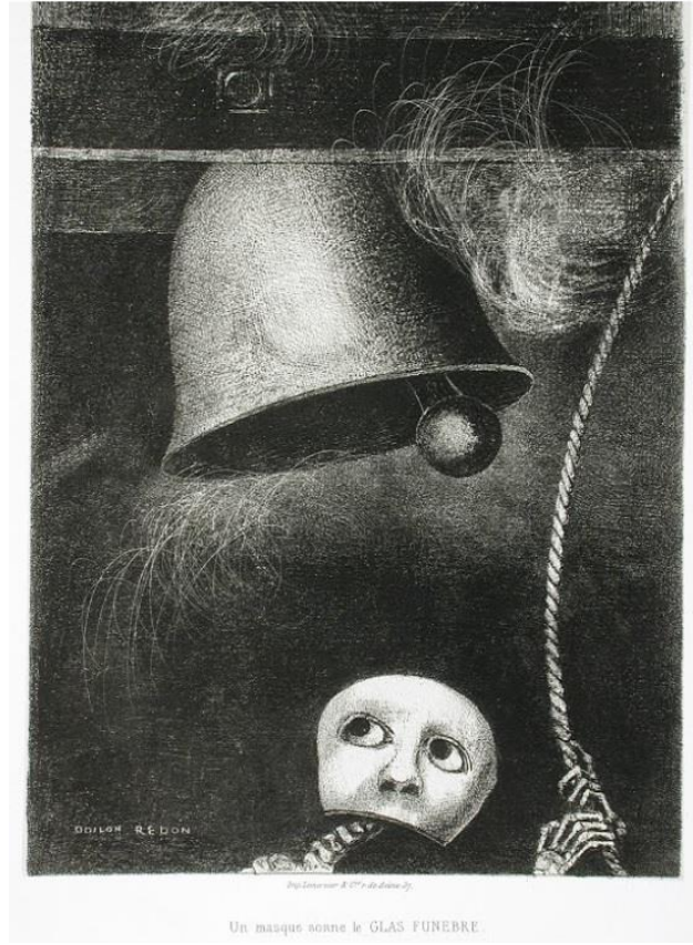
Görsel 1. Odilon Redon, 1882, “Bir Maske Ölüm Çanını Çalar”, Litografi, 44.77 x 31.12 cm, Los Angeles Şehir Müzesi, Amerika Birleşik Devletleri

Düşselin büyüsünü yaşamın güven verici temalarıyla birleştiren sanatçının litografi tekniğiyle yapılmış “Bir Maske Ölüm Çanını Çalar” isimli bu eserinde, karanlık bir kompozisyon hakimdir (Görsel 1). Resmin merkezinde ilk dikkati çeken bu dünya yaşamının güzelliklerinin geçiciliğini ve sonunda her şeyin bitmek zorunda olduğunun kutsal sembolü olan kafatasını anımsatan maske imgesidir. Bu imge elleri ve omurgası görünen bir iskelet olarak izleyici karşısına çıkmaktadır. “Koruyucu insan iskeleti imgesi, ölümün kişileştirilmesidir. Klasik dönemdeki şöenlerde yaşamın gelip geçici hazzını anımsatmak üzere iskeletler olurdu (Wilkinson, 2011; 114)”. Tam da bu noktada ölümün, yok oluşun ve de yeniden doğuşun sembolü olan iskelet imgesi gözleriyle çanın hareketini takip ederken elleriyle tuttuğu iple de çanı çalmaktadır. Başlangıçta insanları tehlikelerden korumak için kullanılan çan imgesi, günümüzde özellikle Hristiyanlıkta insanları ibadete çağırarak, milli bayramları, zafer günleri ve ölüm gibi olayları halka duyurmak için kullanılmaktadır. Burada ölümün sembolü olan iskelet imgesinin var gücüyle ölüm çanını çalması, izleyiciye ölüm vaktinin geldiğini haber vermektedir.