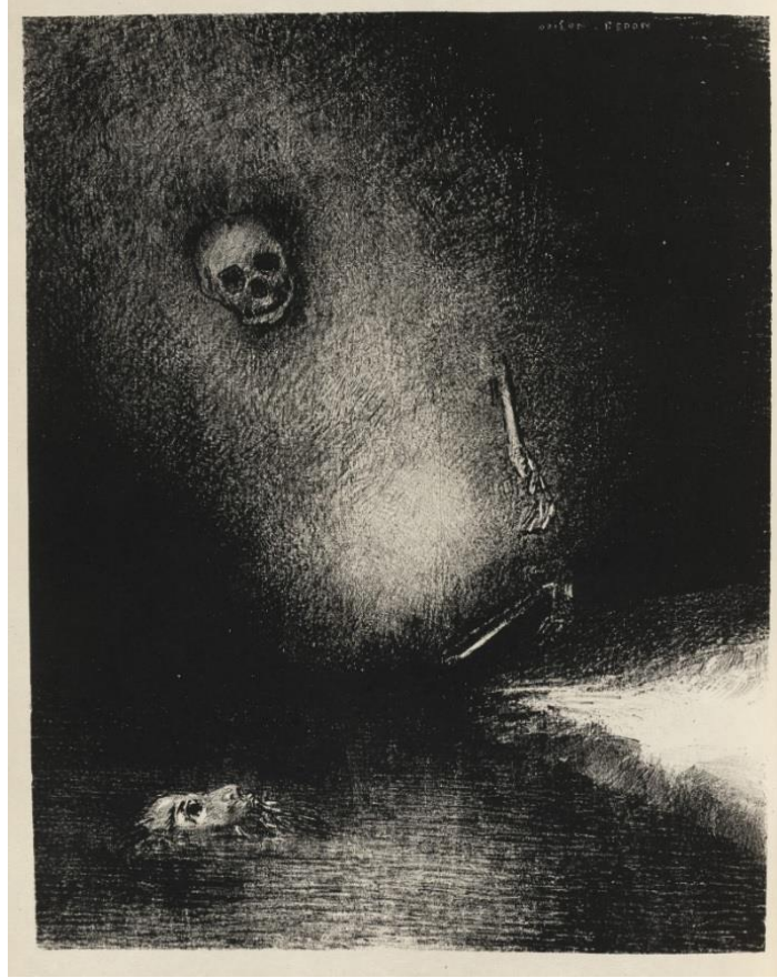
Görsel 3. Odilon Redon, 1887, "Hayaletlerin Uğursuz Komutanlığı Yerine Getirildi. Rüya Ölümle Gerçekleşir", Litografi, 23.7 x 18.8 cm.

Redon'un resimleri izleyiciye "... sessizlik ve gizem dünyası, boğuntuları ve sanrılarıyla, hayranlık ve coşkularıyla, koşut bir dünyanın, bilinçaltının dünyasının kapılarını açar ... (Cassou, 1999; 128)." Bu bağlamdaki resimlerinden biri de "Hayaletlerin Uğursuz Komutanlığı Yerine Getirildi. Rüya Ölümle Gerçekleşir" isimli eseridir (Görsel 3). Bu eserinde karanlık bir rüya atmosferi yaratan sanatçı, ışıklı alanda resmin merkezinde bir iskelet imgesi betimlemiştir. Varlık anlamıyla zıtlık yaratırcasına karanlığın içinden adeta bir güneş gibi doğan bu iskelet imgesi, hayatın sonunu yani ölümü sembolize etmektedir. Ürkütücü bakışlarını izleyiciye diken ölüm, bir elini hemen önünde suyun içinde yatan figüre uzatmaktadır. Bu imge uzattığı eliyle izleyicinin dikkatini suyun yüzeyindeki figüre çekerken suyun içinde ölmüş ve bedeni suyun yüzeyine çıkmış bir erkek cesedi yatmaktadır. Ölüm görevini yerine getirmiş ve bir bedeni daha alarak onu sonsuzluğa uğurlamıştır.