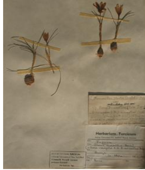
Şekil 1. Crocus reticulatus Steven ex Adams subsp. reticulatus

ANK her yıl çok sayıda yerli ve yabancı botanikçiler tarafından ziyaret edilmekte olup bu botanikçiler kendi araştırmalarında topladıkları bitki örneklerini herbaryum örnekleri ile karşılaştırmakta ve büyük ölçüde herbaryumumuzdan yararlanmaktadır. İşte bu denli büyük bir öneme sahip herbaryumda düzenleme ve yeniden gözden geçirme çalışmasına ihtiyaç duyularak böyle bir çalışma yapılmıştır. ANK'da Iridaceae familyasına ait 391 örnek mevcuttur. Bu örnekler 1889 ve 2001 yılları arasında değişik araştırmacılar tarafından toplanmıştır.