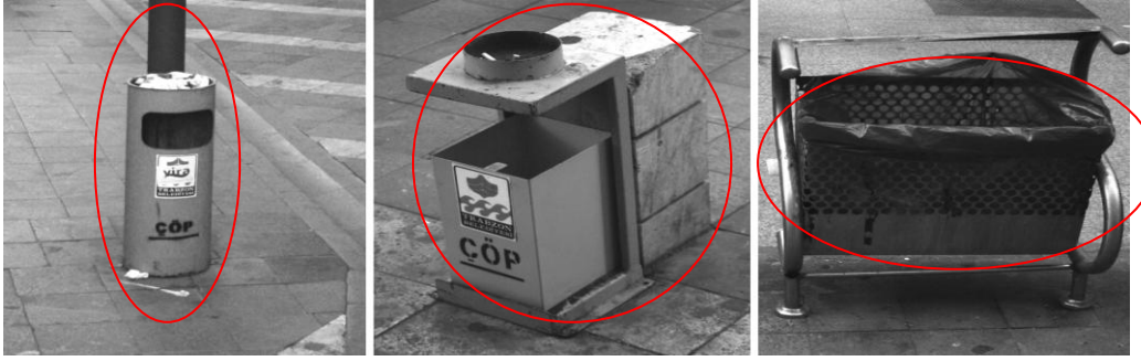
Şekil 8. Uzun Sokak üzerinde bulunan çöp kutuları