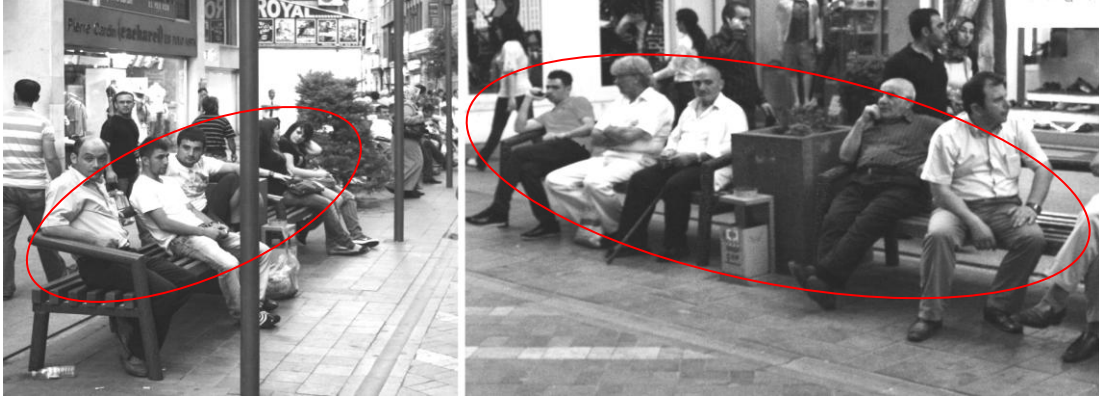
Şekil 7. Uzun Sokak üzerinde bulunan oturma elemanları

içerisinde her hangi farklı bir caddede de kullanılacak özellikte olması göz ardı edilmiştir (Şekil 7). Kullanılan oturma elemanları kent dokusuyla uyumsuz, çağdaş ve estetik çözümlerle ele alınmamıştır.