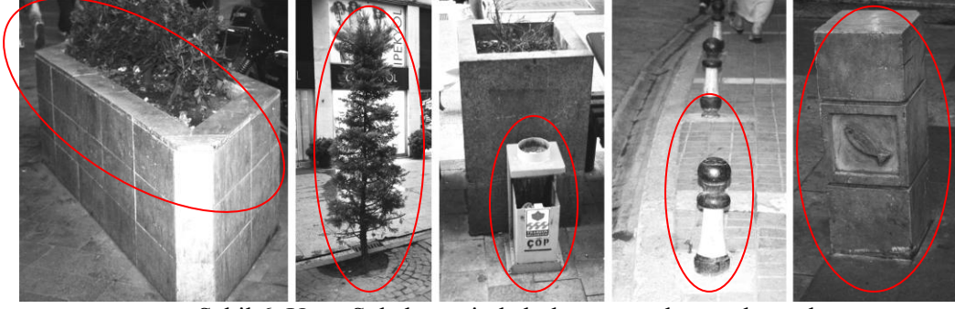
Şekil 6. Uzun Sokak üzerinde bulunan sınırlayıcı elemanları

Sınırlayıcı elemanların kullanımları ve görsel nitelikleri açısından halka sorulan anket soruları değerlendirilmiştir. Sınırlayıcı elemanların kent kimliğini yansıtmadığı ve yetersiz olduğu belirlenmiştir. Sınırlayıcıların kullanılmasında estetik ve kullanım prensipleri ele alınmamıştır.