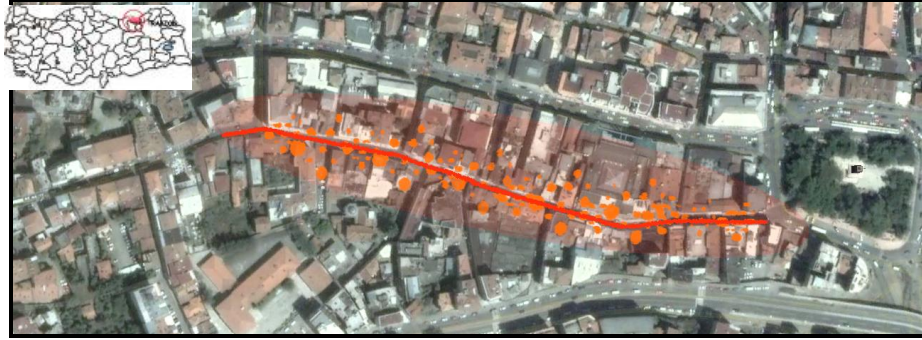
Şekil 1. Çalışma alanı olan Uzun Sokak, Trabzon (URL 2, 2010, URL 3, 2010)

alanları ve restoranlar ile insanları cezbeden bir olgusu bulunmaktadır (Şekil 1). Son yıllarda caddenin araç trafiğine kapanması ile kullanıcı yoğunluğu oldukça artmış, her kesimden kullanıcıya sahip olan cadde donatı elemanlarına ihtiyaç duymaya başlamıştır. Ayrıca caddenin tarihi ve kültürel yapısını içinde bulundurması sebebiyle kentin kimliğini yansıtan donatıları barındırması beklenmektedir.