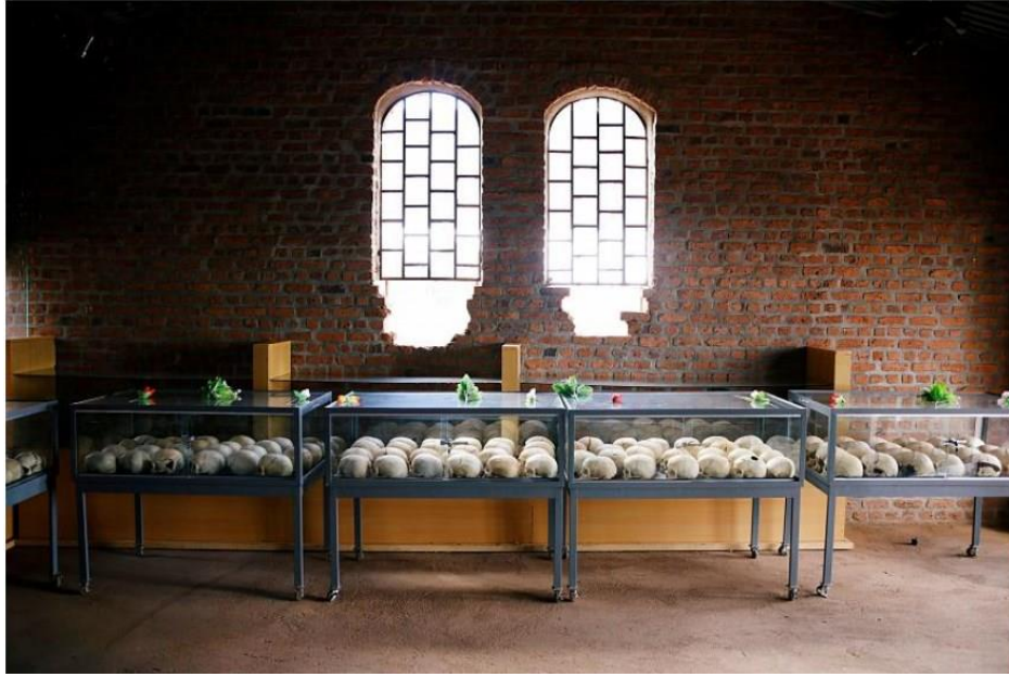
Resim 4: Soykırımda Hayatını Kaybedenlere Ait Kafatasları

Euronews'in 3 Haziran 2020 tarihli haberi de Paris istinaf mahkemesinin, Ruanda soykırımının "finansörü" olmakla suçlanan Felicien Kabuga'nın yargılanması için Birleşmiş Milletler Uluslararası Ceza Mahkemesi'ne gönderilmesini kabul ettiğini yazmıştır. Haberde Ruanda Soykırımı ile ilgili olarak sorumlu görünen Felicien Kabuga hakkında 1997 yılında toplam yedi soykırım bağlantılı suçlamayla soruşturma açıldığına dair de bilgi verildi.