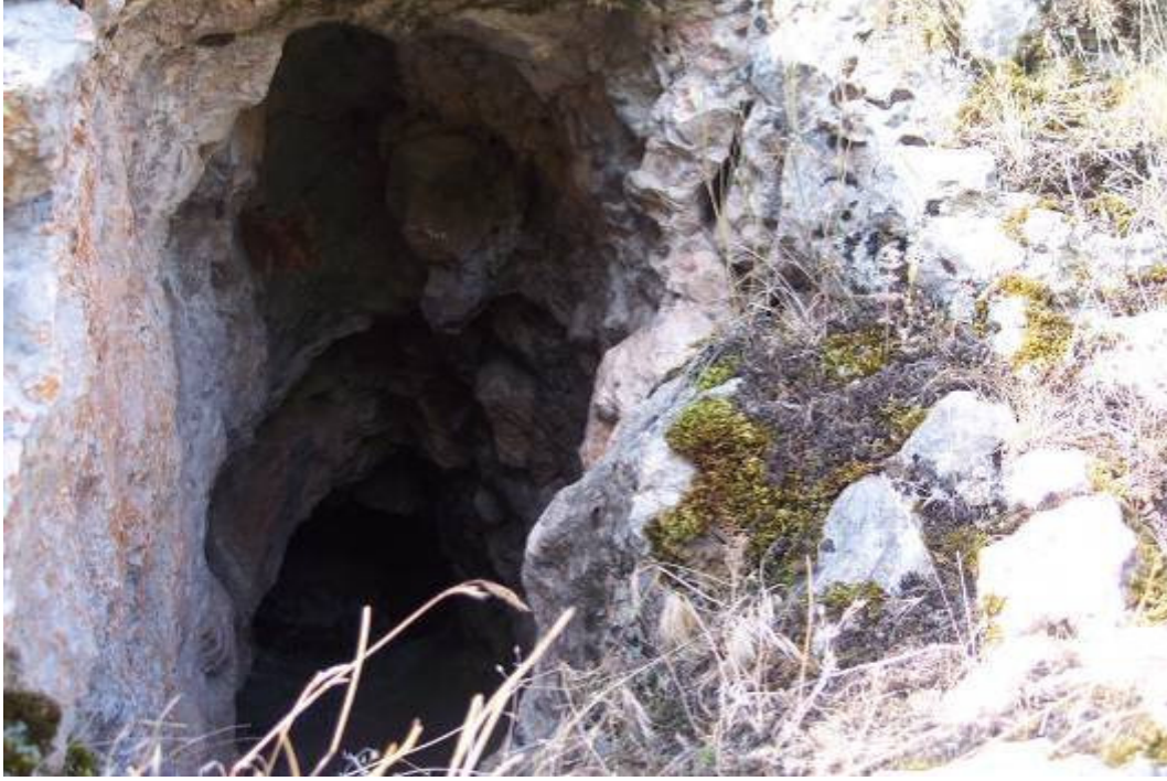
Figür-5 Bayburt Kalesi Kaya Basamaklı Su Tünelinin (Çoruh'a Açılan Kısım)