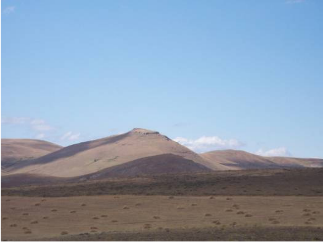
Figür-13 Bayrampaşa Kalesi Genel Görünüm