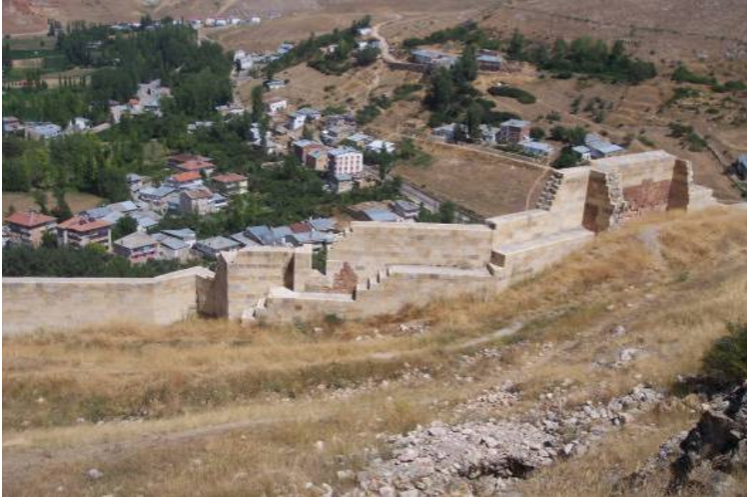
Figür-2 Bayburt Kalesi Sur Duvarları