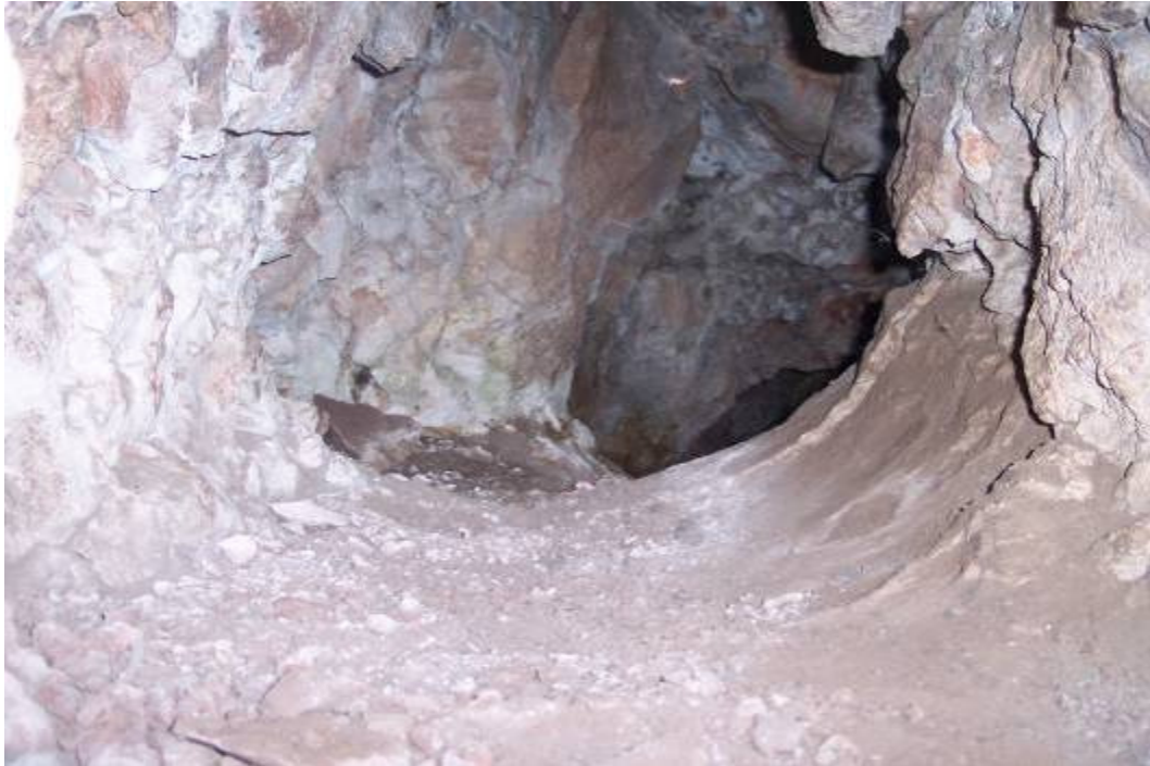
Figür-6 Bayburt Kalesi Kaya Basamaklı Su Tünelinin (Çoruh'a Açılan Kısım)