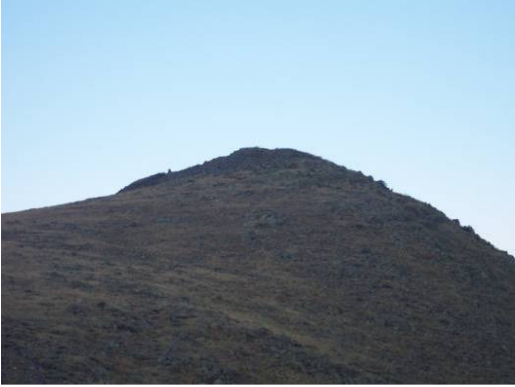
Figür-7 Kitre Kalesi Genel Görünüm