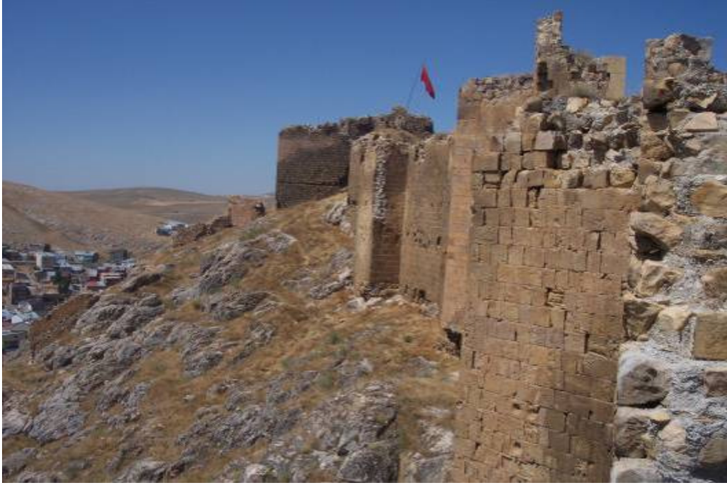
Figür-3 Bayburt Kalesi Sur Duvarları