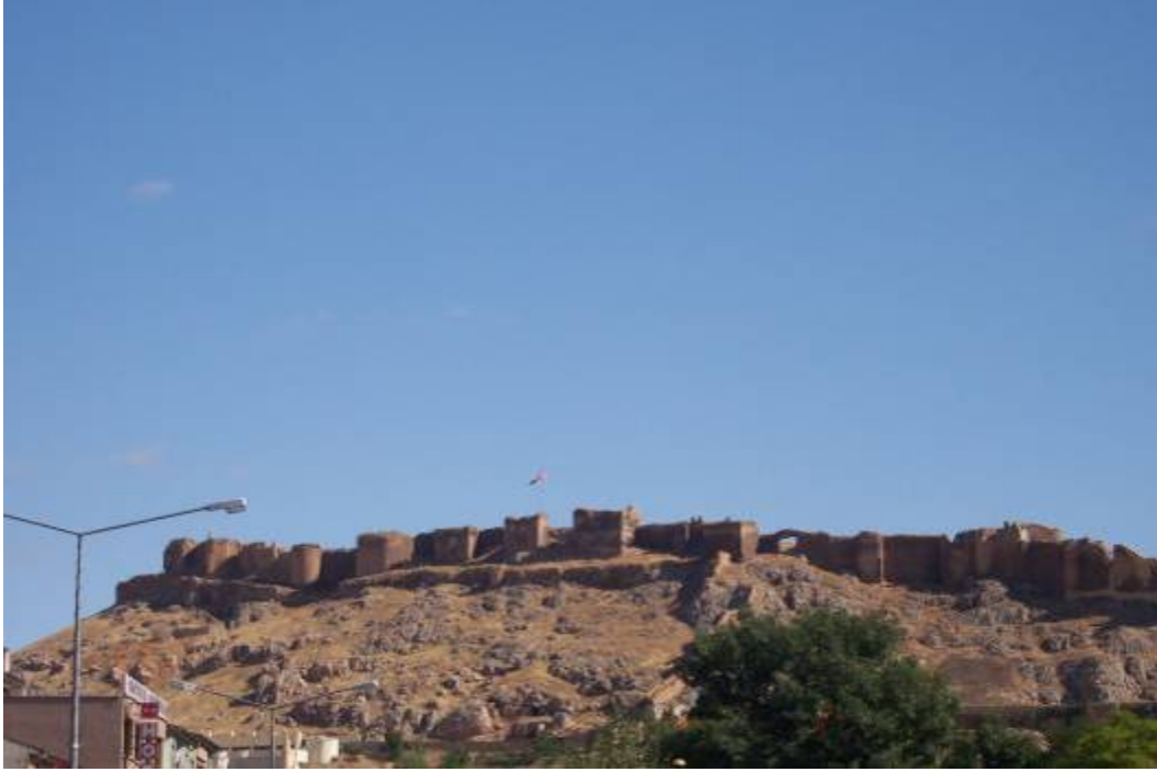
Figür-1 Bayburt Kalesi Genel Görünüm