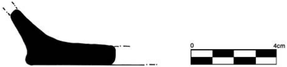
Figür-4 Bayburt Kalesi