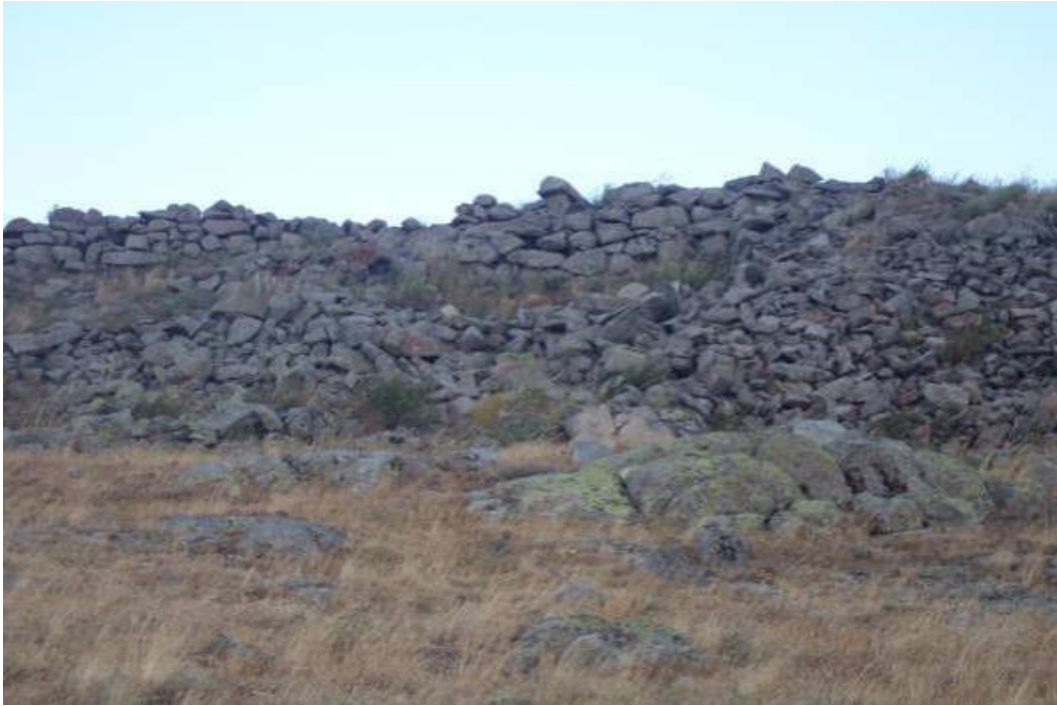
Figür-8 Kitre Kalesi Duvar Örgüsü