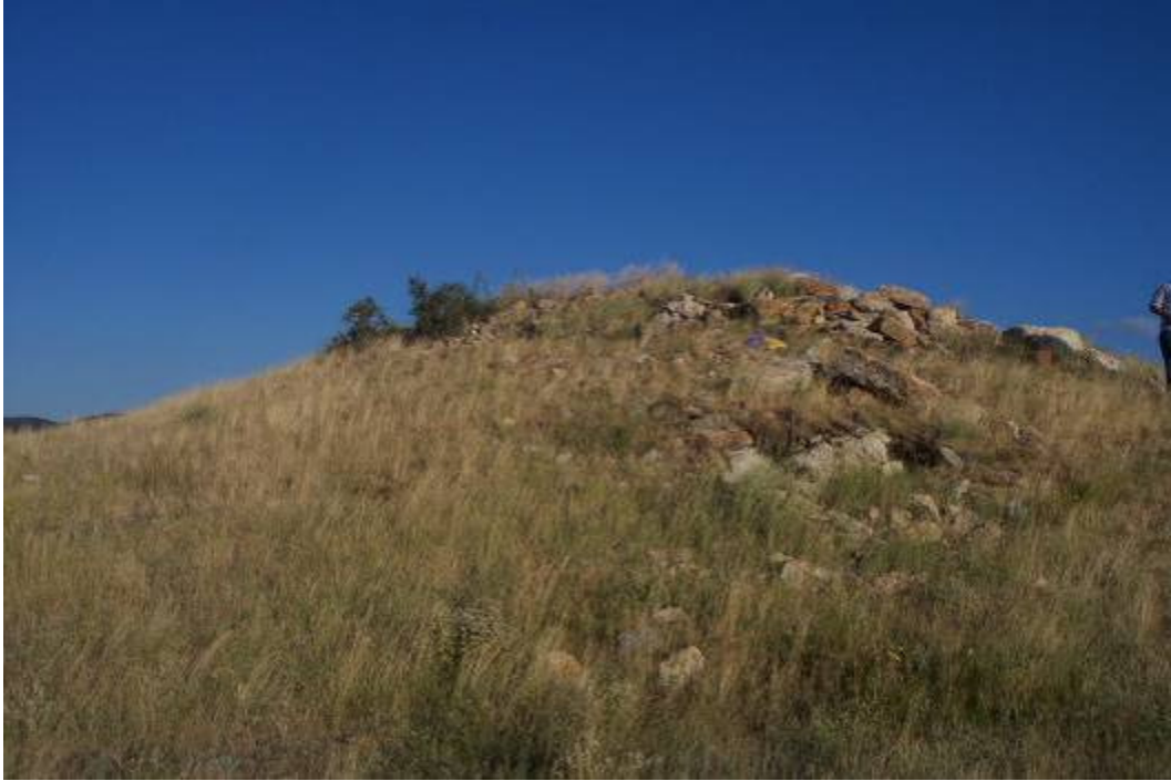
Figür-12 Kaplı Kalesi Mimari İzler