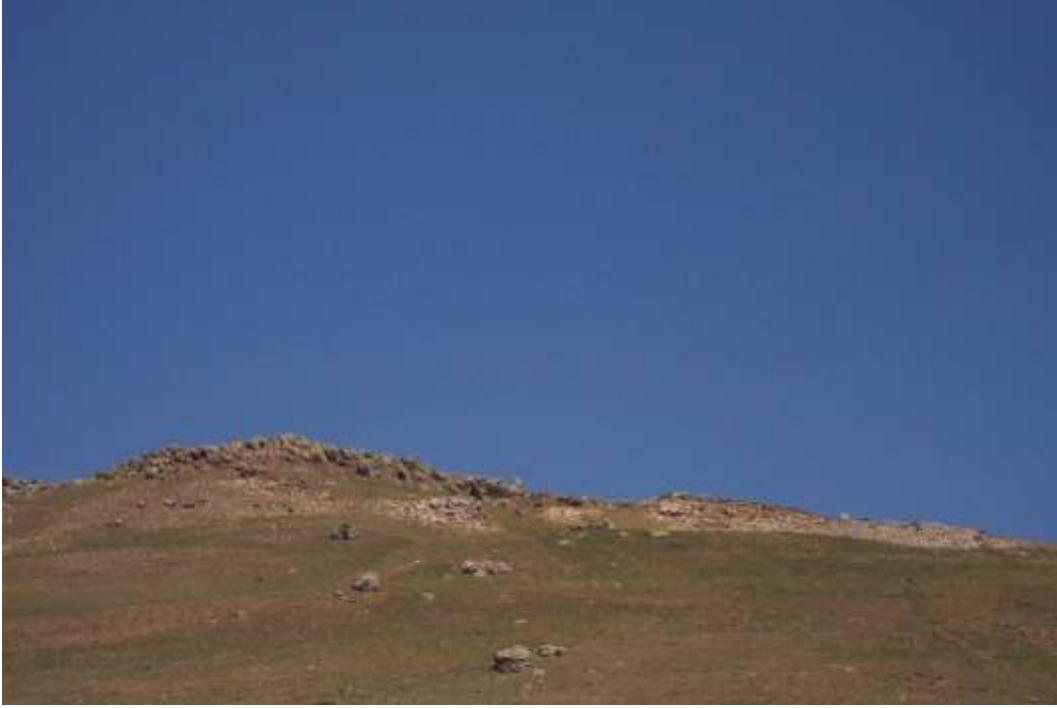
Figür-15 Aydıntepe Kalesi Genel Görünüm