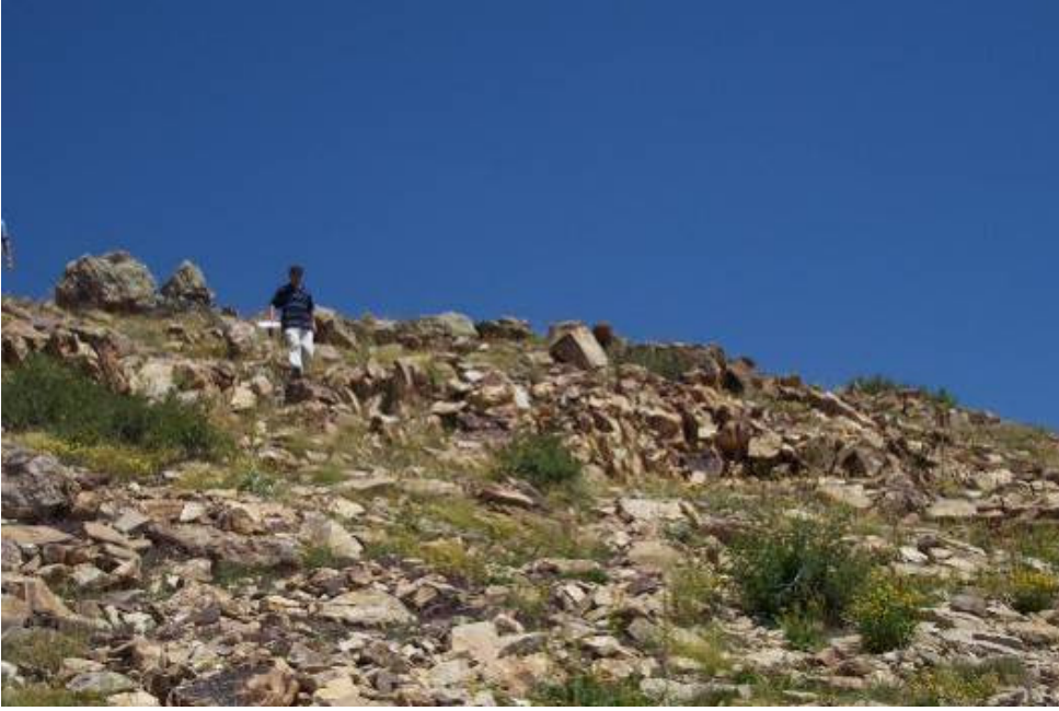
Figür-17 Aydıntepe Kalesi Mimari Kalıntı İzleri