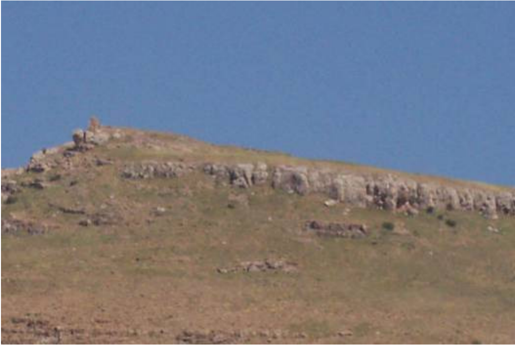
Figür-14 Bayrampaşa Kalesi Sur Duvarları