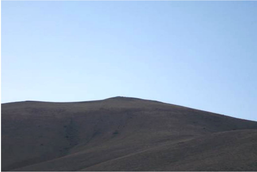
Figür-10 Kapılı Kalesi Genel Görünüm