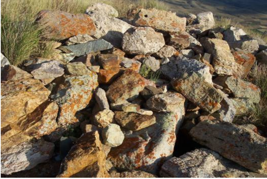
Figür-11 Kaplı Kalesi Duvar Kalıntıları