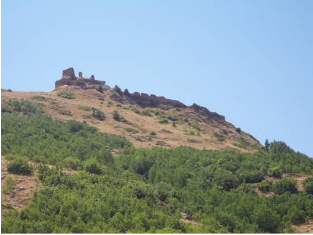
Figür-9 Sarıhan Kalesi Genel Görünüm