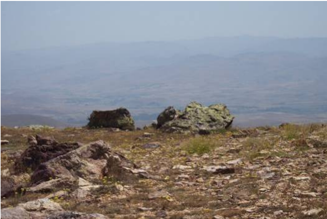
Figür-16 Aydıntepe Kalesi'nden Detay