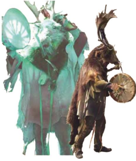
Resim 2. Bir Şamanın ruh yönlendirme töreni. Temsili resim

Düzensizlik, kuralsızlık, savurganlık ve kargaşa gibi günlük sıradan hayatın gidişatına ters düşen ancak yenileyici, yatıştırıcı ve birleştirici etkisi ile ekonomik, sosyal ve kutsal yapılanmaları iyileştiren ve sağlamlaştıran ritüel kökenli (And 1982: 4) törenler şenlikler olarak değerlendirilir. Türklerde doğum, ölüm, evlenme, tanrıdan yardım, ihsan dilenmek, ihsan için şükran arz etmek, ölüleri anmak, hastaların sağlığa kavuşmaları, çocuğun dünyaya gelmesi, verimli hasat gibi özel günler ve dini ayinlerde