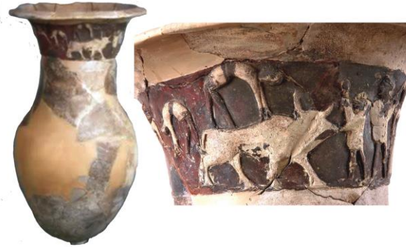
Resim 1. Hitit Hüseyindedede vazosu. Müzisyenler ve dansçılarla birlikte Hitit sosyal yaşamındaki kutsal bir düğün töreninin aşamalarını gösteren kabartma sahnelerindeki akrobasi hareketleri, sirk gösterisinin ilk kanıtlarıdır. MÖ 1600'lerde Eski Hitit Krallığı'ndan kalmadır. Çorum Sungurlu ilçesi Yörüklü Kasabasının 2,5 km yakınındaki Hüseyindedede tepesinde bulunmuştur.

gösterilerinin Anadolu topraklarında yapıldığını anlatır. Diğer yandan geleneksel Türk Tiyatrosu 'nun, Köylü Tiyatrosu , Halk Tiyatrosu , Saray Tiyatrosu ve Batı Tiyatrosu olmak üzere dört ayrı geleneğe dayandığı bilinmektedir (Sekmen & Ateş, 2014: 21). Bu bağlamda Halk Tiyatrosu, metinsiz, sahnesiz bir tiyatro olup, kentlerde gelişen (ktb.gov.tr, E.T. 07.11.2020) ancak daha çok fakir toplumsal kesime hitap eden Karagöz, Meddah, Orta oyunu, köy seyirlik oyunları, kukla ve çengi gibi oyun türleri ortaya çıkarmış (Wikipedia, ET. 08.11.2020) spontane diyaloglu, geleneksel tiyatrodur. Bu geleneğin kendi içinde "söze dayalı" ve "sözsüz" olmak üzere birtakım seyirlik oyunlardan oluştuğu bilinmektedir (Sekmen & Ateş, 2014: 21). Özellikle de sözsüz seyirlik oyunlar daha çok XVI. yüzyıldan XVIII. yüzyıl ortalarına kadar süren Osmanlı Şenlikleri'nde uygulanan canbazlık, gözbağcılık, dans, akrobasi ve denge numaraları, hayvan eğitimi gibi sirk sanatı içinde yer alan gösterilerden meydana gelmektedir (And, 1985: 43). Aynı şekilde And, geleneksel köylü tiyatrosu ile Orta Asya Türk kültürünü doğrudan ilişkilendirmekle kalmaz, öncesinde ise orta oyunu geleneğinin olduğuna işaret eder. Geleneksel sahne sanatları ve Ramazan eğlenceleri, sirk performansı olarak isimlendirilmese de akrobatik gösterilerin bugünkü sirkten farkı