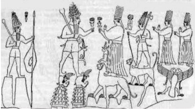
Resim 1. Akrobasi gösterilerinin olduğu bir Hitit kutlaması. Hayvanlarla yapılan törensel gösteri, Hitit kutlamalarının ihtişamını, verilen önemi gösterir.

gerilmiş bir ip üzerinde içsel dengeyle yürüme üzerine kurulu gelenekten gelen elementler sirk sanatının temelini oluşturmuştur (Çevikavak, 2018: 1).