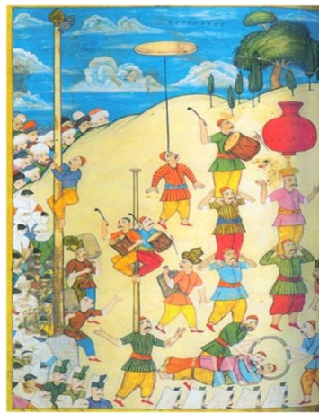
Resim 4. İp canbazlığının da eski Türk kültüründeki yeri kutsaldır. İp canbazları giydikleri turkuaz renkli bol elbiseleri ile göğe yükselişi temsil ederler. Bu uygulama Orta Asya'daki Türk topluluklarında halen devam etmektedir. İp canbazları, terazi adı verilen bir değneğin yardımıyla, iki ağaç arasına çok iyi gerilmiş bir ip üzerinde akıl almaz hareketler yapar. Özellikle kurban bayramlarında canbazların ipte kurban kesmeleri, ip canbazları için bir adettir. Evliya Çelebi Seyahatnamesinde döneminin ip canbazlarını ve olimpiyat niteliğindeki karşılaşmalarına oldukça geniş bir yer vermiştir.