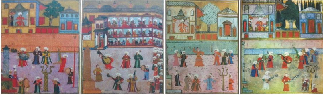
Resim 5. Birkaç sahne dışında anlatım boyunca değişmeyen bu çerçeve, şenliği padişahın gözü ile anlatır. Şehrin diğer kısımlarını, halkın ne dereceye kadar gösterilerle iç içe olduğu hakkında ip ucu vermez ancak Nizami'nin kalemi ve Nakkaş Osman'ın tasvirleri zamanın eğlence anlayışı ve uygulamaları hakkında çok zengin bir kaynak ortaya koymuştur. (Kay. Nazlı Miraç Ümit).

eğlendiren, oyalayan seyirlikler ve gösterim sanatları içeren tören ve kutlama niteliği almıştır (And, 1982:4). Bu yeni şenlik düzeni Osmanlı döneminde, sultanların tahta çıkması, saraydaki doğumlar, şehzadelerin öğrenime başlaması, bir savaşın kazanılması yahut sefer öncesi, saraydaki kızların evliliği ve erkek çocuklarının sünneti gibi sebeplerle saray tarafından düzenlenen görkemli eğlencelerde vücut bulmuştur (Ümit, 2014: 130). Osmanlı Devleti, 19. yüzyılın ilk yıllarından itibaren Batının etkisi altında modernleşmeye çalışırken Avrupa monarşilerinde uygulanagelen birtakım siyasî ritüelleri ve adetleri de bünyesine almaya başlamıştır. Çağdaş Monarşi” oluşturma çabasının bir sonucu olarak bir yandan hükümdarın portreleri resmî dairelere asılmaya başlanırken, bir yandan da padişahların tahta çıkış yıl dönümleri ve doğum günleri kutlanmaya başlanmıştır. II. Mahmud, saltanatının son yıllarında almış olduğu kararlarla doğum gününün ve tahta çıkış yıl dönümünün kutlanması uygulamasını başlatmıştır (Olgun 2018:111). Zaten batı tarzındaki sirk performans gösterileri de yine Batı öykünmesi bu şenliklerde iyice görünür olmuştur.