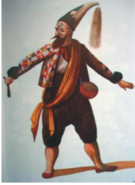
Resim8.Papliaçi, Pulcinella, Arlecchino, Dottore v.b. Commedia dell'arte karakterlerini ve barok sanatını etkileyen Osmanlı Maskarabazları ve Madrabazı

Osmanlı Devleti'nin üçüncü padişahı, Murad-ı Hüdavendigâr çocuklarının sünnet törenini Bursa Kalesinin Fetih kapısındaki Pınarbaşı şenlik alanında düzenlenen kapsamlı bir şenlikle yapmış daha sonraki padişahlar aynı geleneği yüzlerce yıl devam ettirmişlerdir. Bu şenlikler Vakanüvislerce kayda alınmış, nakkaş ve ressamlarca minyatürleri yapılmıştır. Her ne kadar şenlikler 15. yüzyıl Batılaşma akımıyla etkilenmiş, saray tarafından düzenleniyor ve yönlendiriliyor olsa da halk, bu şenliklerde yalnızca seyirci değil, aynı zamanda katılımcı olarak da bulunmaktadır. Esnaf, meslek alanları, zanaatçı dernek ve loncaları çalışmalarını, yeteneklerini sergilerken, şenliğin havasına uygun oyunlar çıkarıyor, her meslek grubu hünerlerini gösteriyor ve geçit alaylarına katılıyorlardı. Ayrıca, şenliklere gelen yüzlerce oyuncu, sanatçı, güç göstericileri, hüner sahibi kişiler, hezarenler, dervişler, ozanlar, yazarlar ve hattatların yanı sıra, seyre gelmiş halk arasındaki hüner sahibi kişiler de gösterilere katkıda bulunurlardı. Yabancı ülkelerden gelen meraklı gözlemcilerin eşliğinde Osmanlı şenlikleri coşkuyla kutlanıp, sirk gösterilerine imkân veriyordu.