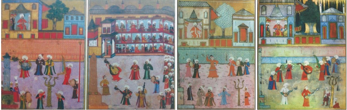
Resim 7. Osmanlı şenliklerinde Çemberlitaş meydanında kurulan Trapez "Salıncak" gösterisi. At meydanı sırtlarında (Sultanahmet Camiinin bulunduğu yer) Canbazlar. Pargalı İbrahim Paşa Sarayından (şimdiki adalet sarayının bulunduğu yer) At meydanı

Osmanlı Devleti'nin üçüncü padişahı, Murad-ı Hüdavendigâr çocuklarının sünnet törenini Bursa Kalesinin Fetih kapısındaki Pınarbaşı şenlik alanında düzenlenen kapsamlı bir şenlikle yapmış daha sonraki padişahlar aynı geleneği yüzlerce yıl devam ettirmişlerdir. Bu şenlikler Vakanüvislerce kayda alınmış, nakkaş ve ressamlarca minyatürleri yapılmıştır. Her ne kadar şenlikler 15. yüzyıl Batılaşma akımıyla etkilenmiş, saray tarafından düzenleniyor ve yönlendiriliyor olsa da halk, bu şenliklerde yalnızca seyirci değil, aynı zamanda katılımcı olarak da bulunmaktadır. Esnaf, meslek alanları, zanaatçı dernek ve loncaları çalışmalarını, yeteneklerini sergilerken, şenliğin havasına uygun oyunlar çıkarıyor, her meslek grubu hünerlerini gösteriyor ve geçit alaylarına katılıyorlardı. Ayrıca, şenliklere gelen yüzlerce oyuncu, sanatçı, güç göstericileri, hüner sahibi kişiler, hezarenler, dervişler, ozanlar, yazarlar ve hattatların yanı sıra, seyre gelmiş halk arasındaki hüner sahibi kişiler de gösterilere katkıda bulunurlardı. Yabancı ülkelerden gelen meraklı gözlemcilerin eşliğinde Osmanlı şenlikleri coşkuyla kutlanıp, sirk gösterilerine imkân veriyordu.