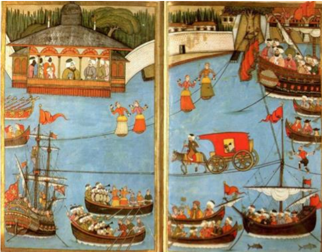
Resim 6. Sultan III. Ahmed'in Şehzadelerinin sünnet düğünü / 1720 Nakkaç Levni / Sûrname-i Vehbî "Sûr-i Hümayûn"

İçin birçok sebep üretilmiştir. Mustafa Sekmen, Osmanlı şenliklerindeki söz konusu hüner gösterilerindeki çeşitliliğin, Batı'daki sirk sanatı disiplinleriyle karşılaştırılabilecek düzeyde bir zenginliğe sahip olduğuna dikkat çeker (2014: 21). Bu