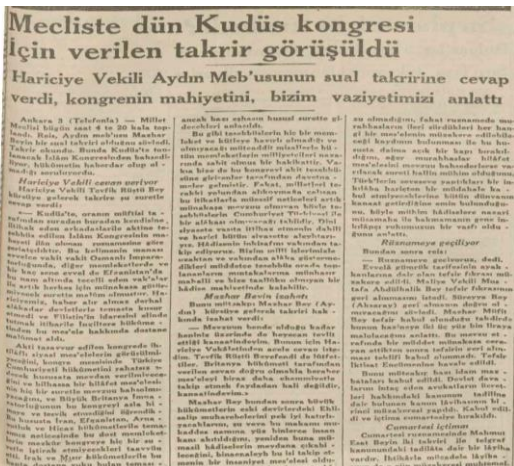
Ek 1. Cumhuriyet, 4 Aralık 1931.