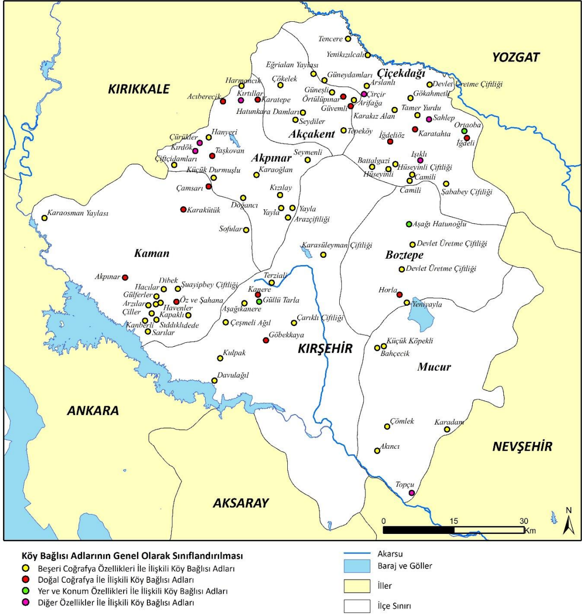
Şekil 1. Köy bağlilı yerleşme adlarının genel olarak sınıflandırılması