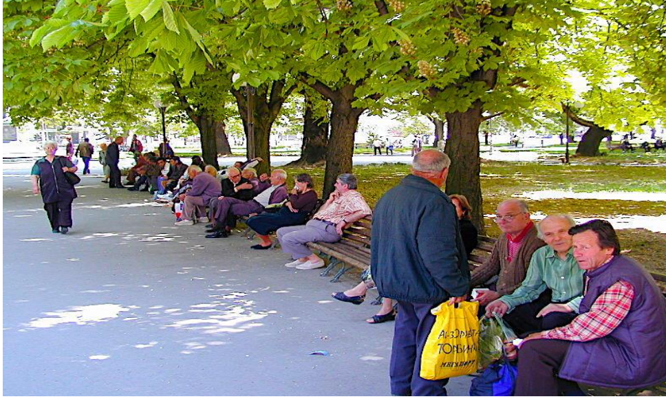
7. Eski Zağra – Şehrin Merkez Parkı

Eserin ikinci bölümü, “ Hercümerc-i Kıt’a-i Rumeli ” adını taşır. 93 Harbi’nin Rumeli cephesindeki askerî harekâtının ana hatlarıyla ele alındığı bu bölüm, esasen bu süreçte yapılan askerî hataları ve bunların sonuçlarını dile getirir. Süleyman Paşa’nın Eski Zağra’yı Rusların elinden kurtarması, bu zaman zarfında çekilen acılar, yaşanan zulümler ve hicret olayının yürekleri parçalayan sahneleri bu bölümde anlatılır.