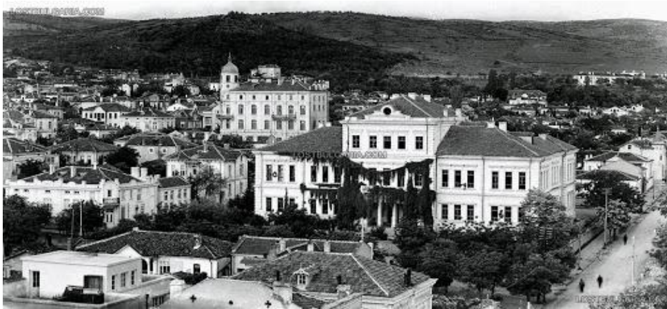
5. 20. Yüzyıl Başlarında Eski Zağra