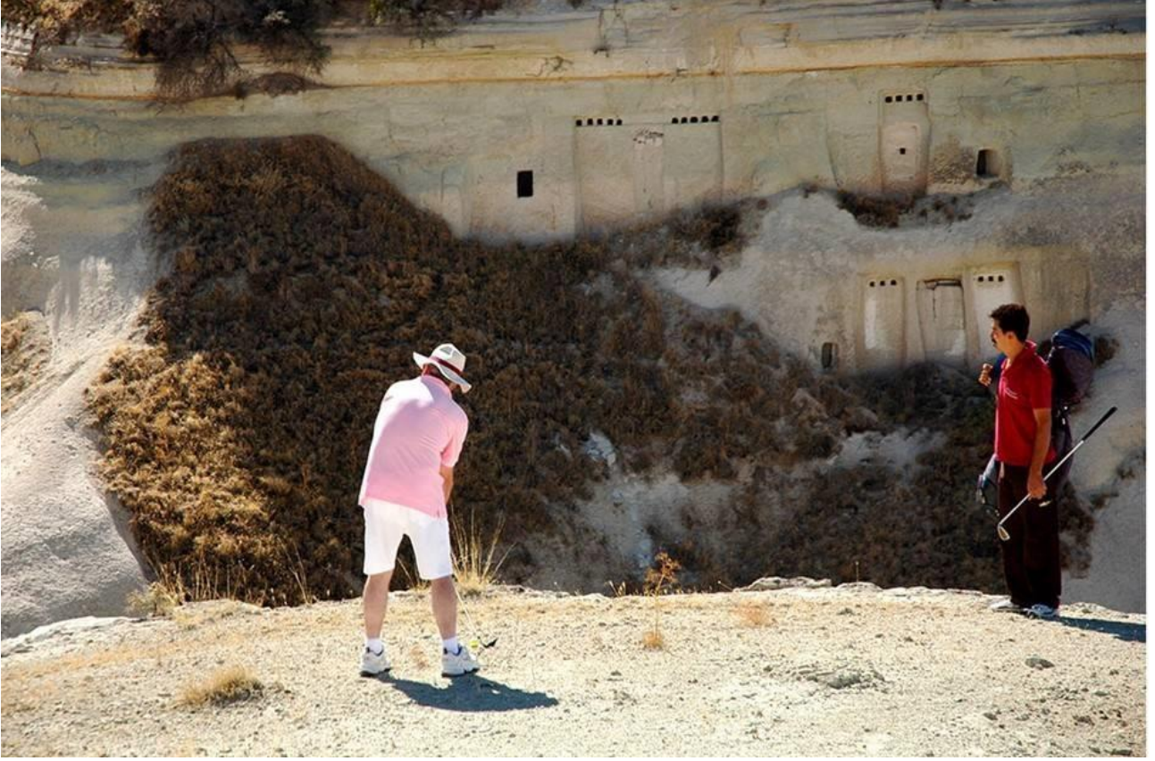
Resim 2. Cross Golf Turnuasından Bir Görüntü