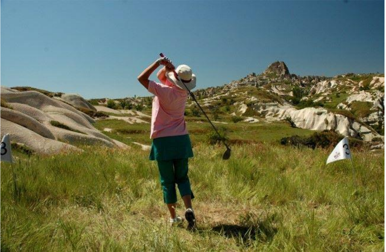
Resim 1. Cross Golf Turnuvasından Bir Kare

Türkiye Turizm Stratejisi 2023 Eylem Planı kapsamında golf turizminin günümüzde faaliyet gösteren bölgelerden farklı yerlerde de yapılması öngörülmüştür. Bu nedenle Frigya, Kapadokya, GAP, Urartu gibi belirlenen çeşitli turizm gelişim bölgelerinde golf turizminin geliştirilmesine yönelik adımların atılması öngörülmüştür (Boz, Gülüm ve Çoban, 2010: 696). Belirlenen eylem planına uygun olarak Kapadokya Bölgesi'nde golfe yönelik çalışmalar başlamıştır.