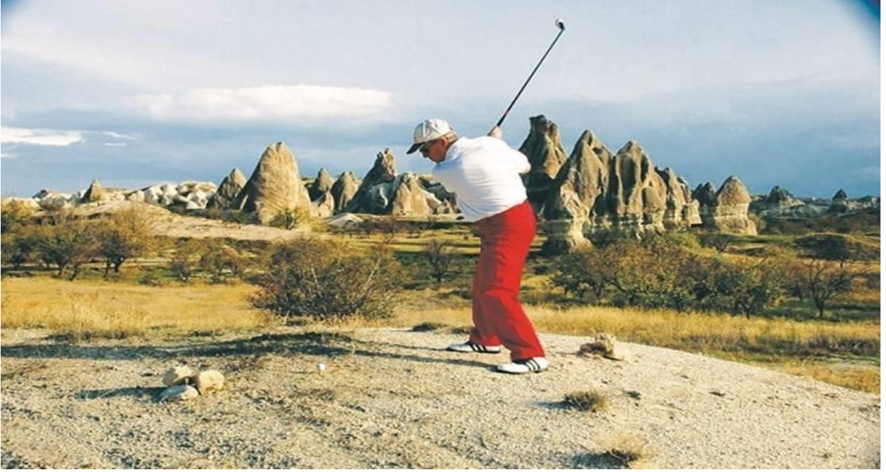
Resim 3. Cross Golf' ün Kapadokya Bölgesi'nde Oynanabileceğine İlişkin Tanıtım Karelerinden Bir Görsel