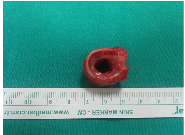
Şekil III: Hastanın rezeke edilen yaklaşık 2cm lik stenotik trakeal segmenti.

Hastanın genç olması ve kısa sürede yeniden stenoz gelişmesi nedeniyle cerrahiye karar verildi. Hastaya standart 'collar' kesi uygulandı. Stenotik segmentin alt bölgesinden trakea transvers olarak kesildi. Havalandırma işlemi spiral tüple distal trakeadan sağlandı. Yaklaşık 2 cm lik stenotik segment üst kısımdan yapılan kesi ile çıkarıldı ( Şekil III ). Trakea anastomozu arka duvardan başlayarak, tek tek 3/0 vikril ile yapıldı. Trakeadaki gerginliği azaltmak için hasta uyandırılmadan önce, çeneden manubrium sterni üzerine boynu antefleksiyonda tutacak şekilde sütür konuldu. Ameliyattan hemen sonra ekstübasyon yapıldı. Çene sütürleri yedinci gün alındı. Solunumsal semptomları düzelen hasta externe edildi. Postop 15.gün yapılan flexible bronkoskopide anastomozun proksimali ile distali arasında ciddi çap farkı olmadığı görüldü ( Şekil IV ).