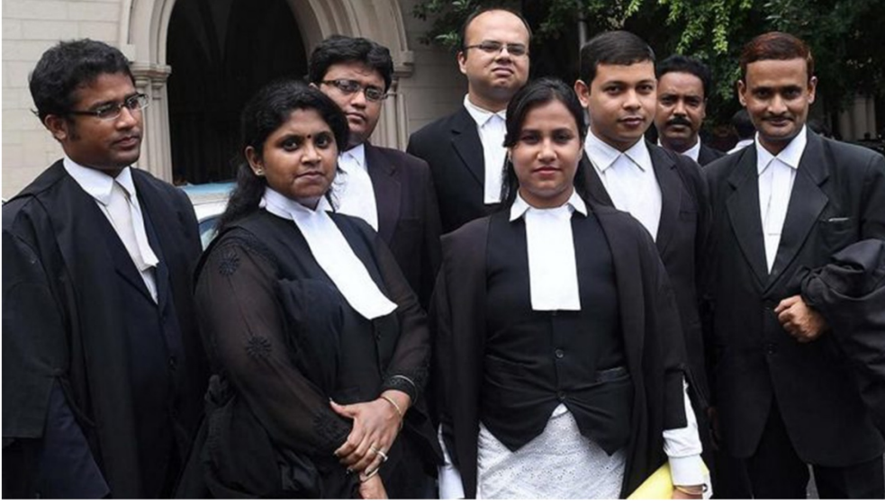
Şekil 6. Beyaz yaka bantları ile Hindistanlı avukatlar (The Print, 2020).

Giysilerin ve renk etkileşimlerinin statü ile ilişkili örneklerine rastlamak mümkündür. Beyaz; dini, kültürel ve psikolojik anlamları ile sosyal boyutta statü çağrışımlarına aracılık edebilmektedir ve bu doğrultuda bir kişinin görevi, sorumlulukları ve rütbesi gibi bağlantılarla ilişkilendirilebilmektedir. Bu durum Türk tarihinde açıkça gözlenebilmektedir. Eski Türk devletlerinde, devletin hükümdarlarının ve üst düzey yöneticilerinin hakim rengi beyaz olmuştur. Toplumsal düzeyde kullanımında ise Eski Türkler beyaz, köle ve cariyeler ise kara çadırlarda yaşamışlardır (Özcan, 2008, s. 279)