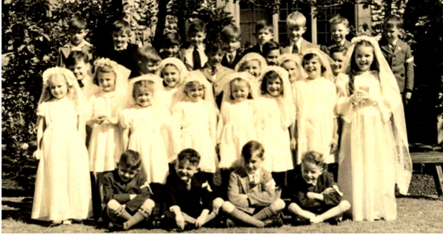
Şekil 1. Bir grup çocuğun ilk Efkarsitiya ayini portresi, Holyrood School, Swindon, 1949, (Wikimedia, 2007).

Geçmiş yüzyıllarda kiliselerde giysisiz olarak vaftiz edilenlere ilk olarak, Hristiyanlıkta yeni doğuşu sembolize eden beyaz giysiler verilmiştir. Bu yeni başlangıca eşlik eden beyaz elbisenin hayat boyu günahlar ile manevi olarak kirletilmemesi, ölüm sonrasında cennete hazır olunması durumuna işaret edeceğine inanılmaktadır (Kosloski, 2017) Katolik aileler, çocuklarının katılım gösterdikleri ilk Efkarsitiya ayininde erkek çocuk için takım elbise, kız çocuk için beyaz elbise ve duvak tercih edebilmektedir (Stith, 2015, s. 93). Erken dönem Hristiyan teologları, bakire kişilerin duvak takmalarını manevi boyutta 'İsa'nın Gelini' olma durumu ile ilişkilendirmektedir (Castelli, 1986, s. 71). Geleneğin bir parçası olarak erkekler de sol kollarına beyaz kurdele bağlayabilmektedir (Jarvis, 2007, s. 86) (Şekil 1). Bazı ayinlerde hem kız hem erkek aynı tipte beyaz cübbeler giyebilmektedir. Kızların tercih ettiği beyaz elbiseler saflığı, iffeti ve Tanrı'ya itaati sembolize etmektedir (Stith, 2015, s. 94).