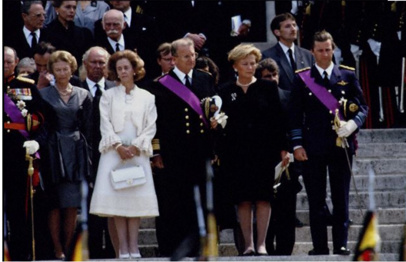
Şekil 3. Belçika Kralı Boudouin'in cenazesi ve eşi Kraliçe Fabiola, (The Royal Forums, 2005).

Orta Çağ'da, Avrupa kraliçelerinin yaşanan ölümler sonrasında beyaz giysiler ile yas tuttıkları örneklerine rastlanmıştır (Isaacs, 2020, s. 10). Dönemin tabloları ve tasvirlerinde dul eşler beyazlar içerisinde gösterilmektedir. Fransızca 'Deuil blanc' yani beyaz yas söylemi, 16. yüzyılda öksüz çocukların ve bekar kadınların beyaz giymesi ile bağlantılı olarak ortaya çıkmıştır. Beyaz yas, Fransa'nın hüküm süren kraliçeleri için bir gelenek haline gelmiştir (Understanding the different colors of mourning, 2019). Eşlerini kaybeden kraliçelerin beyaz giyme geleneğine daha yakın zamanlı örneklerde de rastlamak mümkündür. Belçika Kralı Boudouin'in ölümü (1993) ile Kraliçe Fabiola eşinin cenazesinde beyaz giysiler tercih etmiştir (Şekil 3) (Isaacs, 2020, s. 10).