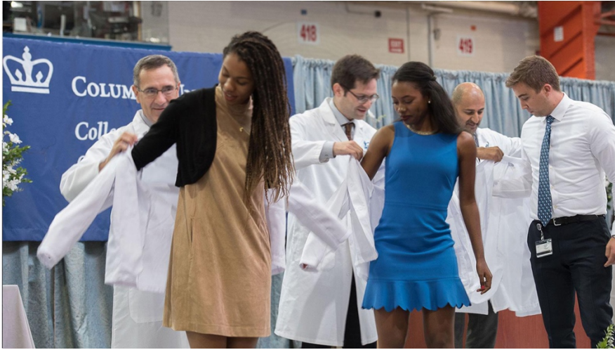
Şekil 7. Columbia University Vagelos College of Physicians and Surgeons, Beyaz Önlük Töreni (Columbia University, t.y.).

Doktorlar için beyaz önlük 20. yüzyılın sonlarında bir çeşit tören aracına da dönüşmüştür. Beyaz önlük töreni, 1993 yılında Arnold P. Gold Foundation'ın iş birliği ile Columbia University College of Physicians and Surgeons'ta başlatılmıştır. Tören kapsamında ilk defa beyaz önlük giyecek olan öğrencilere, üst sınıf öğrencileri yardımcı olmaktadır (Şekil 7). Bu tören öğrencilere ettikleri Hipokrat yeminini ve beraberinde doktor olmanın sorumluluklarını hatırlatma amacı taşıyan bir çeşit doktorluğa geçiş töreni olarak tanımlanabilmektedir (The White coat – a universally recognized medical uniform, 2009).