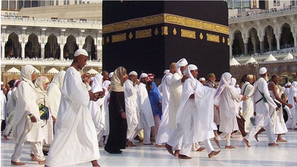
Şekil 2. İhram içerisinde Hac ibadetini gerçekleştiren Müslümanlar (Manevi destek dayanışma, 2019).

Hac ibadetini yerine getirmek amacıyla Mekke’ye giden Müslümanlar, şehir sınırından itibaren ihram adı verilen beyaz giysiler giymektedir (Gordon, 2011, s. 256-257) (Şekil 2). İhram içerisinde, yani bu beyaz ve lekesiz örtüler içerisinde kişinin gösteriş ve kibirden sakınması beklenmektedir. İhram Hac için toplanan tüm Müslümanlara bir çeşit eşitlik duygusu da yaratmaktadır (Öğüt, t.y.).