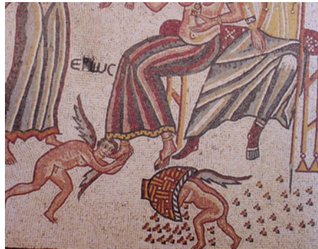
Resim 4. Bal hırsız Eros, Theotokos bazilikası mozaik döşeme, Ürdün, MS 6. yüzyıl (Germanidou 2017, 96, Figür 4)