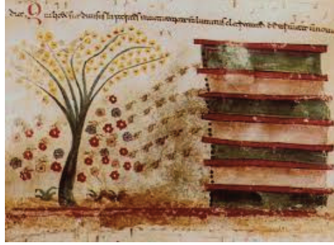
Resim 8. Paskalya zamanı kiliselerde söylenen ilahinin resmedildiği bir minyatür, Troia (Germanidou 2017, 98, Figür 9)