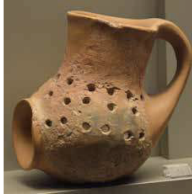
Resim 3. Sesklo'da bulunan pişmiş toprak buhurdanlık (Kritsky 2017, 53, Figür 6)