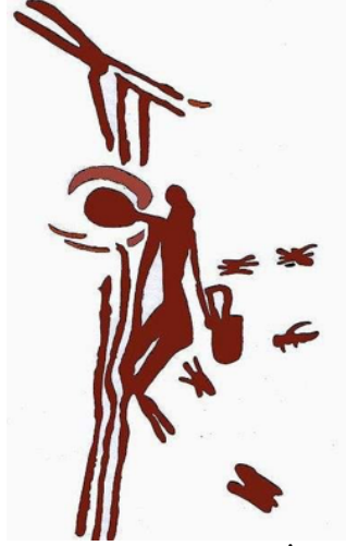
Resim 1. Bal toplayan insan figürü (Arana Mağarası- İspanya) (Nayık vd. 2014, 6, Figür 1)