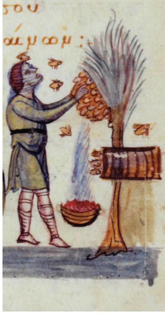
Resim 5. Arıcılığı icat eden Aristaeos’un minyatürü, 11. yüzyılın ikinci yarısı (Germanidou 2017, 95, Figür 3)