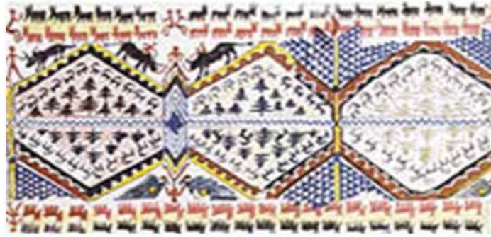
Resim 2. Çatalhöyük’de yer alan motiflerde uçan arılar (Kandemir 2017, 86, Figür 2)