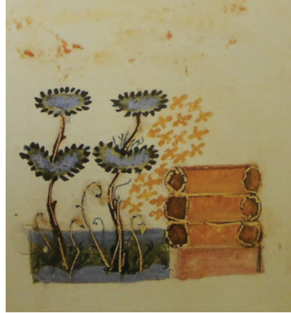
Resim 6. Her iki ucu açık yatay ağaç gövdesi ya da pişmiş topraktan yapılmış arı kovanları (Germanidou 2017, 97, Figür 6)