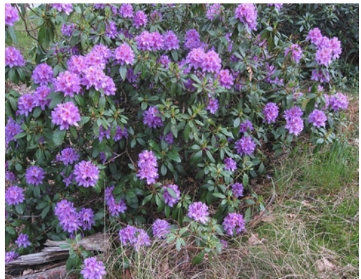
Resim 14. Mor renkli orman gülü ( https://tr.wikipedia.org/wiki/Mor_çiçekli_ormangülü , 10.03.2021)