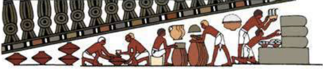
Resim 4. Bal hasadını gösteren Rekhmire mezarı duvar resmi, Yeni Krallık (Kritsky 2017, 52, Figür 3)