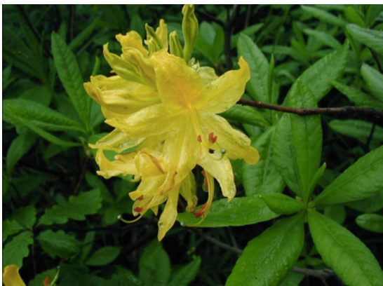
Resim 13. Sarı renkli orman gülü ( https://tr.wikipedia.org/wiki/Sarı_çiçekli_ormangülü , 10.03.2021)