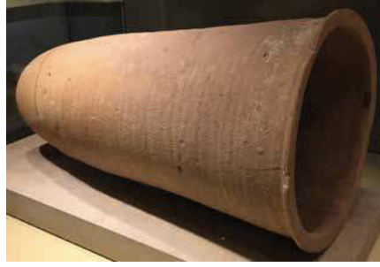
Resim 2. MÖ 4. yüzyıl pişmiş toprak arı kovanı, Yunanistan (Kritsky 2017, 53, Figür 3)