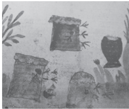
Resim 7. Kütük gövdelerinden yapılan arı kovanlarını gösteren minyatür (Germanidou 2017, 97, Figür 6)