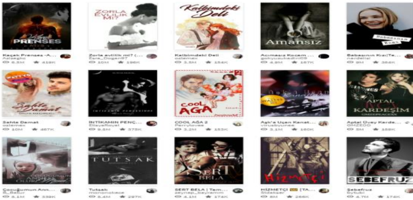
Şekil 2. Araştırma Kapsamında İncelenen Kitaplar

30.09.2019-08.10.2019 tarihleri arasında 1336 kitaba ulaşılmıştır. Çalışmanın yöntemine uygun olarak araştırma örneklemine 150.000 ve üzeri beğeni alan toplam 15 kitap girmektedir. Doküman inceleme sürecinde hikayelerin okunma-beğenme sayılarında değişiklikler olduğu gözlemlenmiştir. Yine, bazı hikayelerin kitap olarak basılacak olması sebebiyle yayından kaldırıldığı tespit edilmiş ve bu hikayeler mevcut örnekle kapsamından çıkartılmıştır. İncelenen eserler şunlardır;