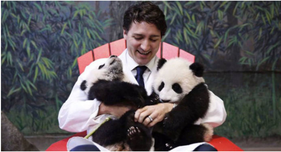
Görsel 9: Kanada Başbakanı Justin Trudeau, İkiz Yavrular Jia Panpan ve Jia Yueyue ile Toronto Hayvanat Bahçesi'nde

Kaynak: @JustinTrudeau, "Today I Had the Pleasure to Unveil the Names of TheTorontoZoo's Panda Cubs! Say Hello to Jia Panpan&Jia Yueyue", Twitter , https://twitter.com/justintrudeau/status/706876218692472832 (Erişim Tarihi: 23.01.2021).