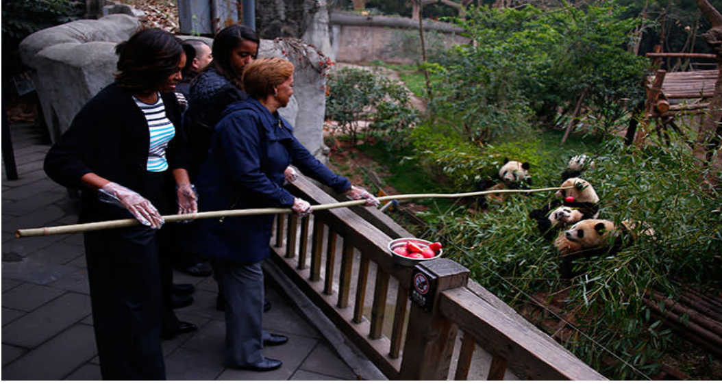
Görsel 8: Michelle Obama Kızlarıyla Birlikte Sichuan Eyaleti'ne Bağlı Chengdu'da Pandaları Besliyor