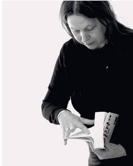
Görsel 1. Irma Boom' ait portre fotoğrafı.

Irma Boom'un sanatçı olmadığı yönündeki açıklamalarına karşılık, yakın arkadaşı ve birlikte çalıştığı mimar Rem Koolhaas "sanatçı olmadığına yönelik inancı bir kültür meselesi olabilir-Hollanda titizliğinin bir ürünü olabilir" ifadeleriyle bu açıklamaya karşı bir tavırda bulunur. 6