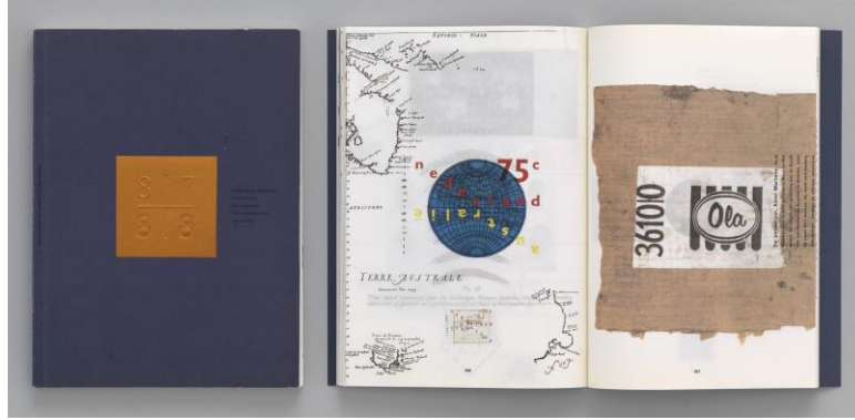
Görsel 2. Irma Boom, Nederlandse Postzegel , 1987, Ofset baskı kitap, Museum of Modern Art, New York.

Devlete ait posta pulu kataloglarından yararlanan sanatçı, kişisel özgürlük alanı olarak seri üretilmiş kitap tasarımını tuval olarak kullanmıştır. 7