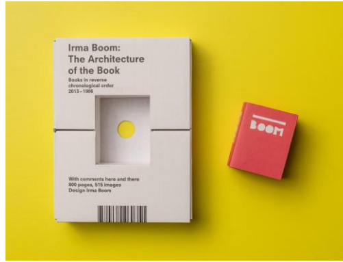
Görsel 7. Irma Boom, Architecture of the Book , Ofset baskı, 2013, MoMA, New York.

Tasarımlarında kavrama önem veren sanatçı, ele aldığı kavramın çerçevesinde tasarımına yön verir. Tasarımlarının prototiplerini dijital değil fiziki ortamda üretmektedir. Dijitalleşen çağın sağladığı avantajlarla birlikte, baskı teknolojilerin de olanakları genişlemiş ve deneysel yapıdaki üretimleri mümkün kılmıştır. Ekranda düz bir yüzeyde tasarım yapmaktansa üç boyutlu olarak fiziki bir nesne yapmayı tercih eden sanatçı, bu konuyla ilgili olarak şu ifadelerde bulunmuştur: