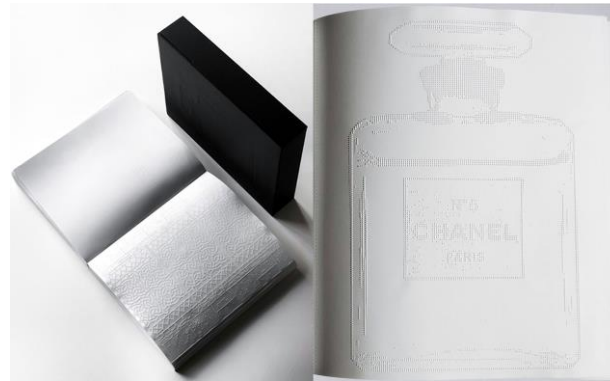
Görsel 5. Irma Boom, N°5 Culture Chanel , Ofset baskı, 2013.

Irma Boom'un çalışmalarını incelediğimizde her zaman bir sonraki projesinde şaşırtmayı başaran bir yaratıcılık ortaya koyduğunu görürüz. Sanatçının büyük ve yaratıcı projelerinden birisi de Chanel için yaptığı N°5 Culture Chanel isimli kitaptır (Görsel 5). Paris moda evi, 2013 yılında sanatçının da küçük yaşlardan itibaren kullandığı parfümle ilgili olarak kitap talebinde bulunmuştur. En titiz kavramsal çalışmalarından biri olan bu kitapta sanatçı kendi deyimiyle neredeyse var olmayan, ancak çok mevcut bir şey yapmak istemiştir. Ortaya çıkan sonuç tamamen mürekkepsiz bir kitaptır. 10