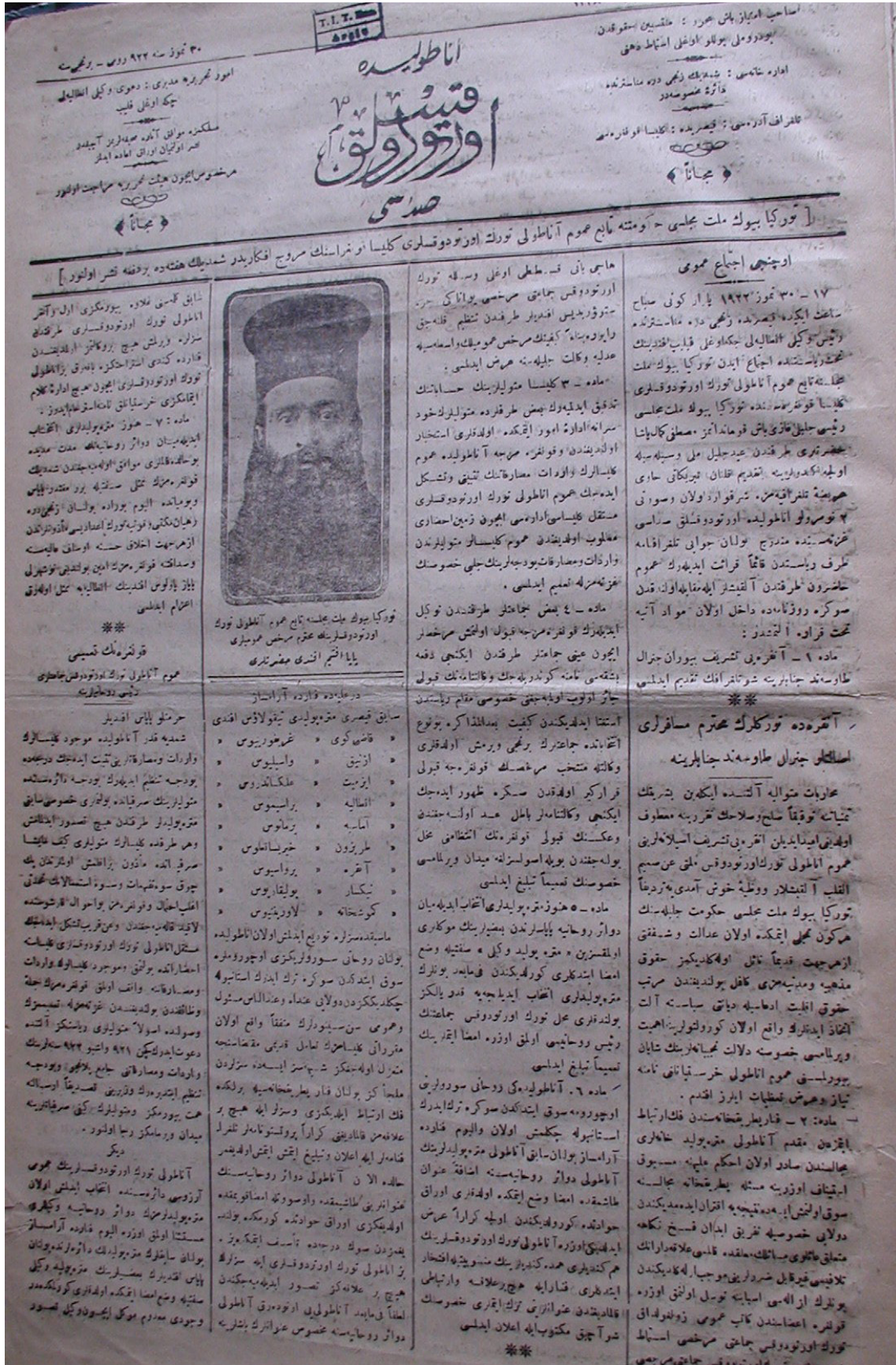
Anadolu'da Ortodoksluk Sadası gazetesinin ilk sayisi.