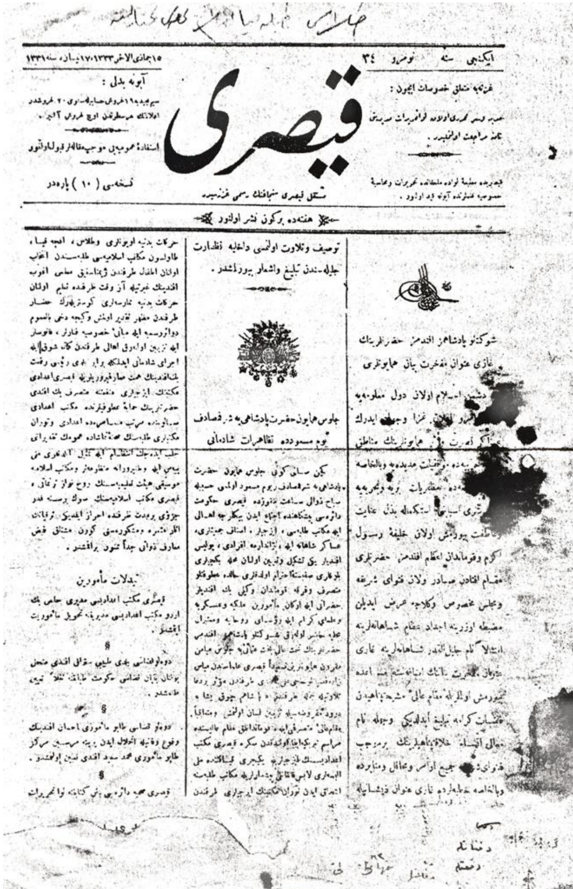
Kayseri gazetesinin ikinci yılında çıkan 34. sayısı