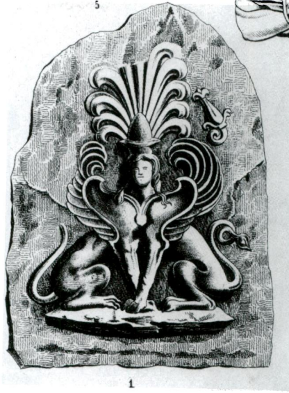
Resim 4 - Pella'da bulunmuş olan terra cotta akroter (O. Jahn, Lauerforter Phalerae, Festprogramm zu Winckelmanns Geburtstag am December 1860, s. 9, lev. III/1).