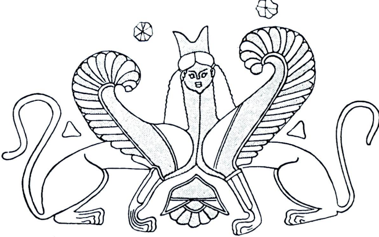
Resim 3 B - Tek başlı çifte gövdeli sfenks motifinin çizimi (H. Payne, Necrocorinthia , s. 275, no. 94-96, lev. XVI/14).