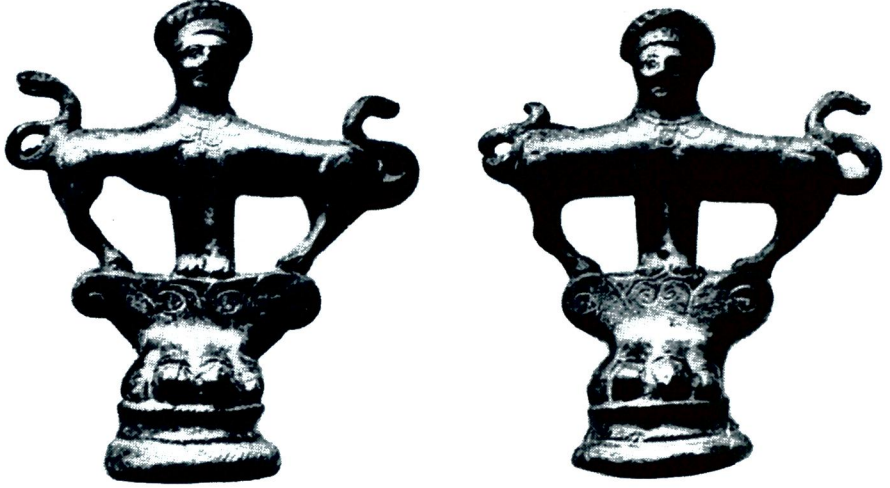
Resim 6 - Cista ayakları (E. Pernice, Untersuchungen zur antiken Toreutik, Oesterreichische Jahres-hefte , c. VII, s. 171-172, res. 85).