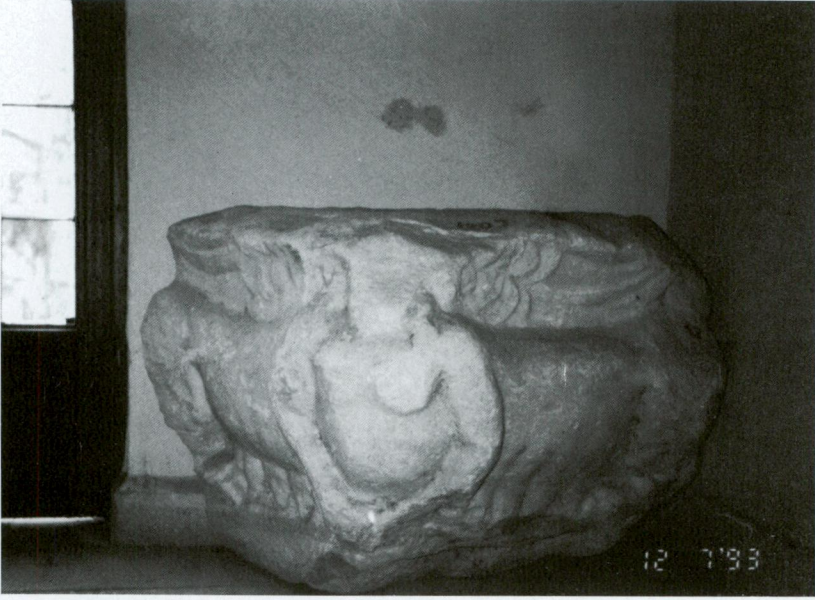
Resim 1 - Edirne Müzesi'nde bulunan Ainos kökenli dikdörtgen planlı altlık.