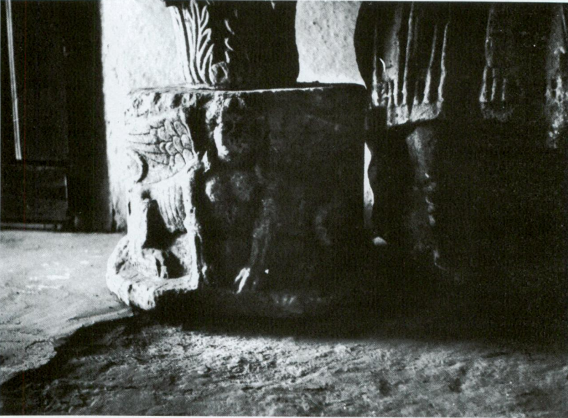
Resim 2 - Edincik'teki özel bir koleksiyonda bulunan dikdörtgen planlı altlık.